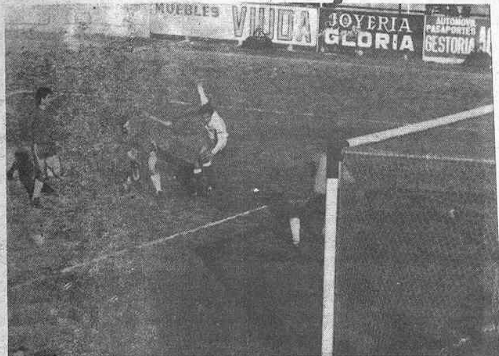
La delantera torrevejense atacó continuamente llegando siempre a la meta