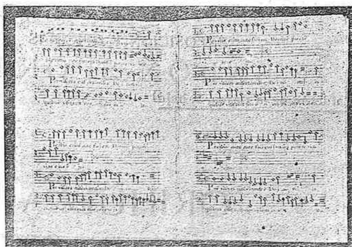
*Autógrafo del Maestro Ginés Pérez que se conserva en el Archivo de Música de la Catedral de Segorbe.