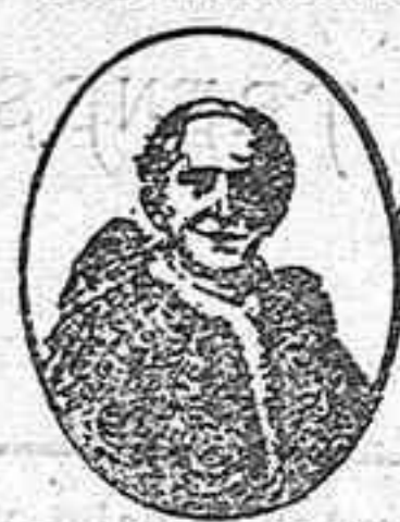
Marca regi tradas

Cerería León XIII Clases litúrgicas Garantizadas