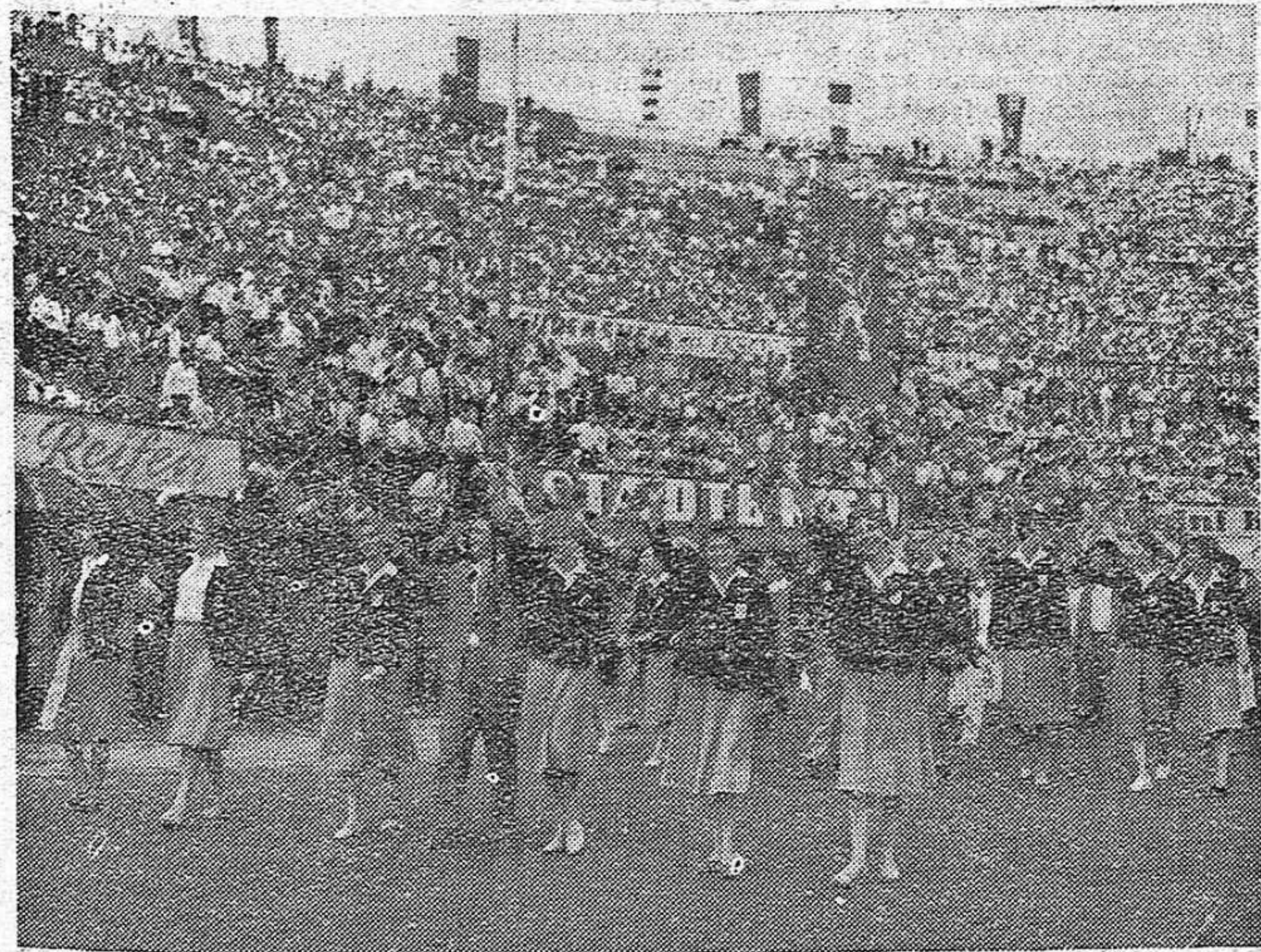
Desfile de Clausura del VII Festival en Viena, 1959. La delegación checoslovaca.