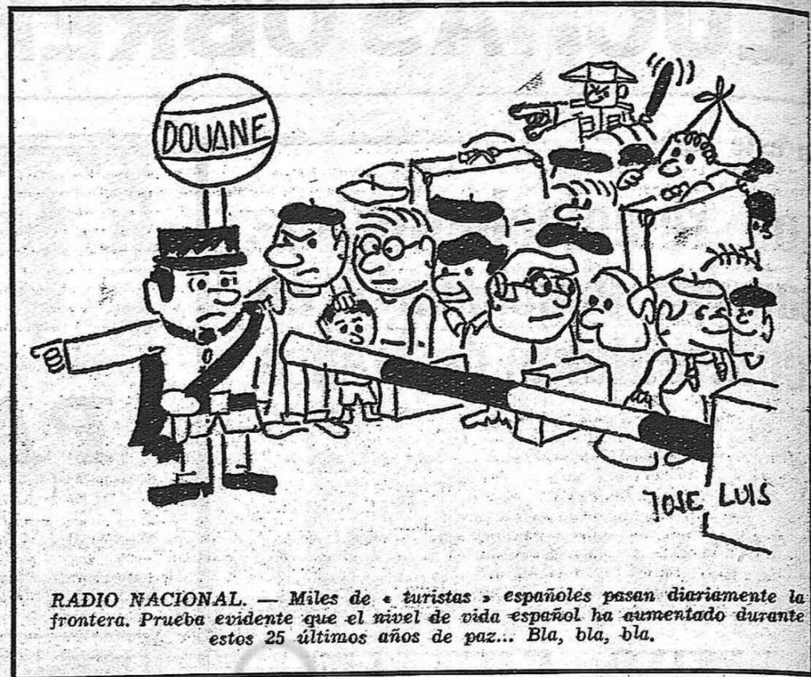
RADIO NACIONAL. — Miles de «turistas» españoles pasan diariamente la frontera. Prueba evidente que el nivel de vida español ha aumentado durante estos 25 últimos años de paz... Bla, bla, bla.

Concluiremos aquí esta enumeración. En nuestros próximos artículos, penetremos con más detalle y ejemplos concretos en cada uno de estos aspectos. No dudamos que los lectores de L.P.E. nos aporten también su contribución a este estudio, enviándonos los datos que su experiencia vivida les ha proporcionado.