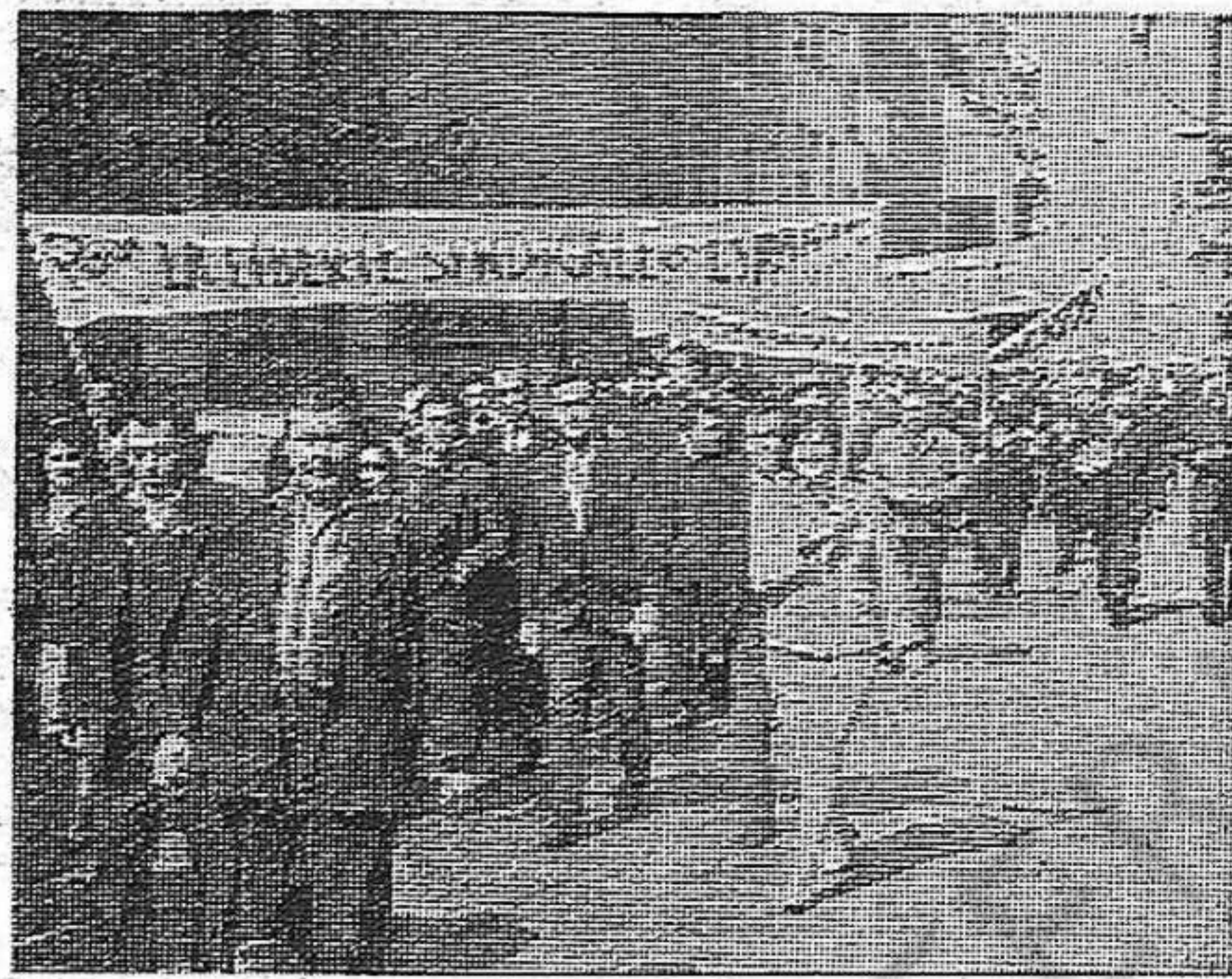
Strasbourg (Francia). — Manifestación del 1. de Mayo.