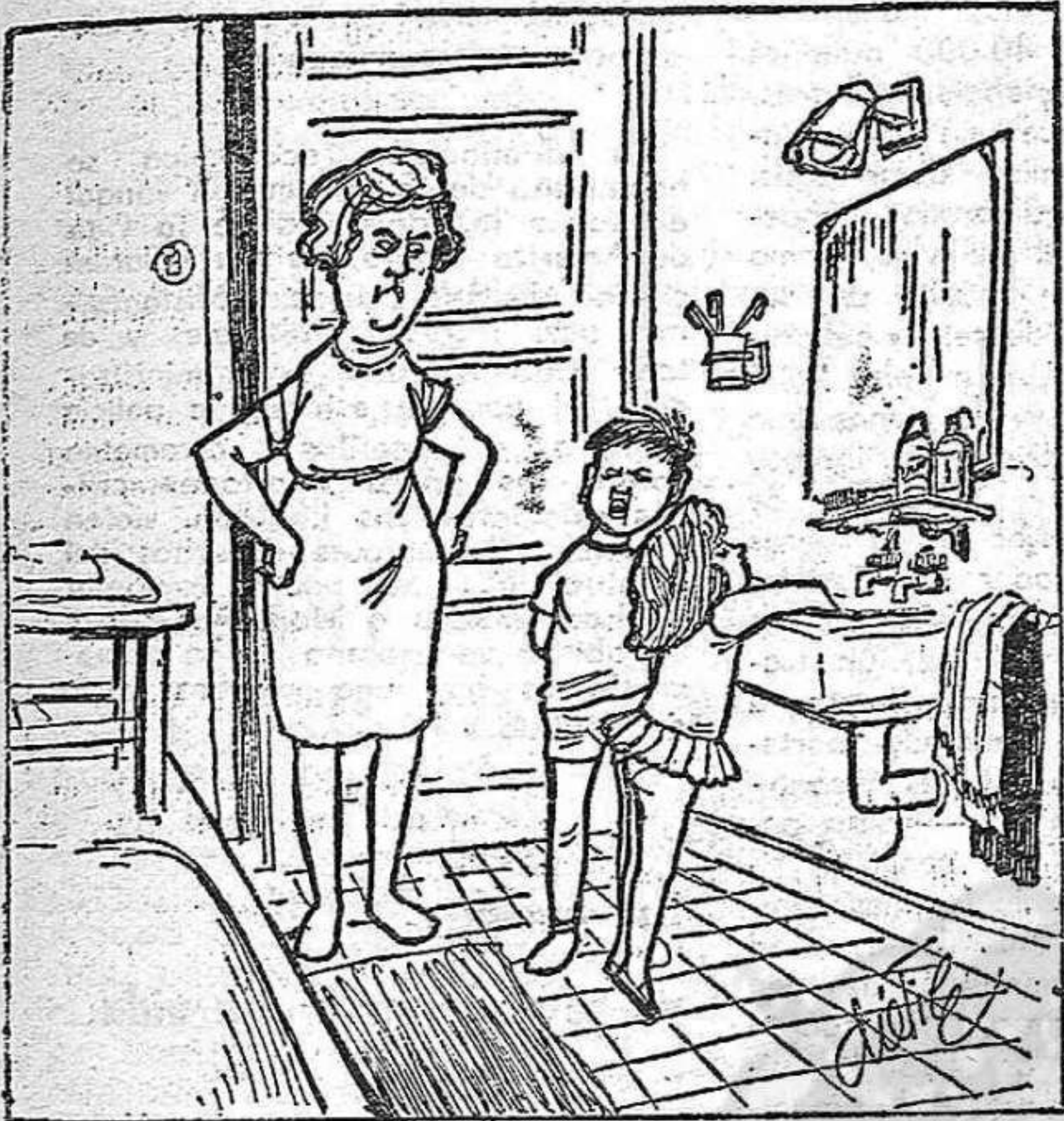
— ¡La cosa está clara...! Antes era porque no llovía, pero ahora es que nos lavamos demasiado... («Ya», mayo del 65.)

contrarlo, porque para ellos no hay restricción, sino simplemente, no hoy agua.