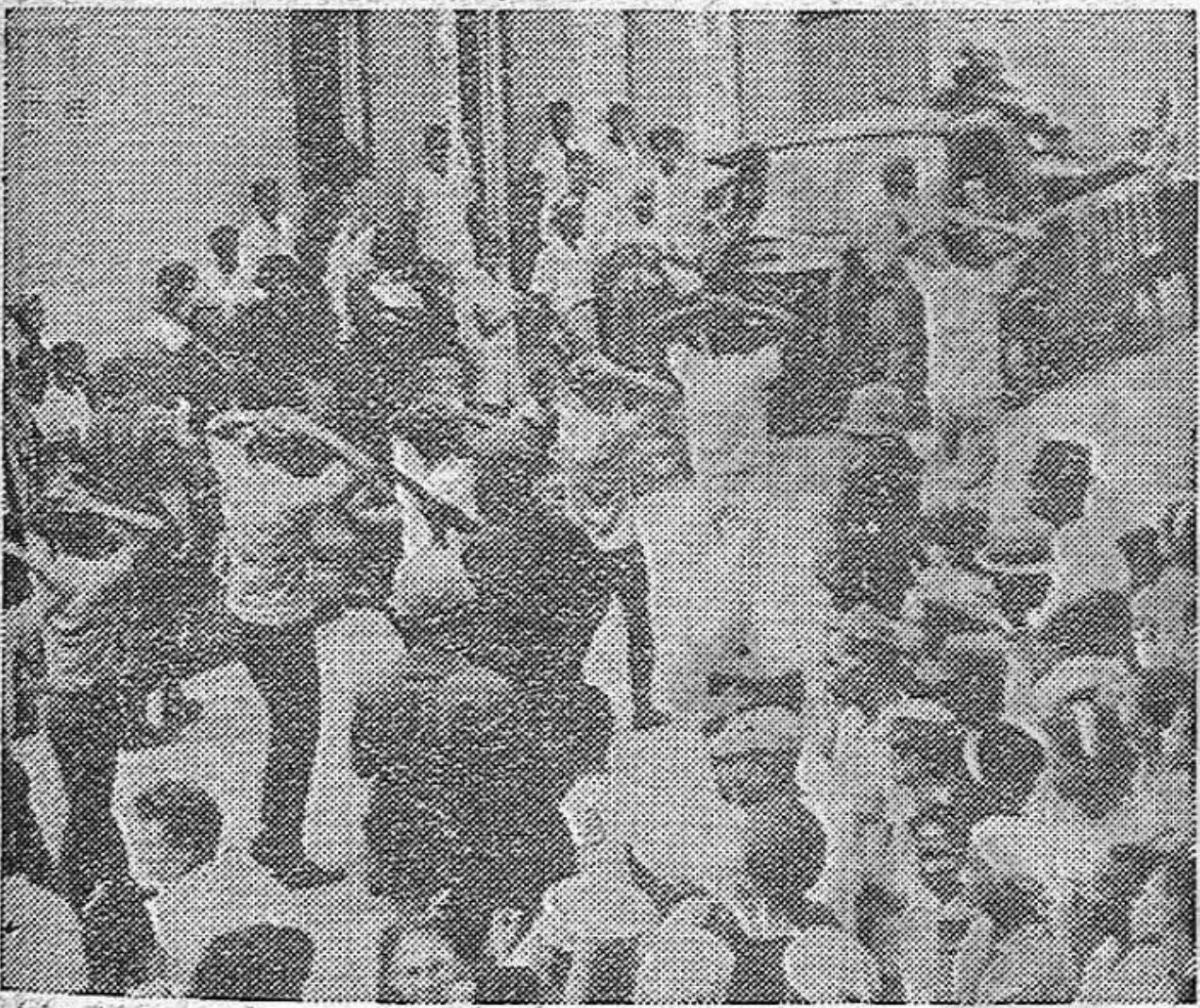
Santo Domingo. Patriotas detenidos, obligados a desfilar ante los yanquis.