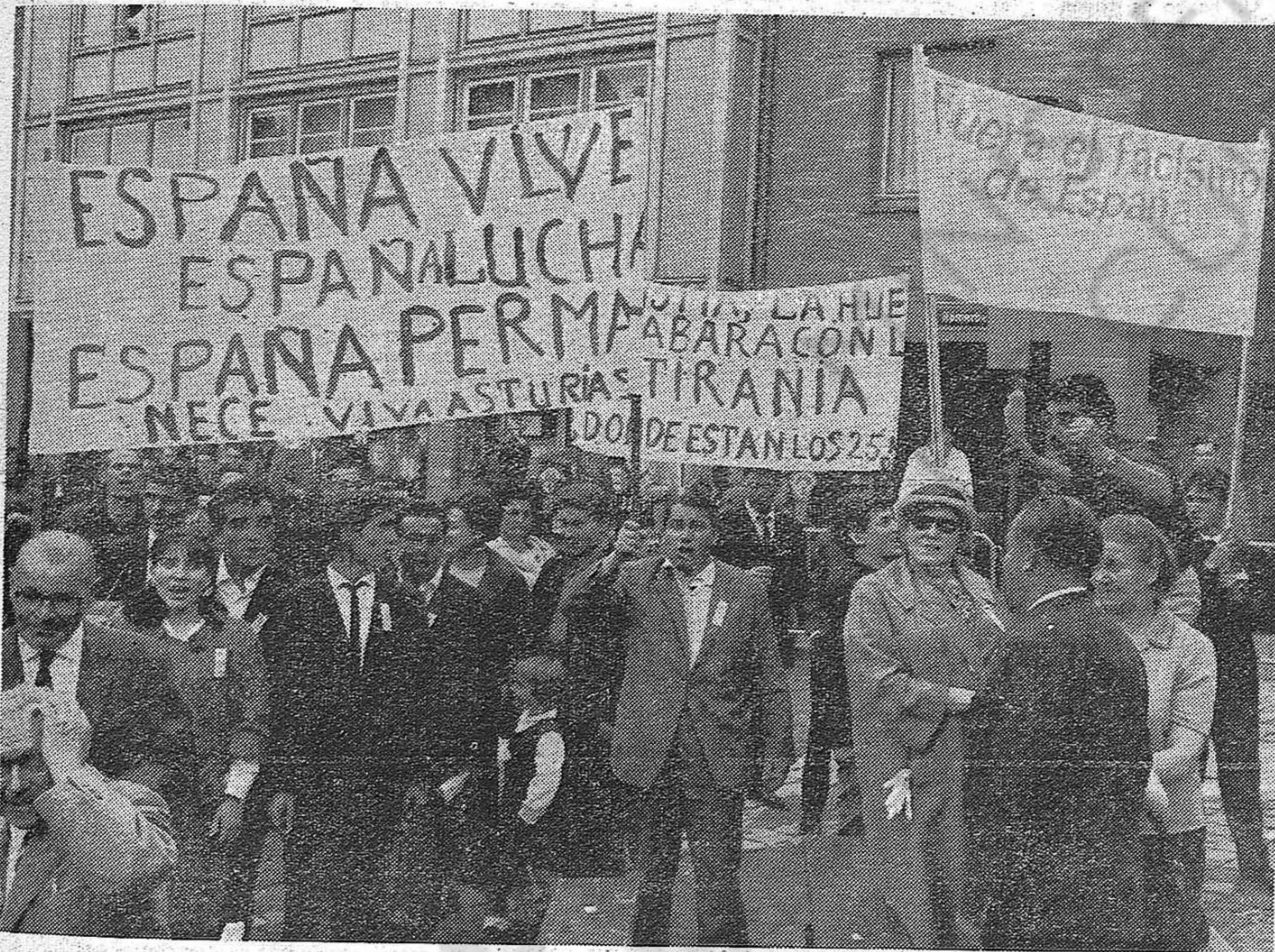
Miles de trabajadores españoles emigrados participan en las tradicionales manifestaciones del 1 de Mayo en Alemania, Bélgica, Suiza, Holanda, etc. En esta foto, vista parcial del grupo español en la manifestación contra la guerra y el fascismo de Frankfurt/Main, el 24 de septiembre de 1964.