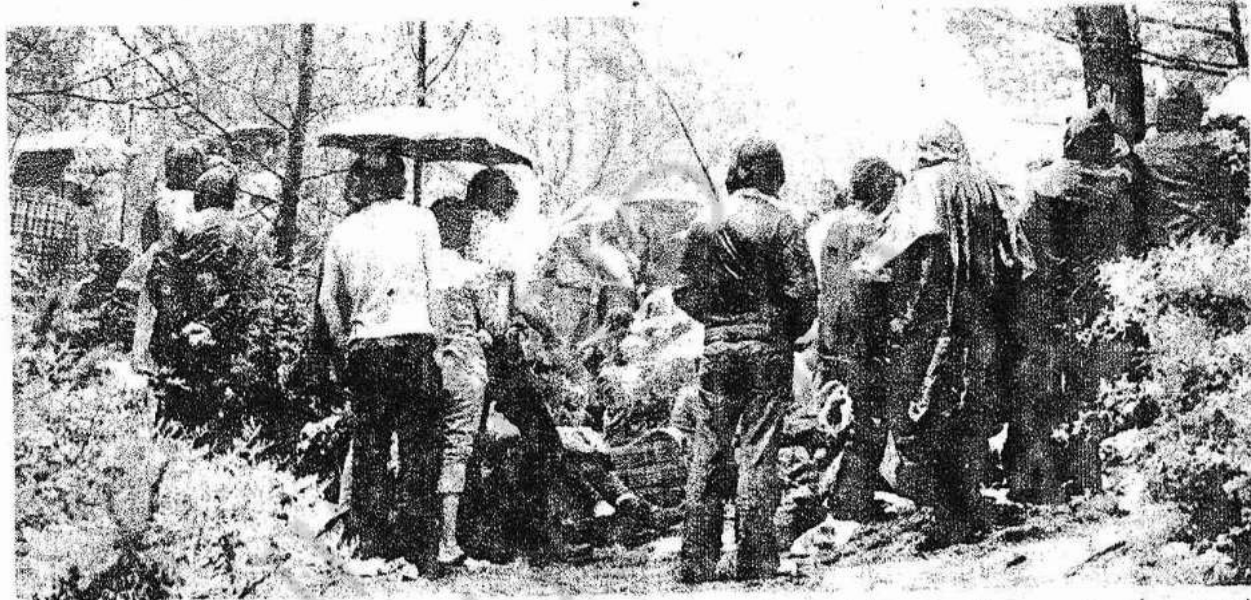
Asamblea Democrática de Barcelona. Reunión en el campo (14-7-74)

Un gobierno que disuelva y prohíba a las organizaciones fascistas, que desarticule su aparato represivo y que depure al ejército de los cuadros o mandos fascistas. Que tome las medidas necesarias para impedir el sabotaje de la economía y la producción por parte de la reacción. Ese es el gobierno que recla