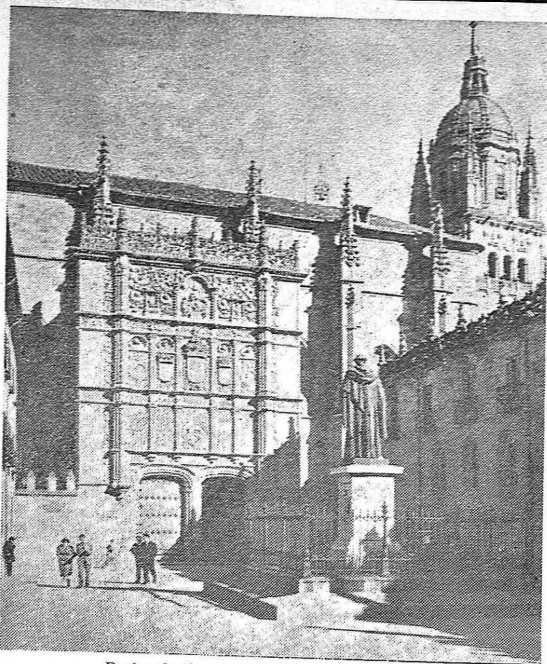
Patio de la Universidad de Salamanca