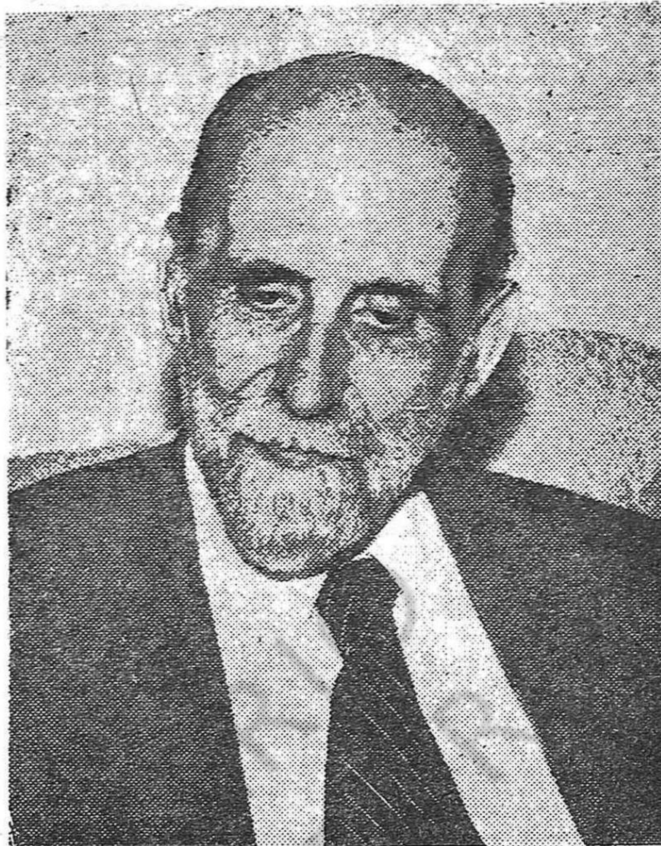
Al cerrar nuestra edición se ha hecho pública la noticia de la concesión del Premio Nóbel de Literatura de 1956 al gran poeta español Juan Ramón Jiménez, que vive fuera de España desde 1936.

Faltos de espacio para comentar en este número tan importante acontecimiento, nos limitamos a registrarlo, prometiendo reseñarlo debidamente en el próximo número.