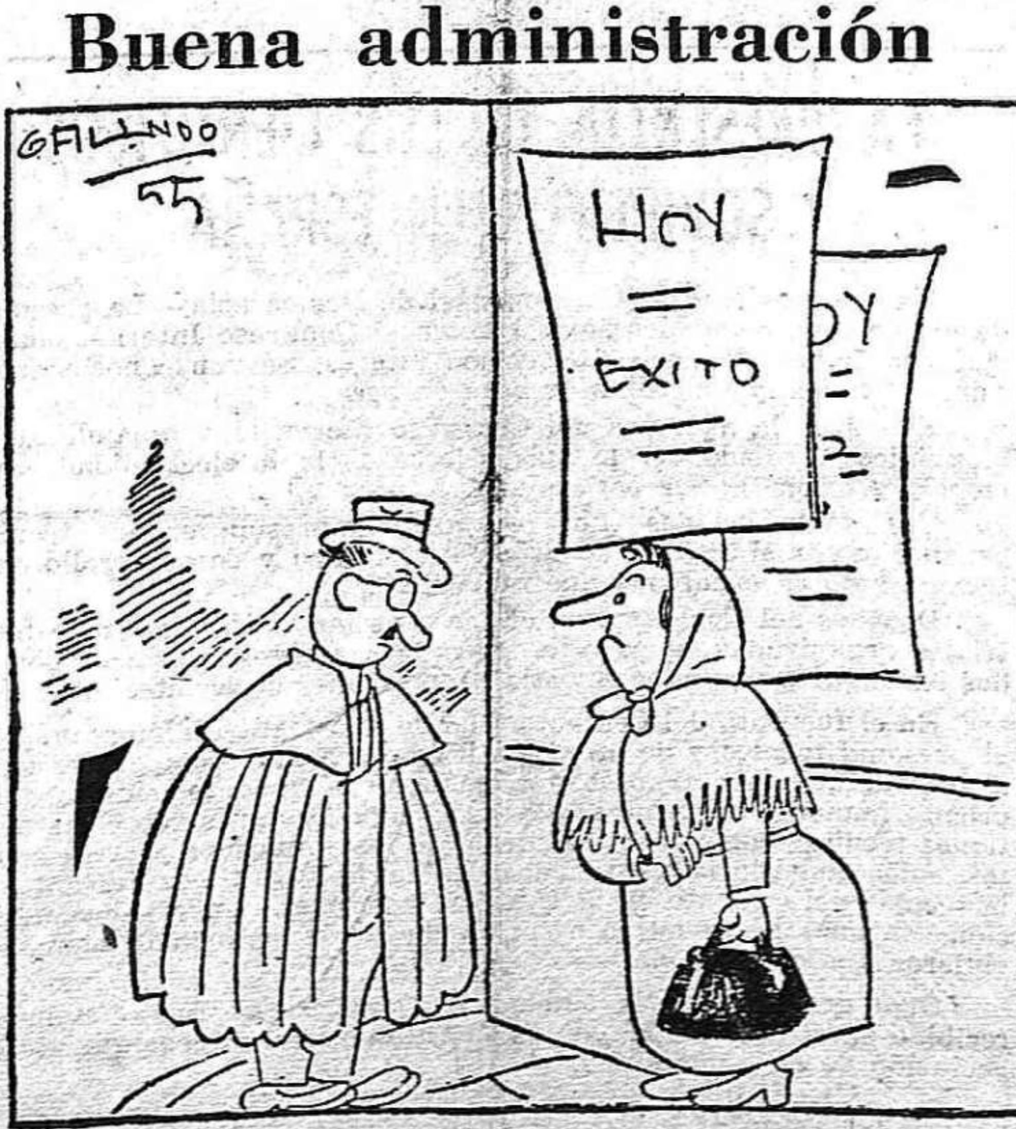
—Desengáñese, lo más económico es el cocido. —Díce que lo comen ustedes todas la semana? —Sí; los lunes, la sopa; los martes, los garbanzos; los miércoles, el tocino; los jueves, la carne; los viernes, el repollo; y los sábados, la patata.

Después de la catástrofe de las cosechas cerea-