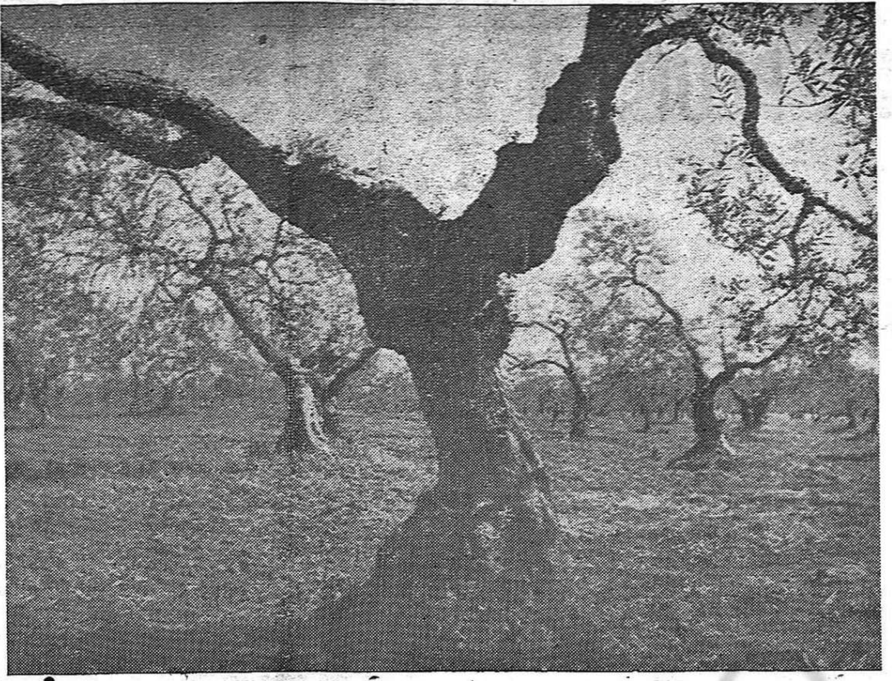
Hambre y miseria, malas cosechas y brutal explotación. Esto es lo que hay en el campo de Sevilla. Las cosechas de otoño casi se han perdido. La aceña tina de almazara está picada. Los campesinos no tienen pan las protestas delante de los ayuntamientos se suceden. En Lebrija esas manifestaciones tomaron tal ímpetu que el alcalde huyó a Sevilla. Pero las voces de los campesinos arrecian. Los tiempos están cambiando.