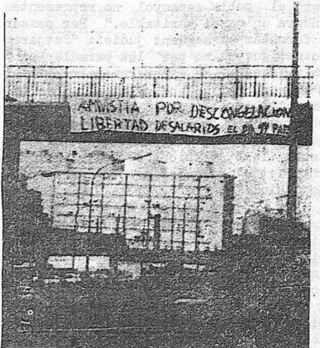
Pancarta a Barcelona (Meridiana)

Unes 250 persones van anar a Sindicats el dia 11 a lliurar un document per l'amnistia, contra el decret antiterrorista, contra la congelació salarial i per la readmissió dels despatxats de SAFA. Van penetrar al local sindical, on van fer un breu míting. A la sortida, manifestació pels carrers.