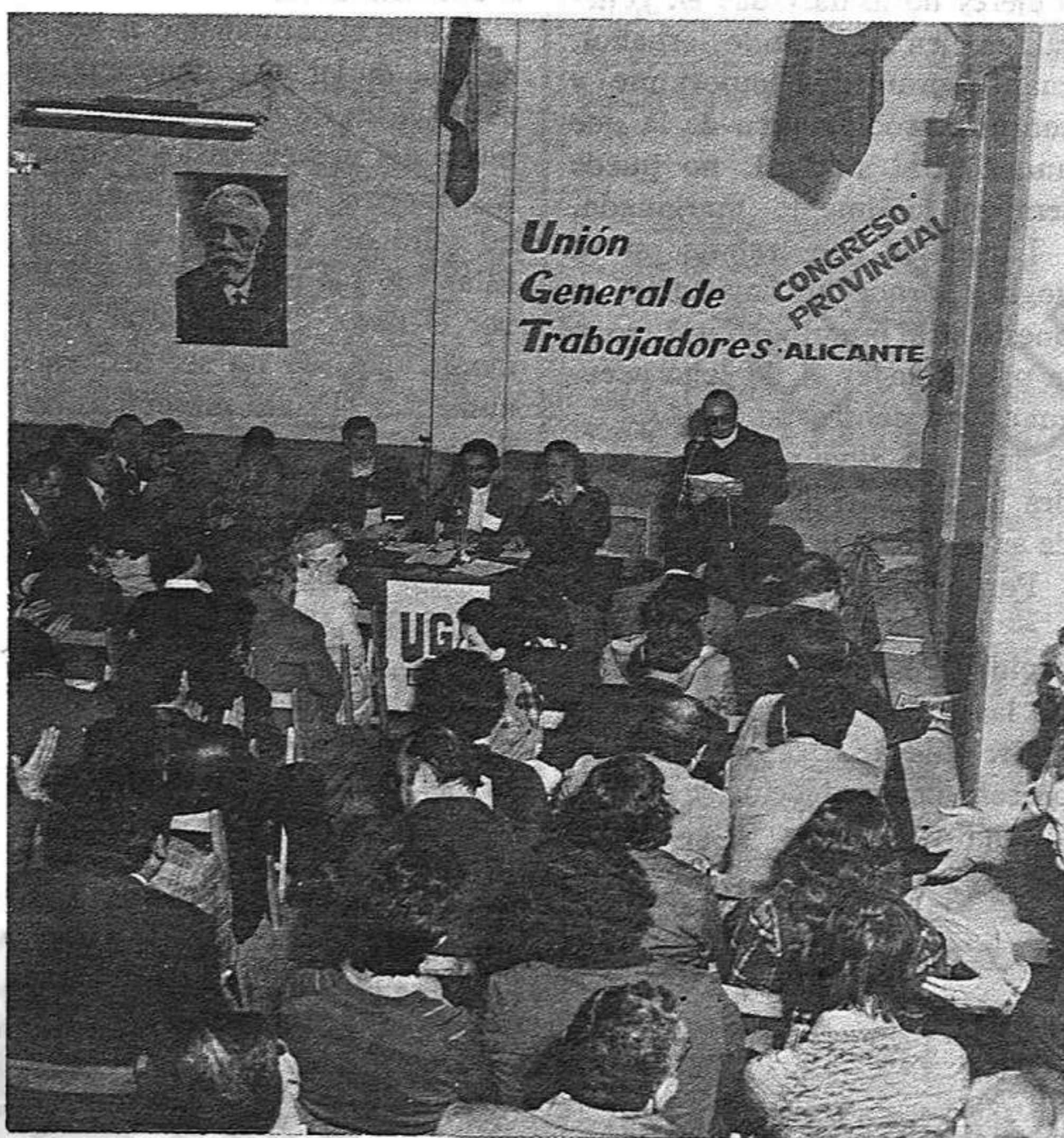
Un momento de los debates del Congreso.

Los debates se centraron en torno a los estatutos de la federación, que fueron aprobados, y la explicación de la gestión del actual Comité, que fue aprobada por unanimidad, siendo sus miembros ratificados en sus cargos.