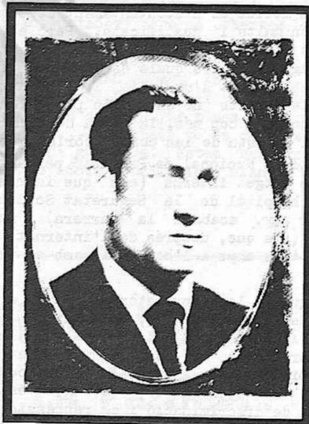
(Fotografia de la làpida de su nicho en el cementerio)

por defender la dignidad y la libertad de la clase obrera