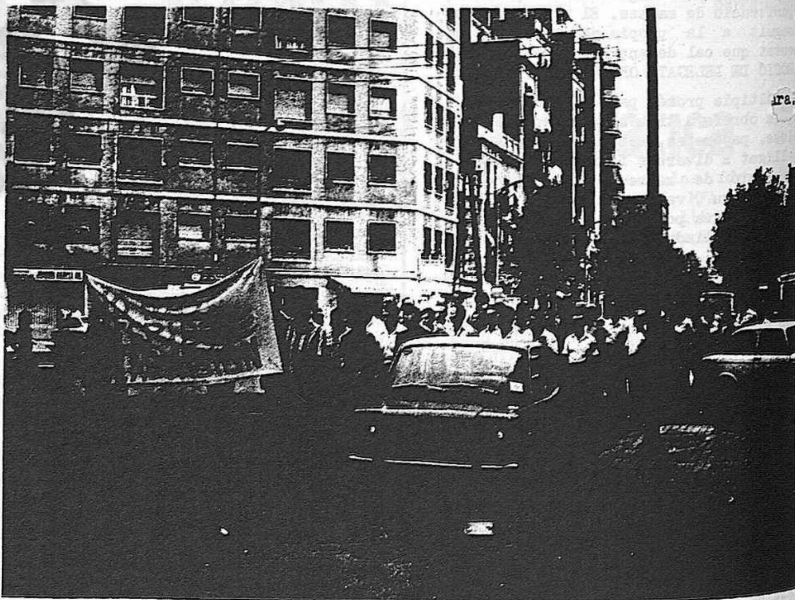
Els obrers de la S.F.Vila es manifesten pel Poble Nou, durant les accions del setembre.

Aquesta situació de lluita i les seves grans possibilitats, posen novament damunt de la taula l'exigència de trobar a cada moment les formes de DIRECCIÓ POLITICA més adients, de lligar-se als centres fonamentals de lluita, d'actuar públicament al capdavant de les masses.