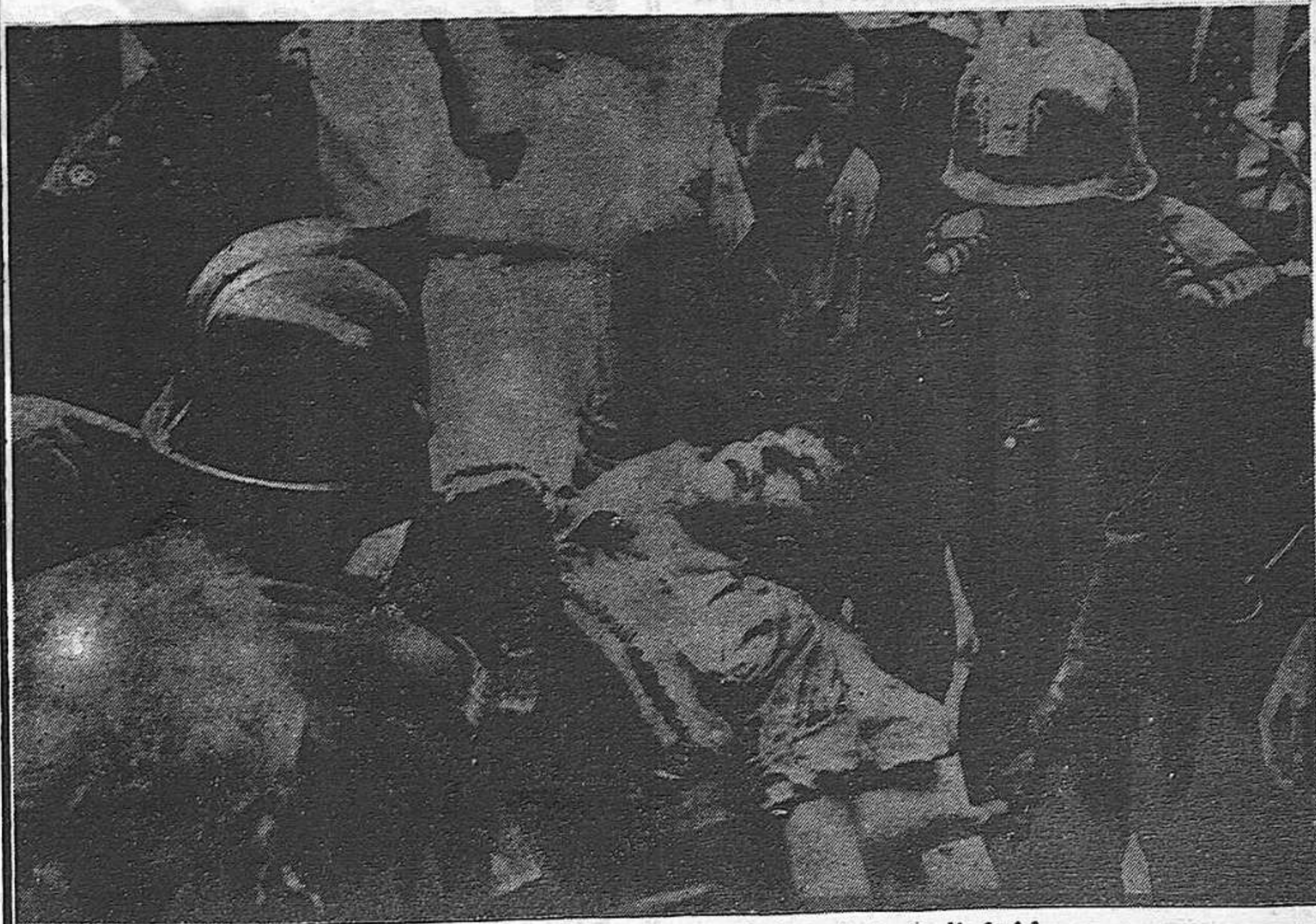
Auxili a un dels ferits per l'atemptat de Madrid