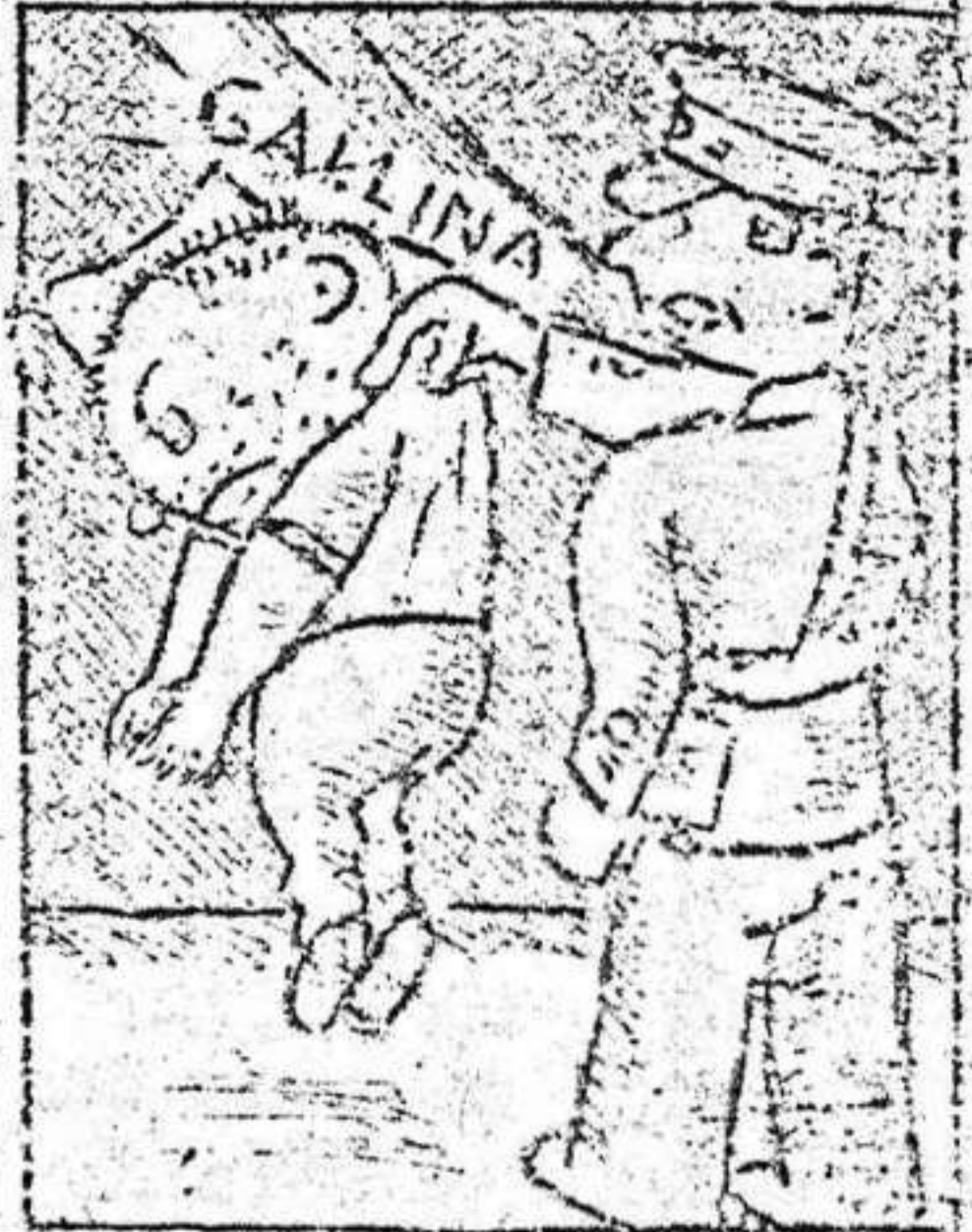
2. Chaquetea sin disimulo cuando le pinchan el c...