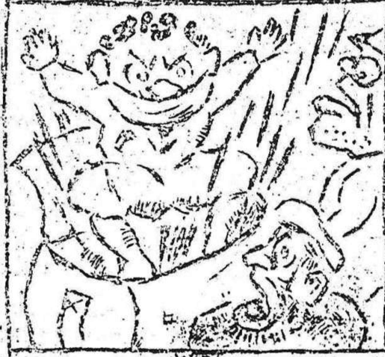
2. Y hay un chasco soberano cuando sale el italiano.