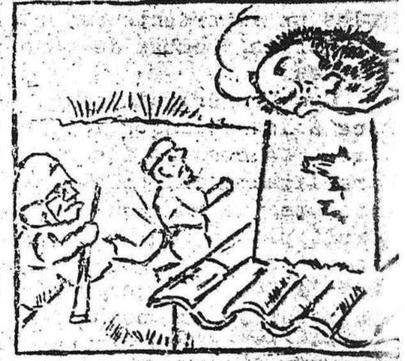
3. Metido en la chisneca. "Macuto" se carga.