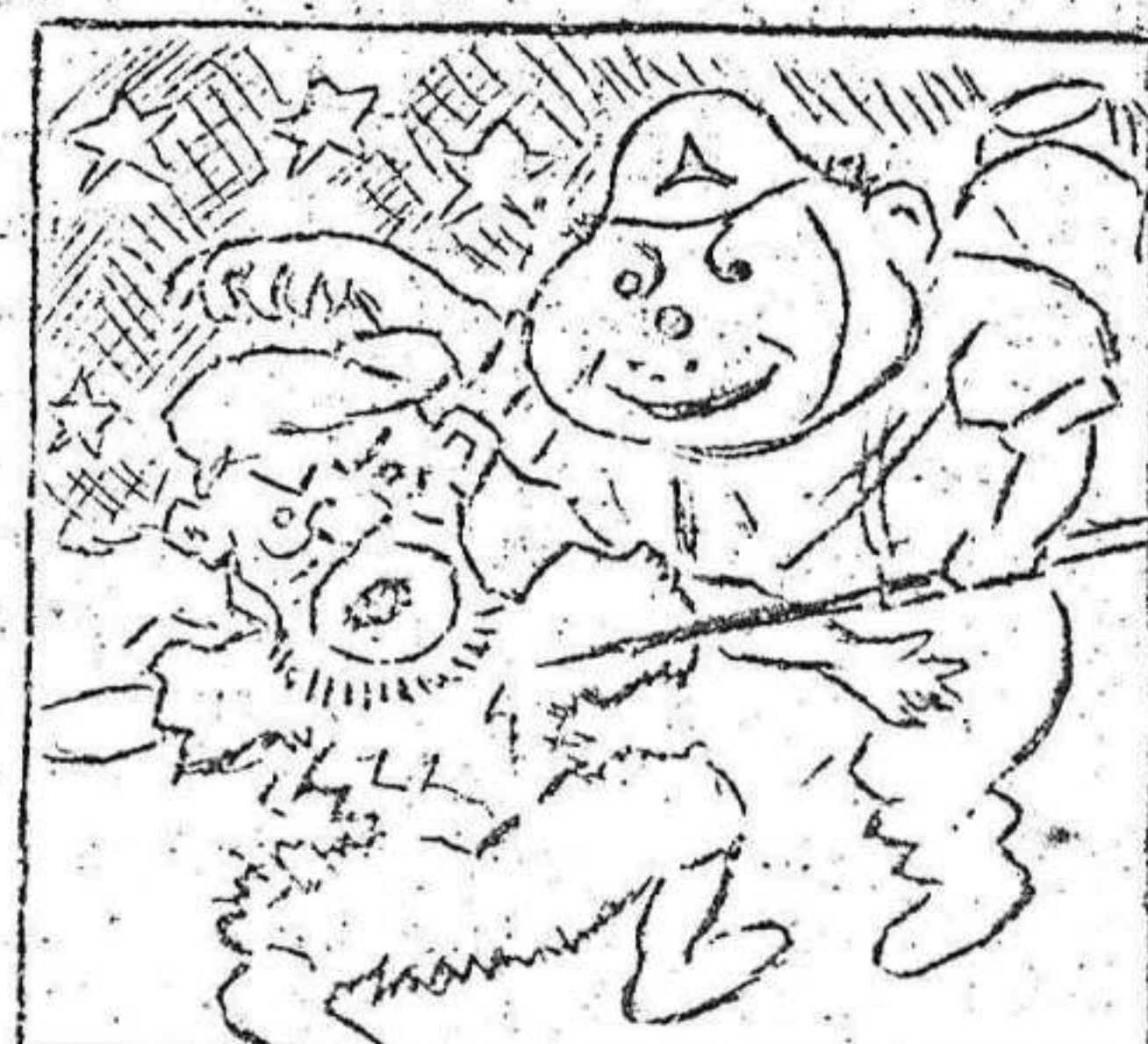
3. "MACUTO" salta ligero, y lo coge prisionero. -