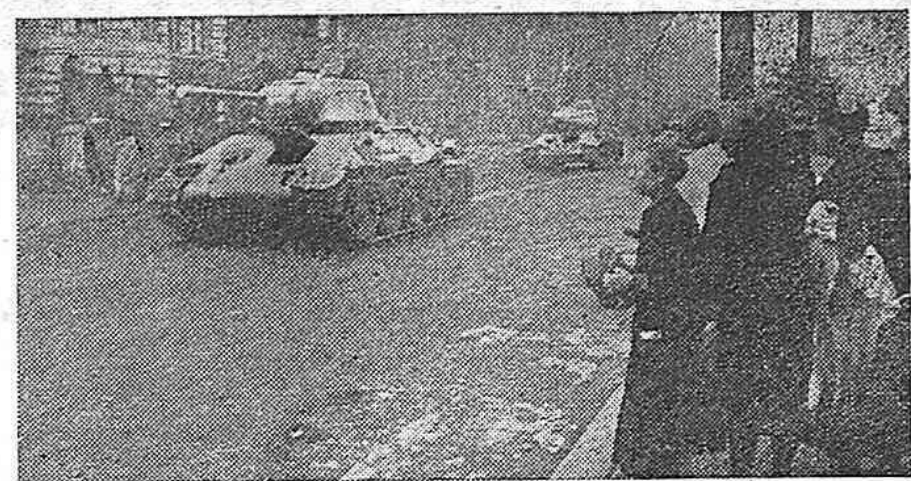
Els tancs soviètics entren a Berlín

El dia 2 del proper mes de maig farà tres anys que els soldats soviètics, després d'una victoriosa ofensiva, van acabar l'ocupació total de Berlín, CENTRE DE L'IMPERIALISME ALEMANY I FOGAR DE L'AGRESSIÓ ALEMANYA. Avui, al cap de tres anys d'aquell esdeveniment històric, la política expansionista dels imperialistes ianquis cerca, un altre cop, fer renèixer una Alemanya capitalista, al servei de l'agressió antidemocràtica i antisoviètica. Les forces de la pau i de la democràcia, que són les més fortes, anorran els plans dels provocadors de guerra.