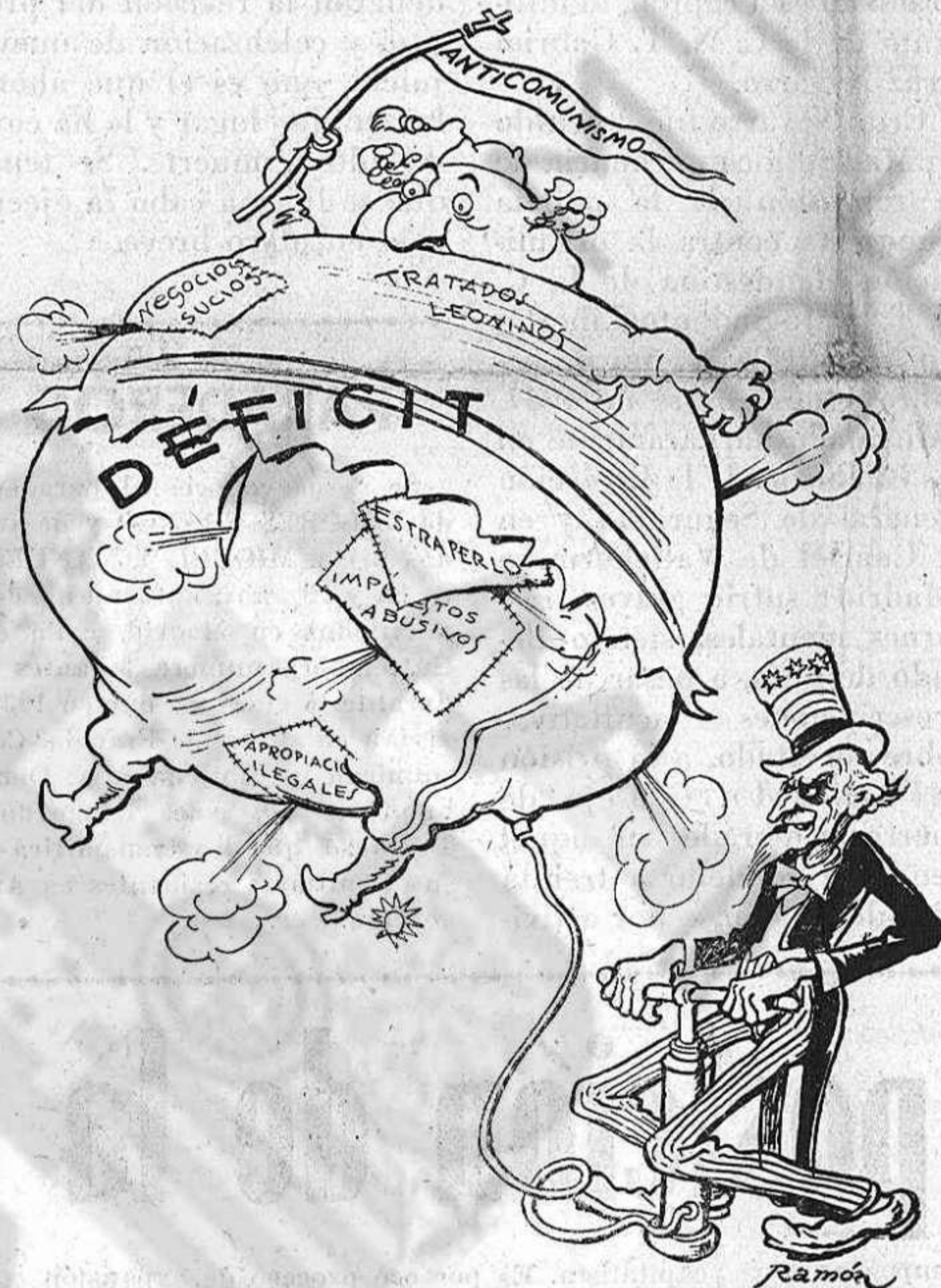
Me parece que tendré que comprar otro globito....

Pero el militante que lo ha sacrificado todo, puede por simples motivos, por un hecho insustancial, y a veces sin fundamento alguno, ser calumniado y puesto en evidencia, y verse obligado a soportar la invidia del adversario y hasta del