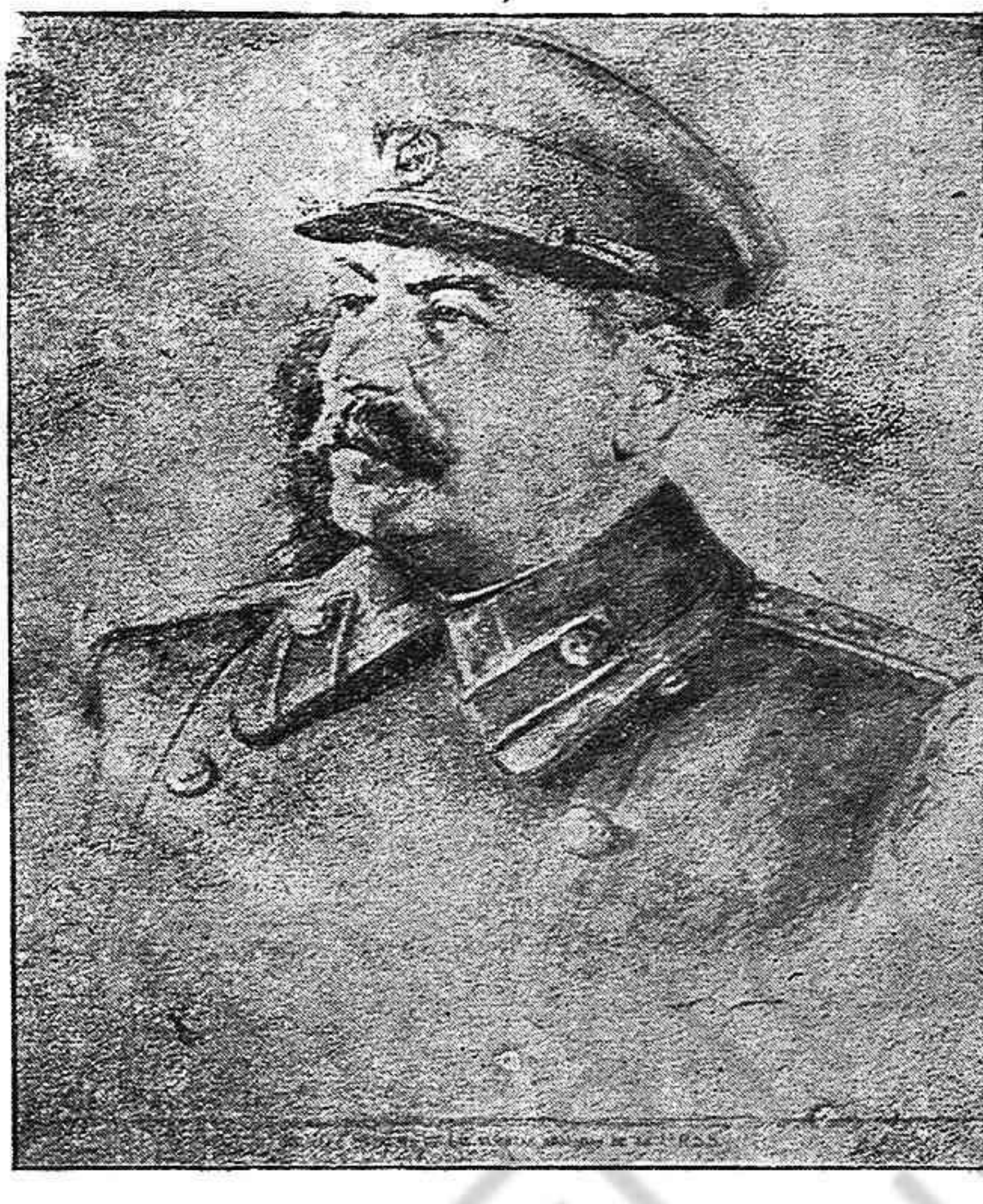
Stalin, jefe del Estado Soviético, en un momento de su discurso.

Por lo que se refiere a 1940, nuestro país ha producido durante ese año: 15.000.000 de toneladas de hierro colado, o sea cuatro veces más que en 1913, 18.300.000 toneladas de acero, o sea casi cuatro veces y media más que en 1913, 166.000.000 de toneladas de hulla, o sea cinco veces y media más que en 1913, 31.000.000 de toneladas de petróleo, o sea tres veces y media más que en 1913, 38.300.000 toneladas de cereales, o sea 17.000.000 millones de toneladas más que en 1913, 2.700.000 toneladas de algodón bruto, o sea tres veces y media