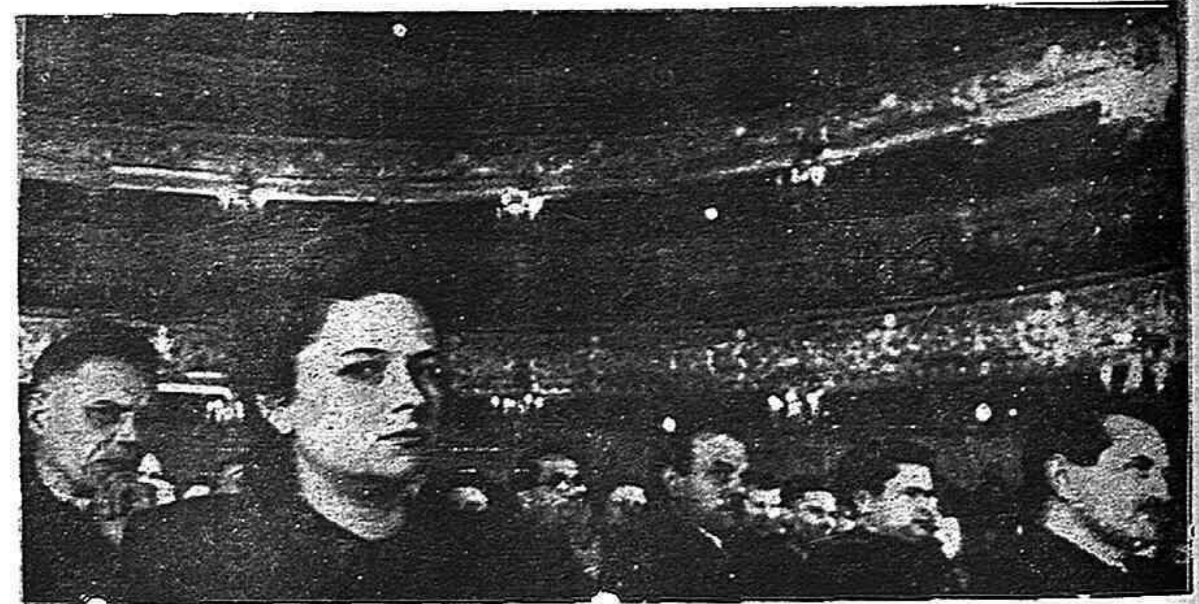
En el Teatro Kirov de Leningrado. Acto celebrado en vísperas de las elecciones generales soviéticas para apoyar la candidatura del Mariscal Góvorov, el gran estratega que derrotó a los nazis en las inmediaciones de la ciudad heroica y los expulsó más allá de los límites de las fronteras soviéticas.

¡Ayuda al pueblo de España! ¡Muerte al fascismo falangista!