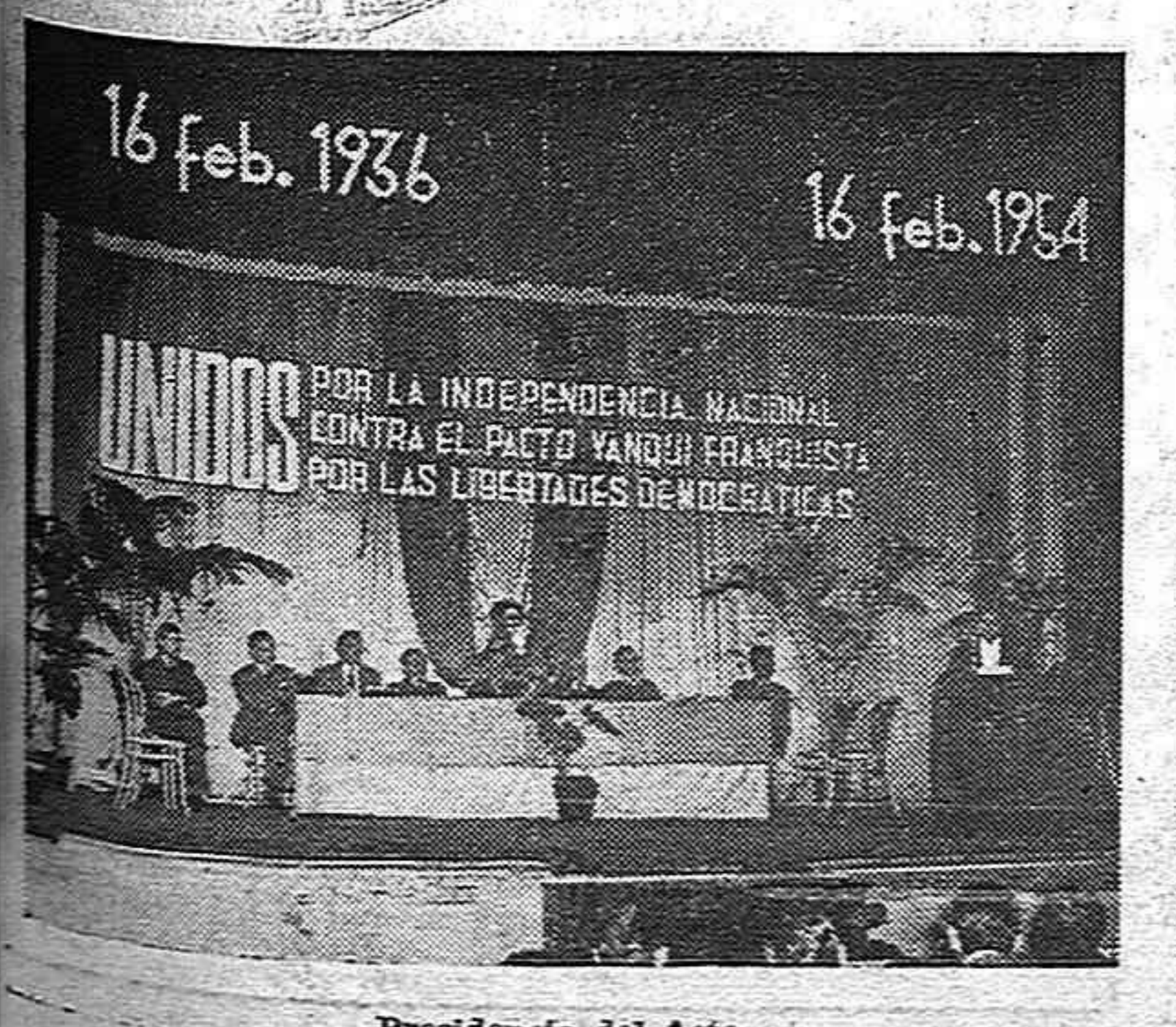
Presidencia del Acto