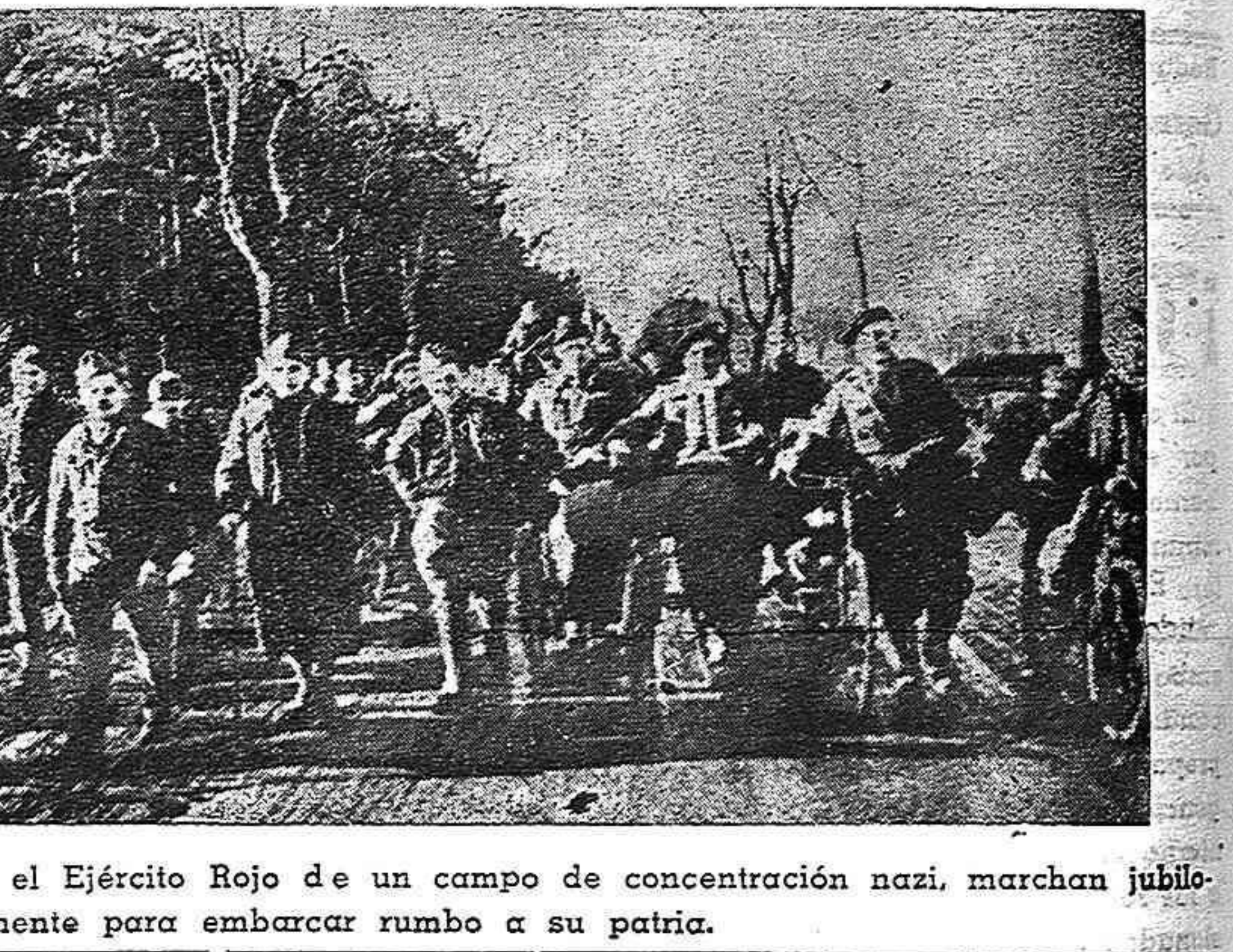
Soldados franceses, liberados por el Ejército Rojo de un campo de concentración nazi, marchan jubilosamente para embarcar rumbo a su patria.

España debe transformarse rápidamente en un mar de fuego que abraza por todas partes al maldito falangismo, que lo ahogue y pulverice en su propia reacción terrorista sádica. Ningún debilitamiento de la lucha, ninguna ilusión sobre la posibilidad de cambios favorables al pueblo sin nuestro propio intrépido combate. Los antifranquistas y patriotas cuentan con un instrumento poderoso que, fortaleciéndolo y ampliándolo mucho más, es garantía de su libertad: la Junta Suprema de Unión Nacional. El movimiento glorioso de Unión Nacional, esperanza segura de una España sin fascismo, sin regimenes reaccionarios y antipopulares de cualquier marca, tiene que ser rebustecido urgentemente. Por todo el país deben surgir y desarrollarse Juntas de