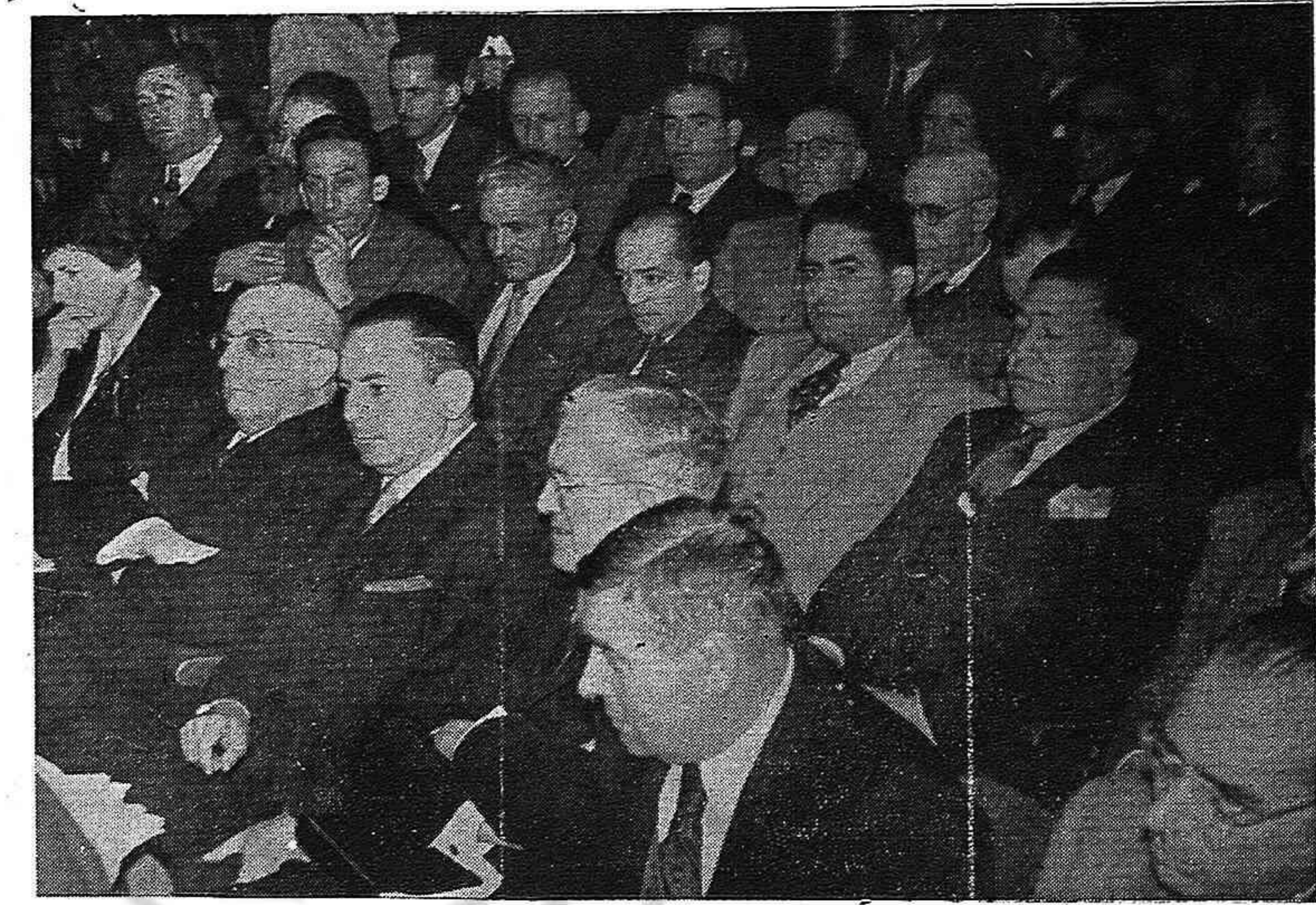
Una vista de la Presidencia del Mitin.