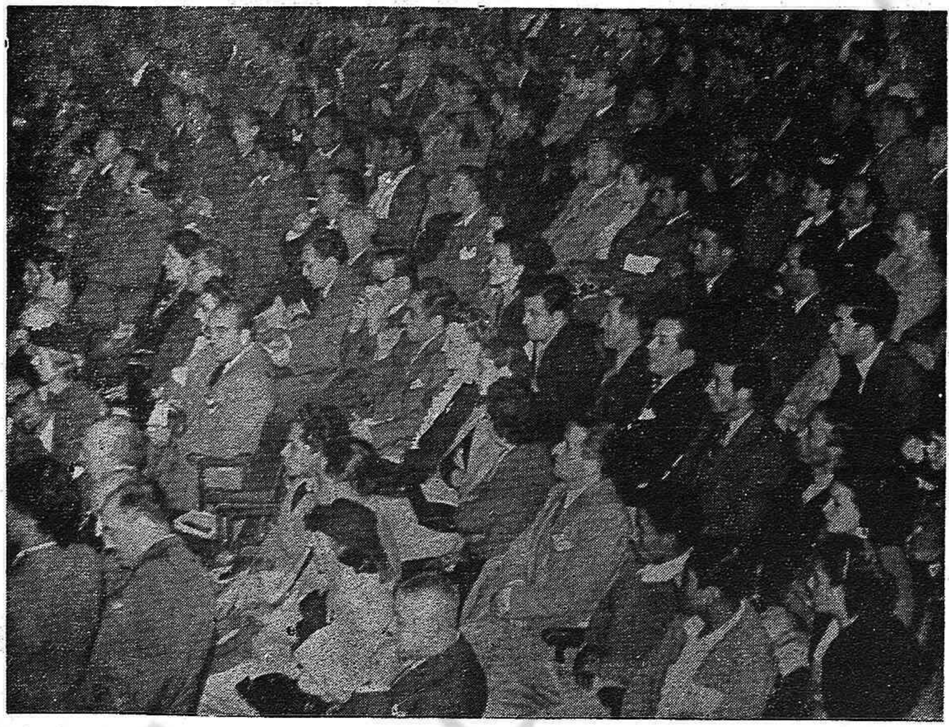
Un aspecto de la concurrencia al gran mitin de unidad.

las utilizó en defensa de las instituciones republicanas. Y, hoy, el pueblo español está en vísperas de levantarse otra vez contra el falangismo entrizado en el Poder, y creo que el Gobierno debe entregar al pueblo todos los medios políticos y físicos necesarios para que el levantamiento próximo se vea coronado rápidamente por el éxito. Se trata de la insurrección nacional contra el fascismo. A algunos no les gusta la palabra. Pero es así. Ya hemos visto a muchos pueblos europeos levantarse en armas contra el fascismo. Ahí tenemos el ejemplo de Francia. Y, nuestro pueblo, que no es menos que otros, se levantará en armas bajo la dirección del Gobierno republicano con el apoyo de todas las organizaciones republicanas y populares.