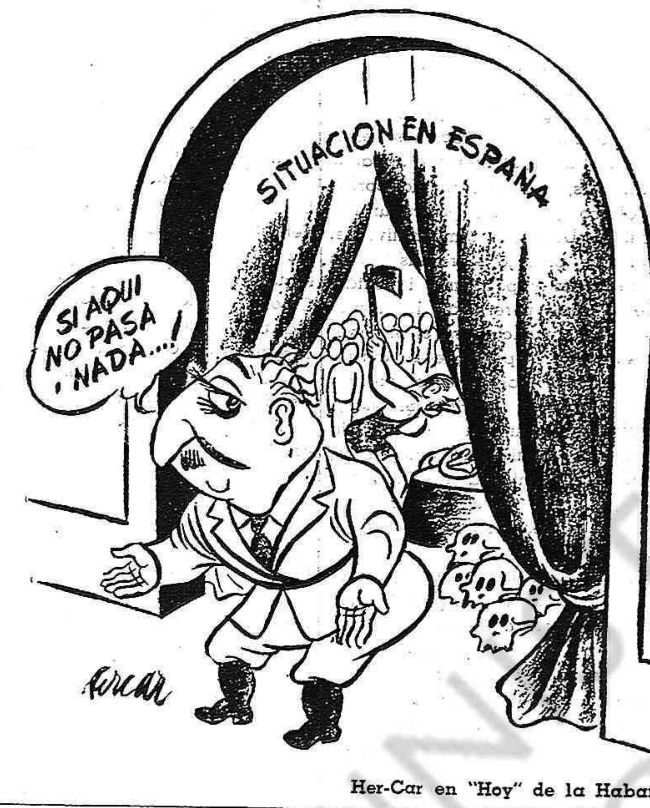
Her-Car en "Hoy" de la Habana.

Mas corrientemente, la lucha es muy movida. Un día en un sitio y al siguiente en otro. Los hombres operan rápidamente; se trata de sorprender al enemigo, de no darle ningún respiro. Tal es la guerra de guerrillas. Un pueblo conquistado puede ser perdido, pero la población tiene confianza y sabe que ella habrá de contemplar el retorno de los guerrilleros.