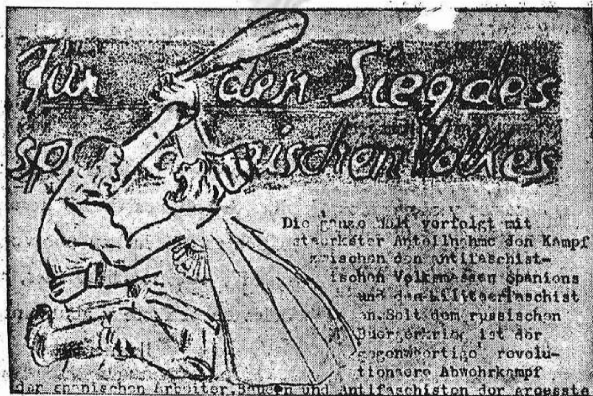
Los antifascistas alemanes editan un folleto en multicopista, del que reproducimos este grabado. En él expresan su adhesión al pueblo antifascista de España

mausoleo a Barbusse, que se convirtió en una grandiosa manifestación de adhesión a nosotros.