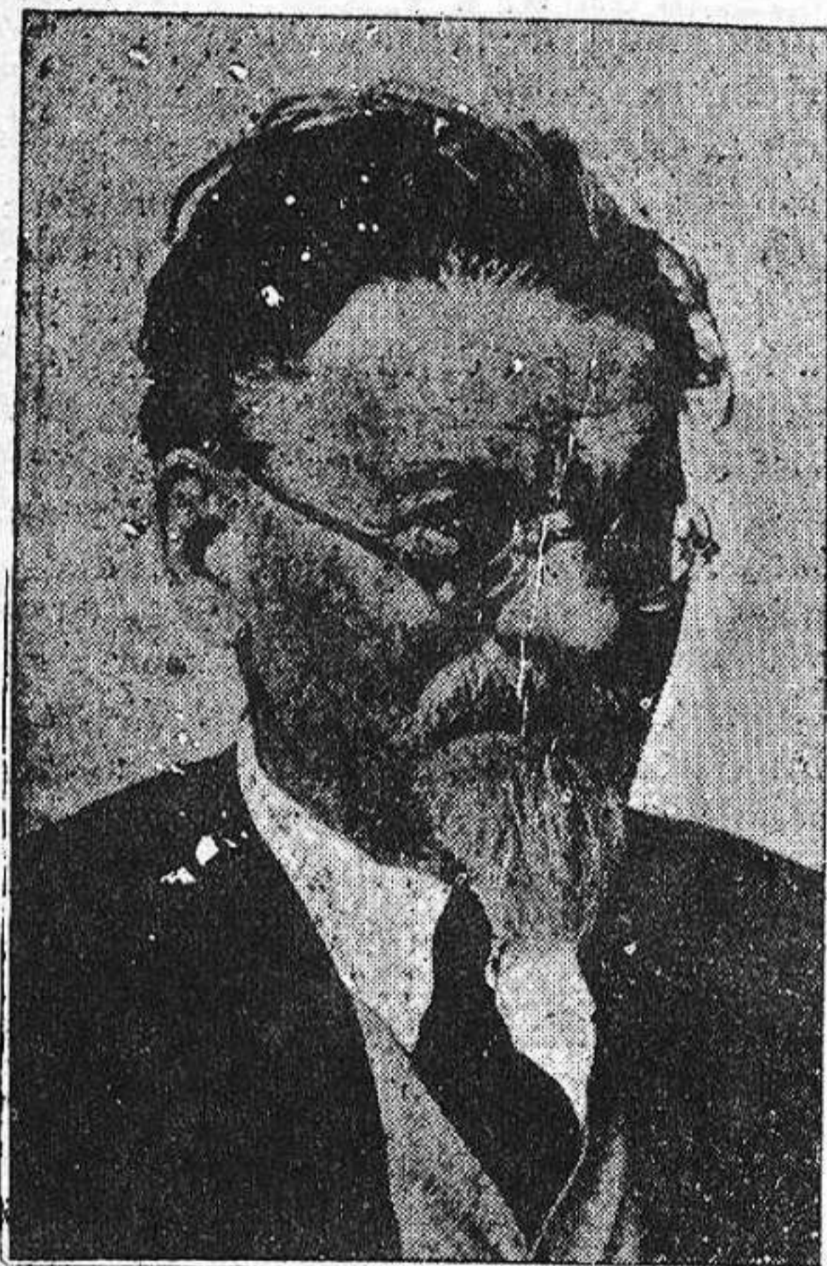
N. L. Kalinin, presidente de la Unión de Repúblicas Socialistas Soviéticas

La Unión Soviética es uno de los más firmes sostenes de la democracia, y como tal no podía faltarnos su ayuda en estos momentos. Desde los más apartados koljoses y sovjoses del Asia central, del Cáucaso, de Siberia es seguida con gran interés la heroica lucha que el pueblo español está llevando a cabo contra el fascismo internacional. En regiones apartadas, miles de kilómetros de España se repiten todos los días los nombres de los lugares donde se encuentran los frentes españoles, y también con cariño y admiración los de los héroes que más se han distinguido en la lucha.