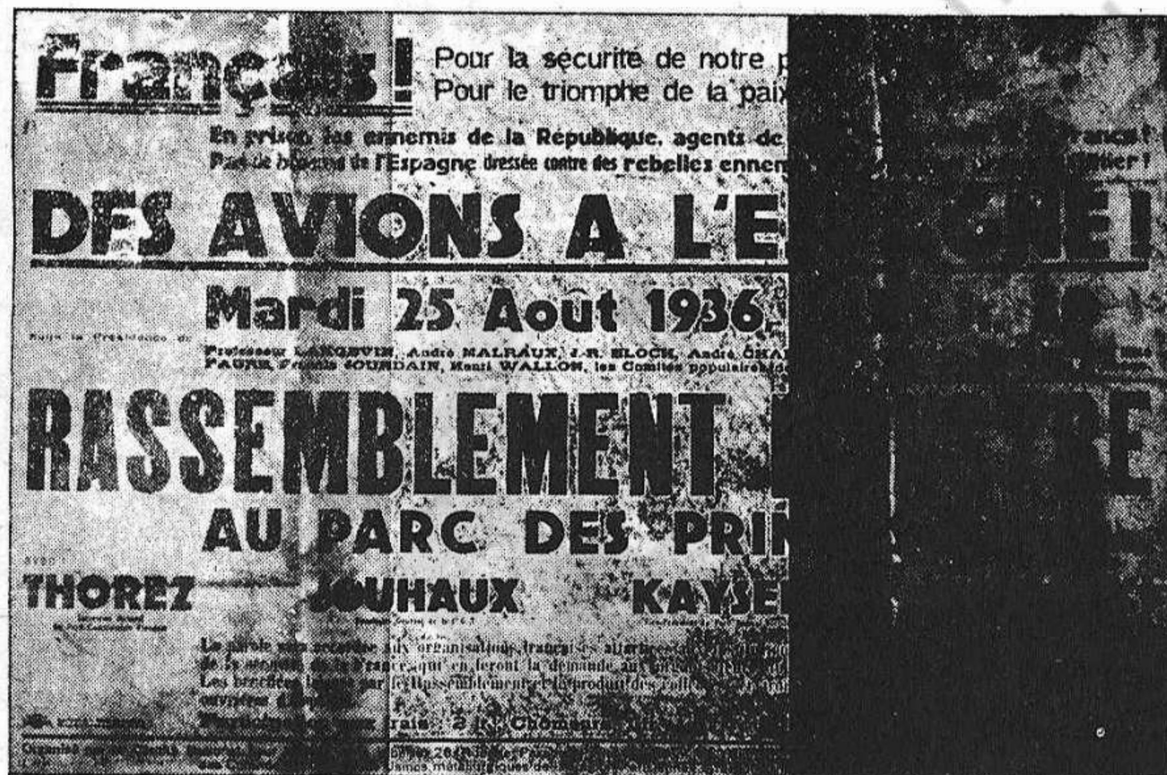
Cartel convocando a una reunión para pedir el envío de armas a España