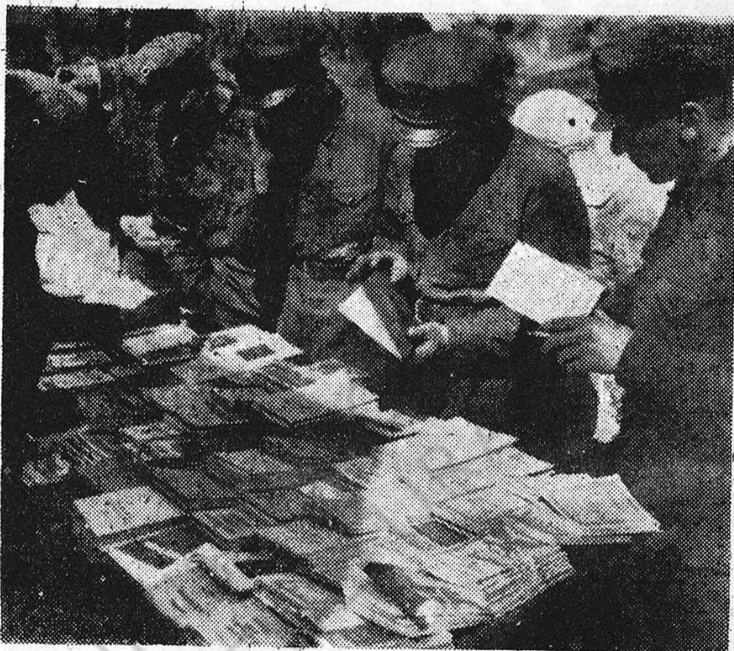
LOS SOLDADOS ROJOS ESCOGIENDO LIBROS EN EL PUESTO DE UN CAMPAMENTO