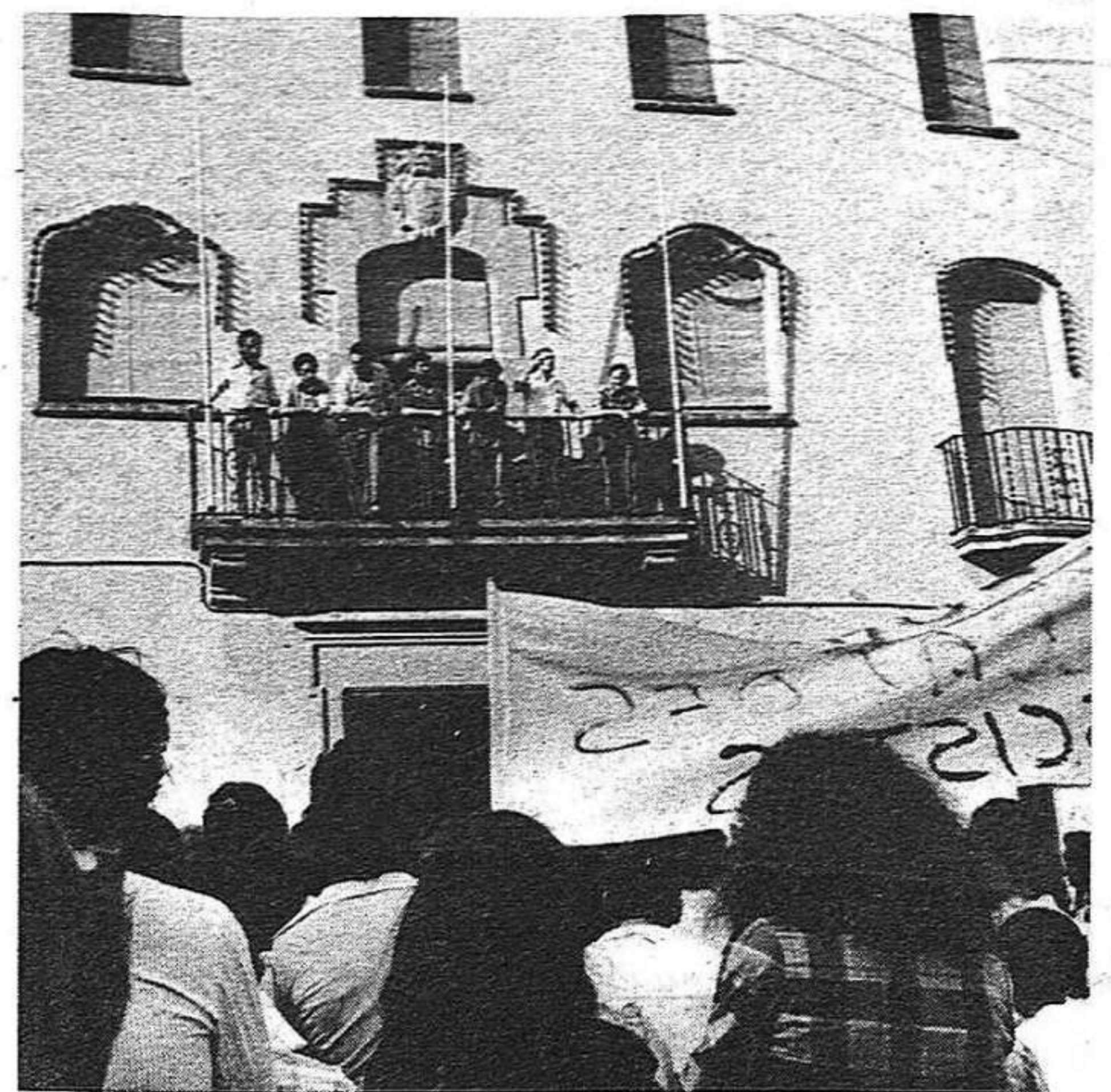
La carrera cap als ajuntaments ha començat. Els partits examinen les seves possibilitats i els veïns dels pobles i ciutats de Catalunya continuen reclamant solucions als seus problemes.