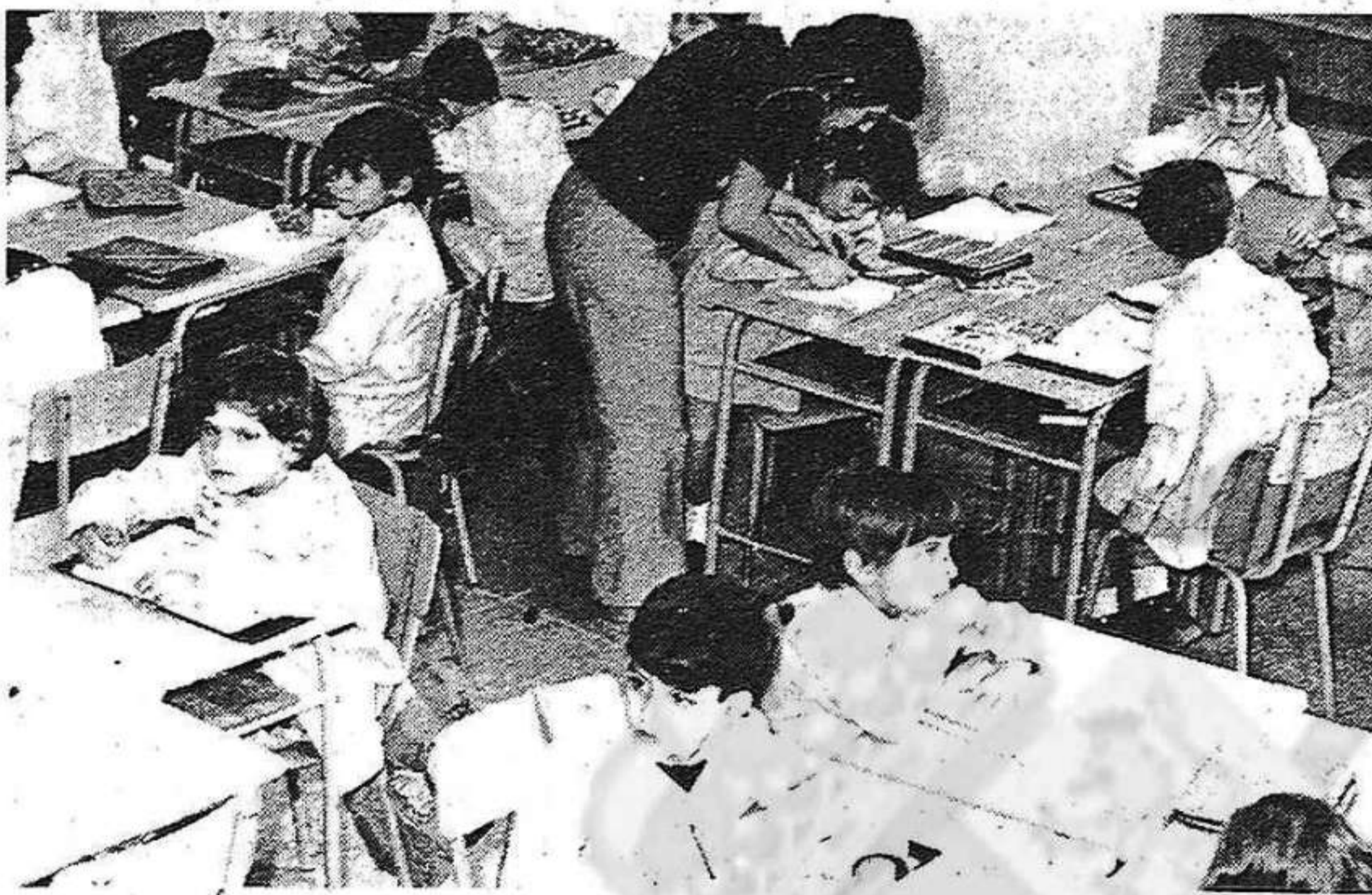
Les "escoles catalanes", la nineta dels ulls de la Conselleria de la Generalitat (Fotos d'arxiu)

teressos i les necessitat de tot el poble català, el desencís —que ja hi és— pot donar pas al menfotisme o a la reacció. Un nacionalisme no-integrador, tancat, possibilista, és un nacionalisme ben allunyat d'aquell pel qual hem estat lluitant: tots aquests anys els catalans ("d'origen i d'adopció"); i és ben clar que fou el nostre nacionalisme que va guanyar les eleccions del 15 de juny. És en nom d'aquest nacionalisme, doncs, que la Generalitat ha de parlar.