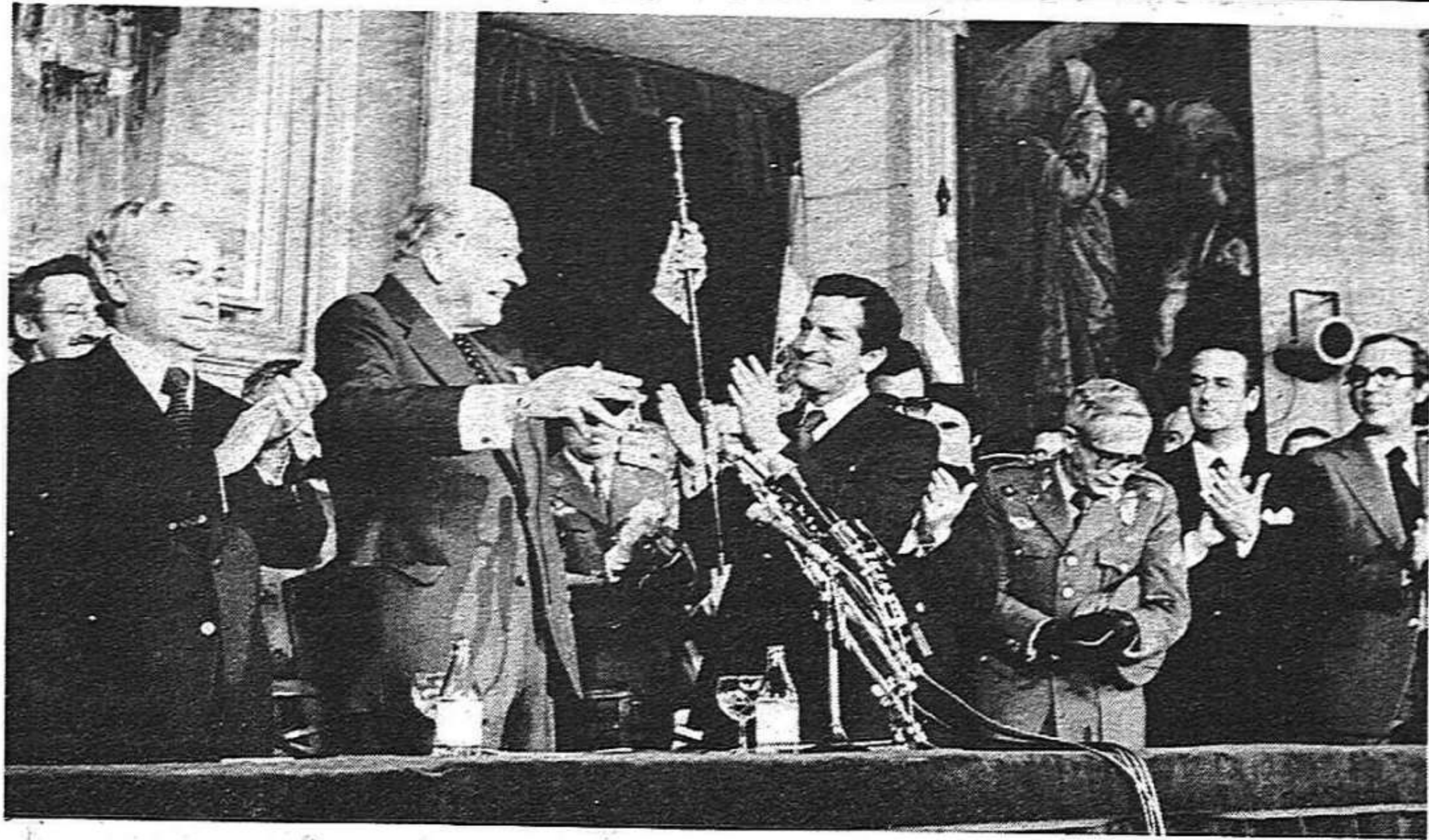
Ja ha passat de bon tros, l'hora dels aplaudiments i les cerimònies. Ara cal fer tot seguit el traspàs de competències i serveis