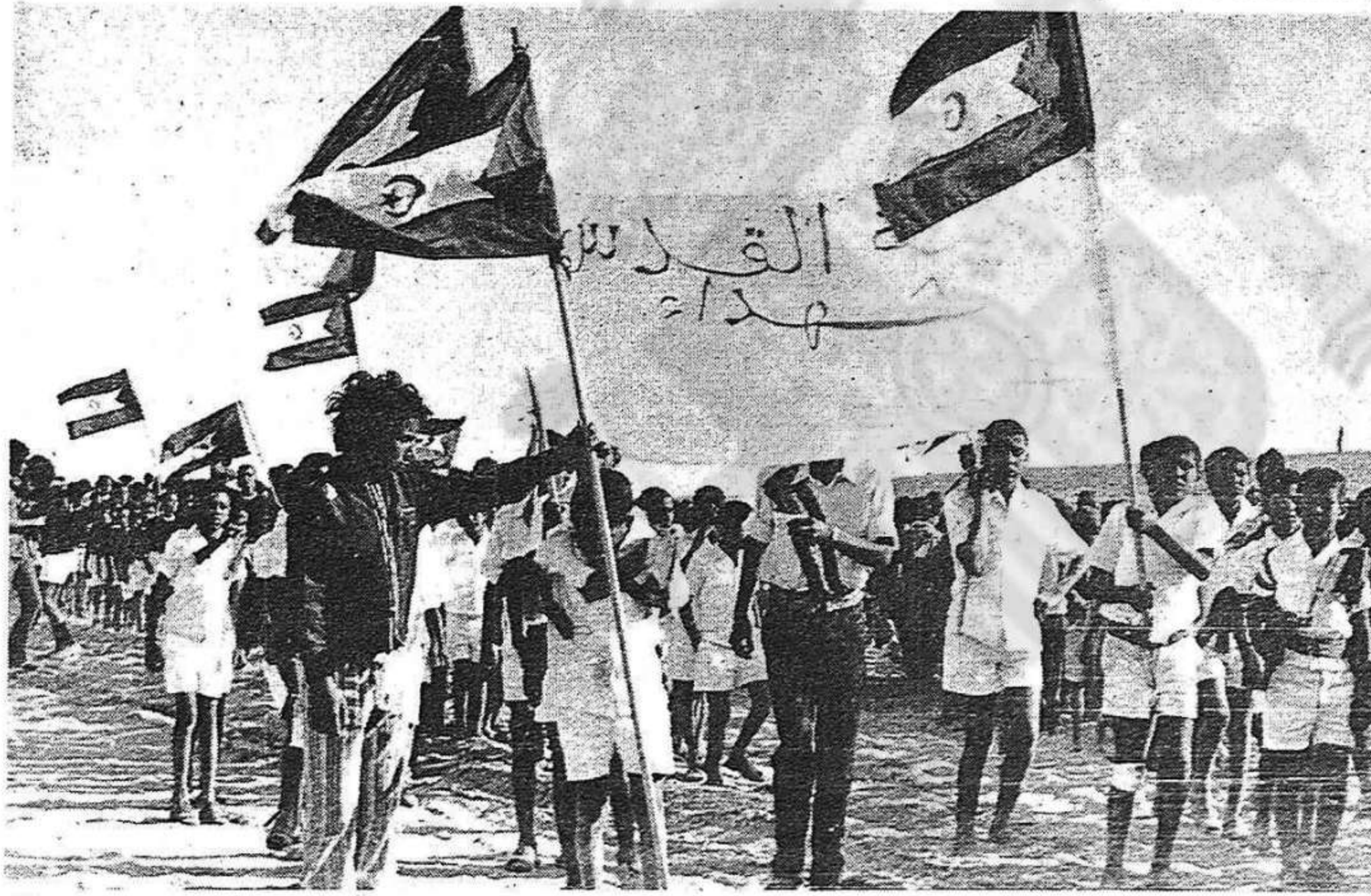
"Davant l'alternativa d'escollir entre el Polisario i Cubillo l'elecció no ha tingut problemes: Cubillo ha estat sacrificat en benefici del Polisario"