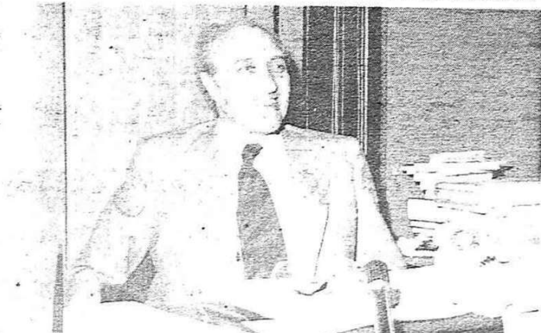
“És necessari que s'arribi a obtenir les qüestions d'ordre públic i de justícia”

—Crec que és exacte. De tota manera, això comprèn un espectre molt ampli d'ordenació administrativa del país. Hi ha un altre aspecte molt important, que es pot juxtaposar a aquest, que és l'ordenació territorial de Catalunya. Partint del que va ser la divisió territorial de la Generalitat del trenta-dos, s'han de recollir els nous canvis demogràfics, els nous canvis que han suposat les noves vies de comunicació, i llavors caldrà fer unes comarques o vegueries d'acord amb les actuals cir-