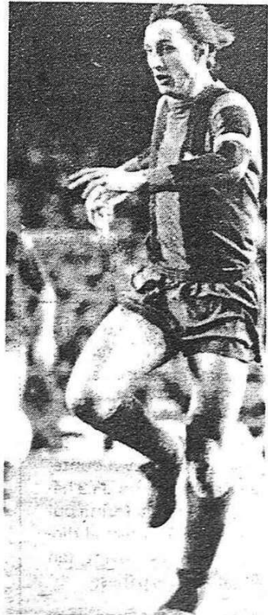
Johan Cruyff ja no és aquell jugador que ho resolía tot ell sol, però, moltes vegades, el seu esforç no troba la necessària correspondència en la qualitat tècnica dels seus companys.