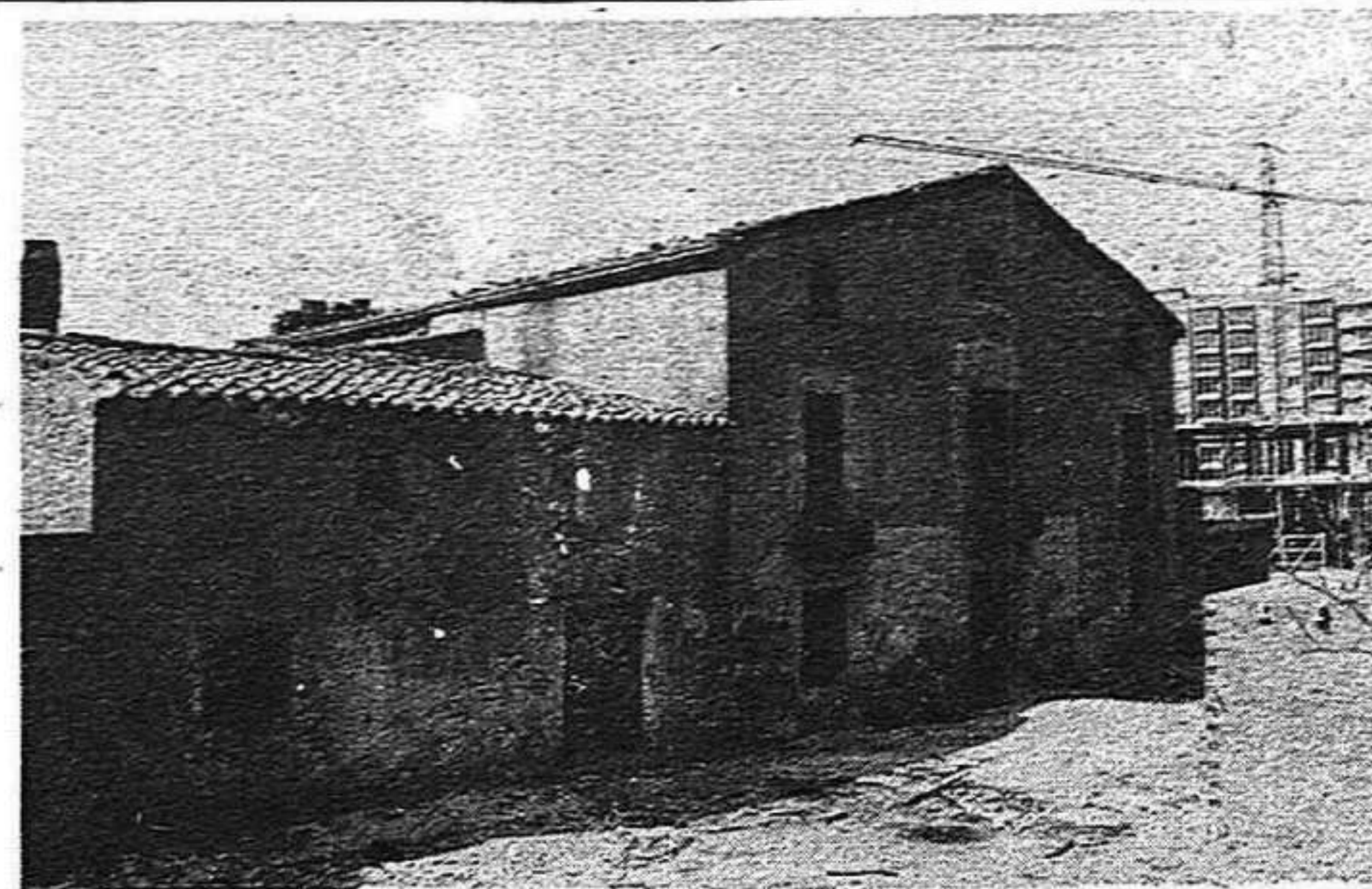
Can Borgunyó, enderrocat el març de 1976: especula que fa fort.

Un dels punts que observa el programa municipal de transició es concreta en l'adequació de la nomenclatura i símbols de la ciutat en aquesta nova etapa democràtica. En aquest sentit cal esmentar l'estudi que sota el títol de: "Vers unes normes per a una possible toponímia autòctona", ha quedat inclòs en l'informe-proposta dels partits polítics davant el possible canvi de la majoria de carrers de Sabadell, que recobririen d'aquesta manera els seus noms originaris.