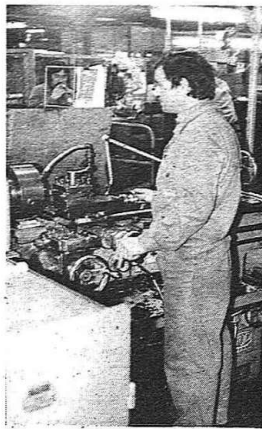
El metall de Barcelona: ara, el conveni

—El sindicalisme que hem de practicar s'ha d'assemblar molt més a l'italià que no al francès, per posar-te un exemple. Si nosaltres anem a un conveni general a nivell de tot un Estat o a nivell d'una nacionalitat, sempre surt més beneficiada la part menys organitzada del moviment