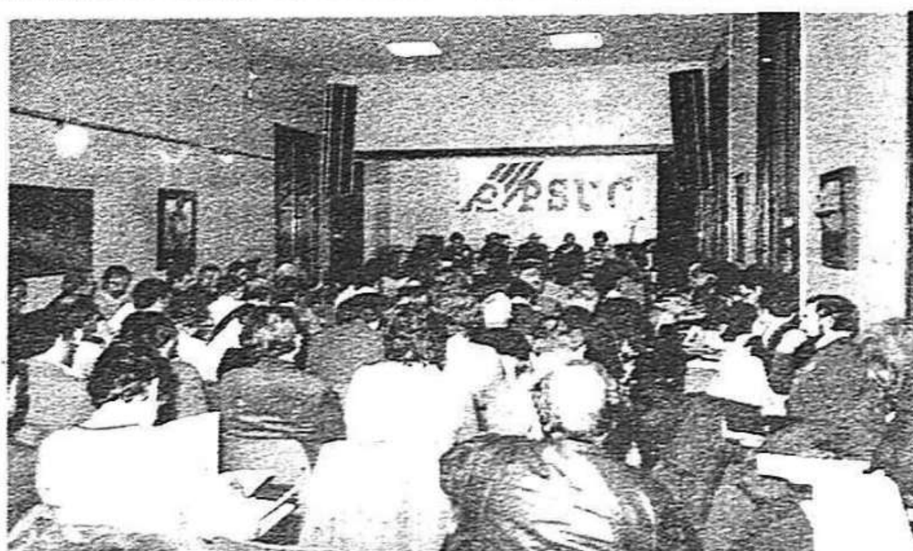
Dos moments de la reunió del Comitè Central del PSUC

El resultat de la discussió va permetre al ponent insistir, ja en el resum, en el fet que la decisió majoritària del Comitè Central era un acord per avançar, subjecte a futures precisions i revisions a mesura que es vagin clarificant les posicions. Ara bé, va dir, és un acord que demana una aplicació urgent i immediata, i en les tasques tan concretes com són les properes eleccions a representants als centres de treball, que encara que aquests sectors se celebrin un pèl més tard que a les fàbriques, hem de treballar perquè se celebrin de veritat, i ens hem de disposar a participar-hi, en la línia de CCOO, amb la consecució de llistes obertes unitàries que permetin l'elecció dels vertaders representants dels treballadors".