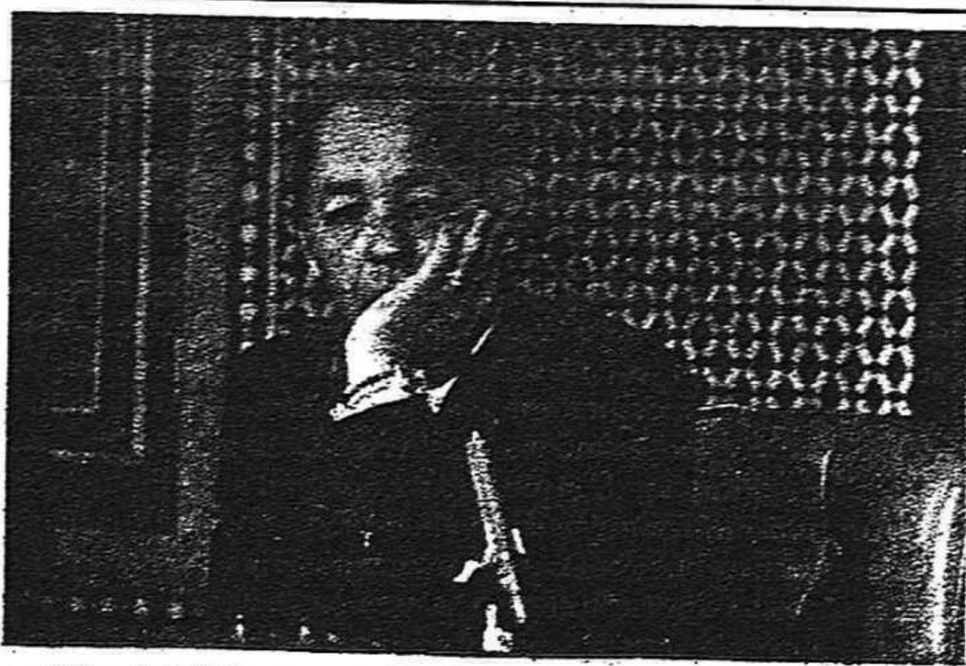
"El rei del Marroc no té gaire clara la seva situació actual"