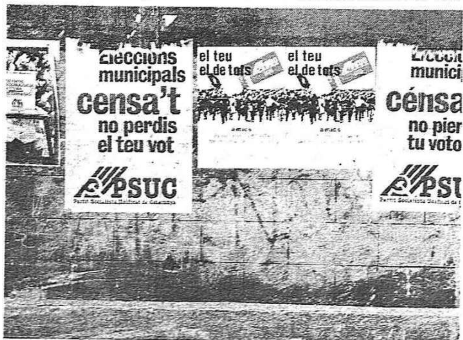
Censa't, perquè no es perdí cap vot. La campanya o la pre-campanya per a les eleccions municipals ha començat.

Sabadell: un pacte per sortir de la crisi (Pàgina 10)