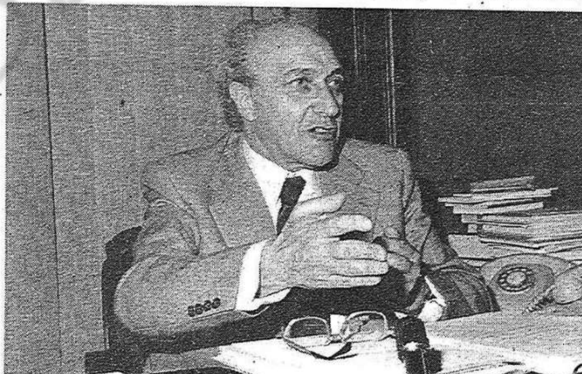
“Estic netament al servei del país”

—Aquesta Generalitat provisional no contempla, en el pacte que es va fer entre Tarradellas i Suárez, ni l'ordre públic ni la justícia. Aquests apartats, que no van arribar a entrar dintre del protocol, no-