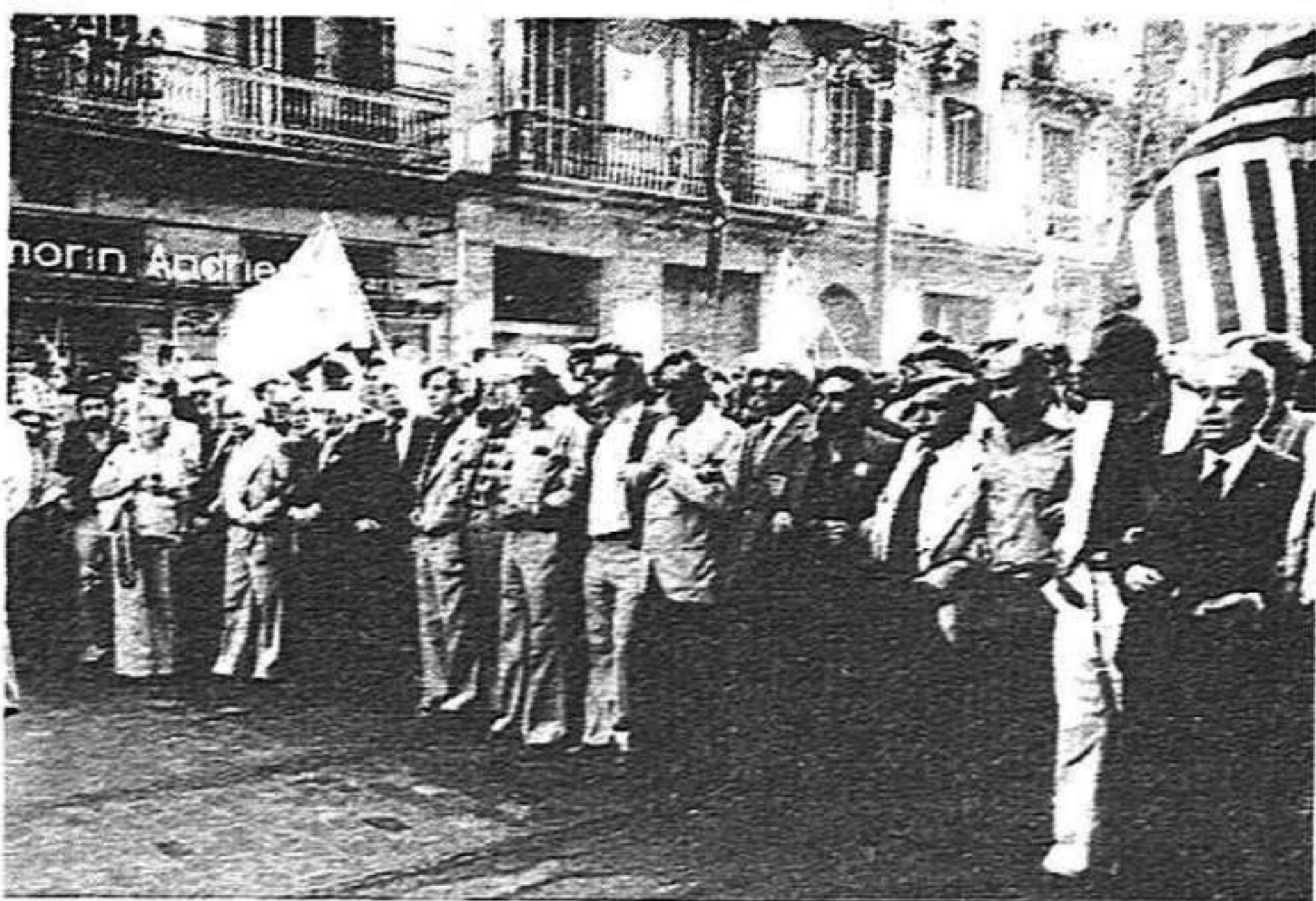
El poble de Catalunya no podrà assistir indiferent a les negociacions amb Madrid (Foto d'arxiu)

Per tot això, a les raons jurídiques hem d'afegir-hi les polítiques: el divers grau de maduresa política de les nacionalitats i regions junt amb la comuna aspiració a l'autogovern, la unitat de tots els demòcrates per millorar la Constitució i per eixemplar les autonomies, la unitat de totes les forces democràtiques catalanes per dur a terme una actuació conjunta en defensa dels drets del poble de Catalunya. Avui com avui, els objectius fonamentals són: una Constitució oberta i una Generalitat democràtica. No s'hi val començar a barallar-se per aspectes importants però secundaris (les llistes, per exemple).