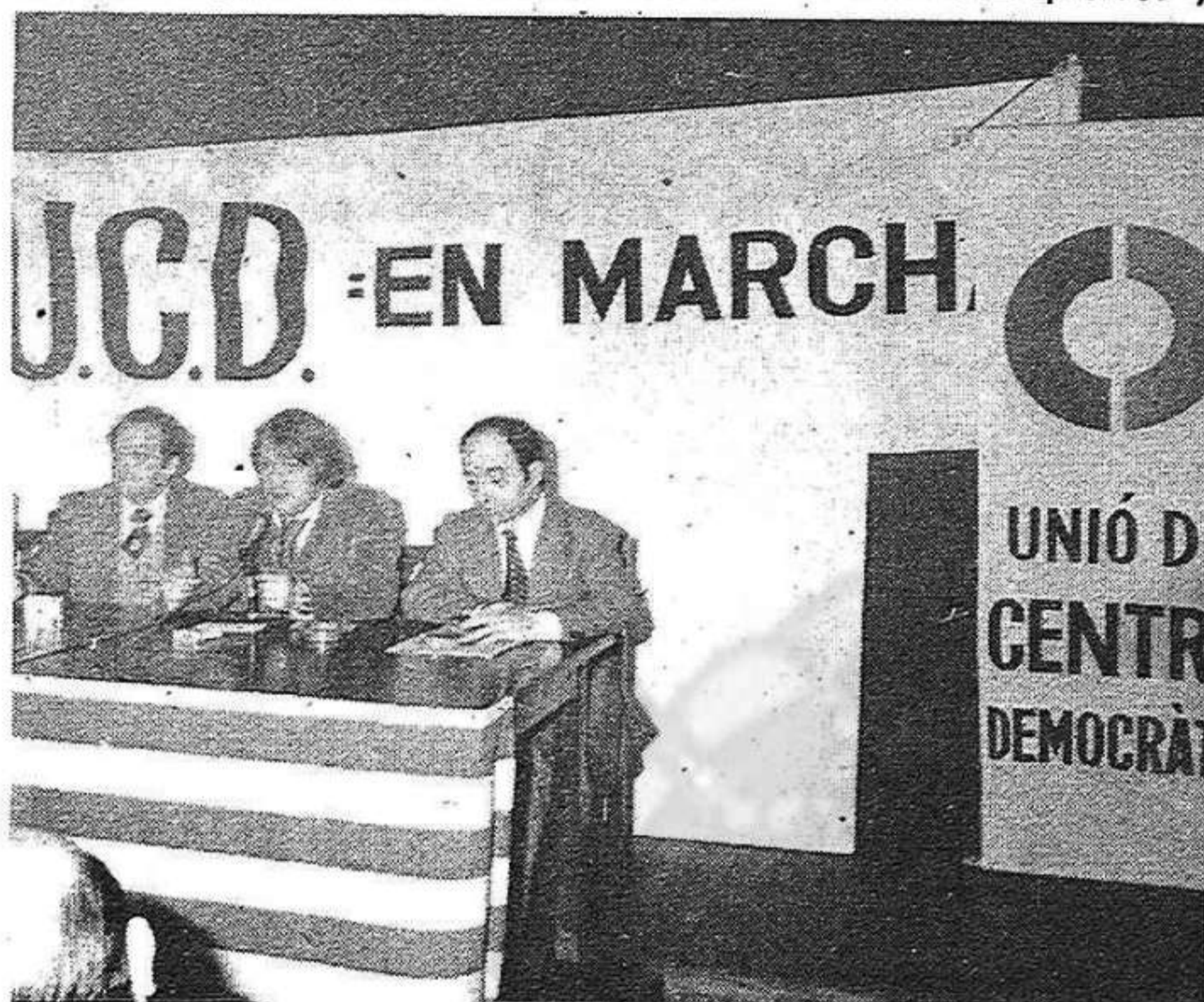
La UCD prepara la seva campanya electoral: "UCD en marcha". La foto d'E. Quintana ens mostra un moment de la recent presentació a Mataró del partit del govern.

"Als pobles o ciutats on es consideri possible, considerarem encertada la celebració d'un acte públic, en un local