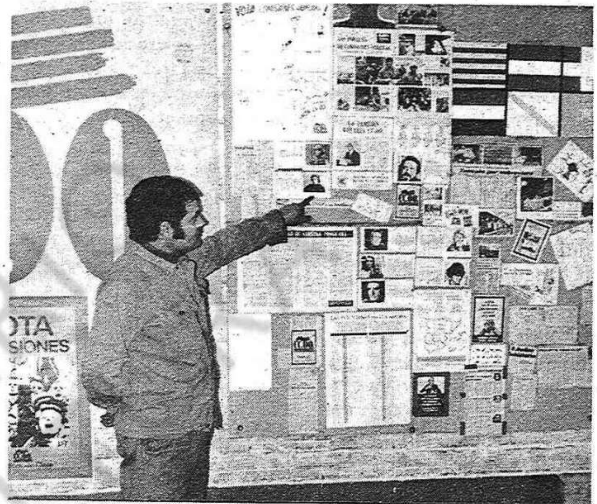
Mural de Comissions Obreres a l'ARMCO, del Vallès Oriental