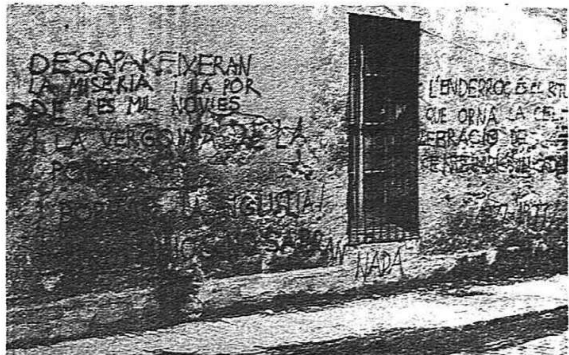
"Els campos": un centenari per a la mort