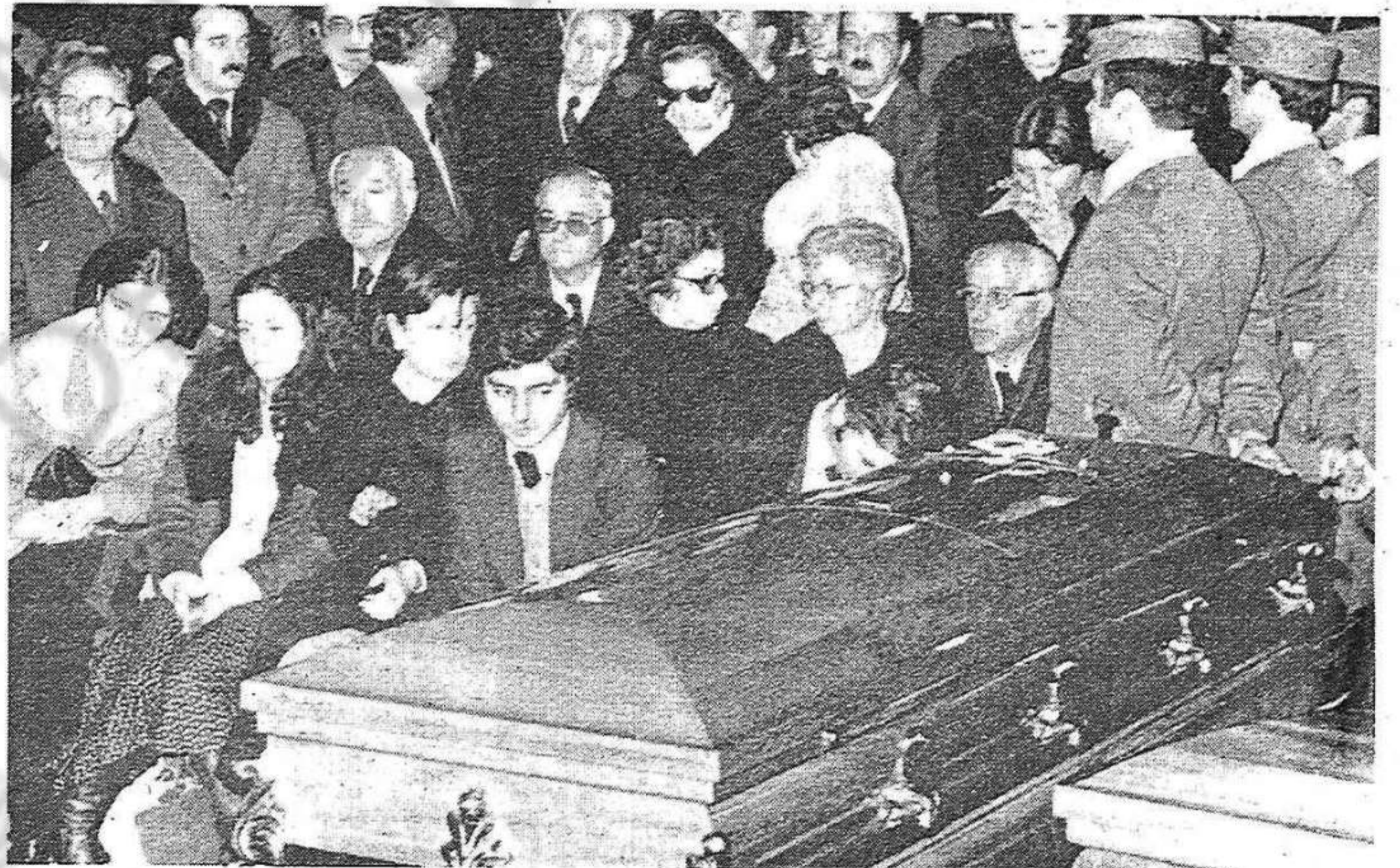
Temor, indignació, desestabilització: aquest és el veritable blanc de la violència

Aquesta condemna conjunta de CDC, PSC, PSOE i PSUC demana al poble de Catalunya serenitat i suport a les institucions democràtiques. Perquè, al capdavant, es tracta que els provocadors no surtin amb la seva. Que els qui troben la seva raó en la sang i en la destrucció topin amb la fermesa del poble i de les institucions democràtiques.