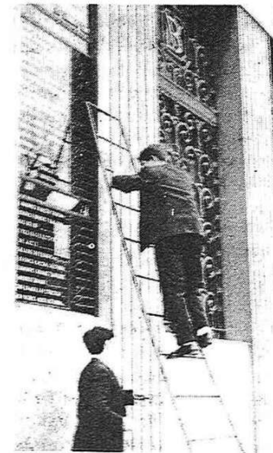
La reforma fiscal: que paguin més els qui més tenen

La consolidació de l'impost sobre el patrimoni en la forma d'impost definitiu gravarà la sola possessió de béns (vella aspiració de les classes populars).