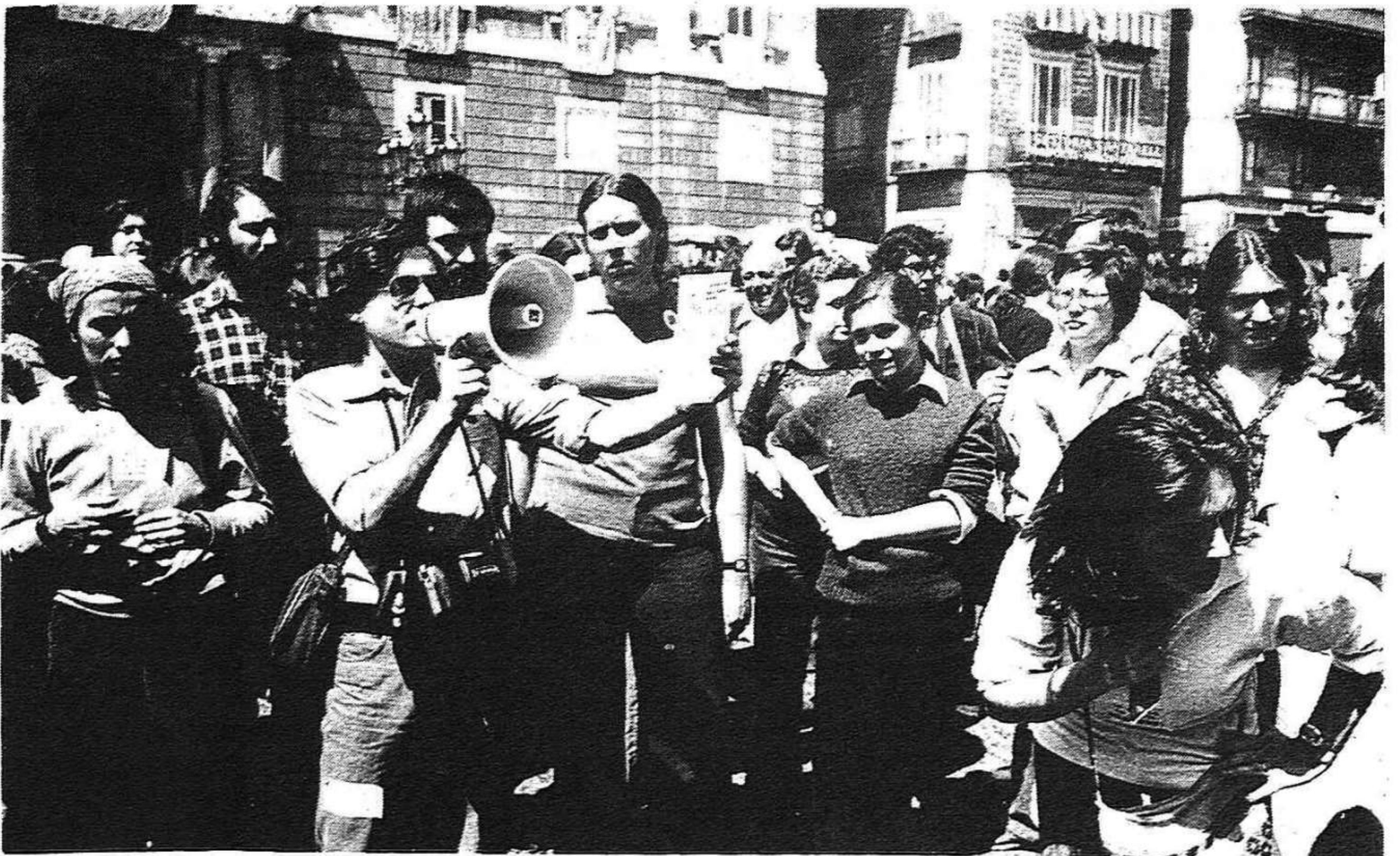
Continua la lluita dels professors de català. El Dia del Llibre es van manifestar a la plaça de Sant Jaume, a Barcelona, i van explicar directament als ciutadans el motiu de la seva protesta. (Foto Treball).