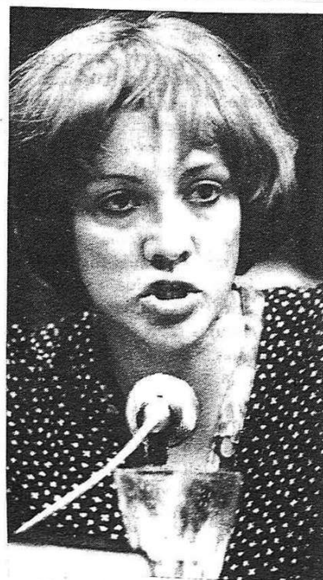
L'escriptora Montserrat Roig, candidata del PSUC.