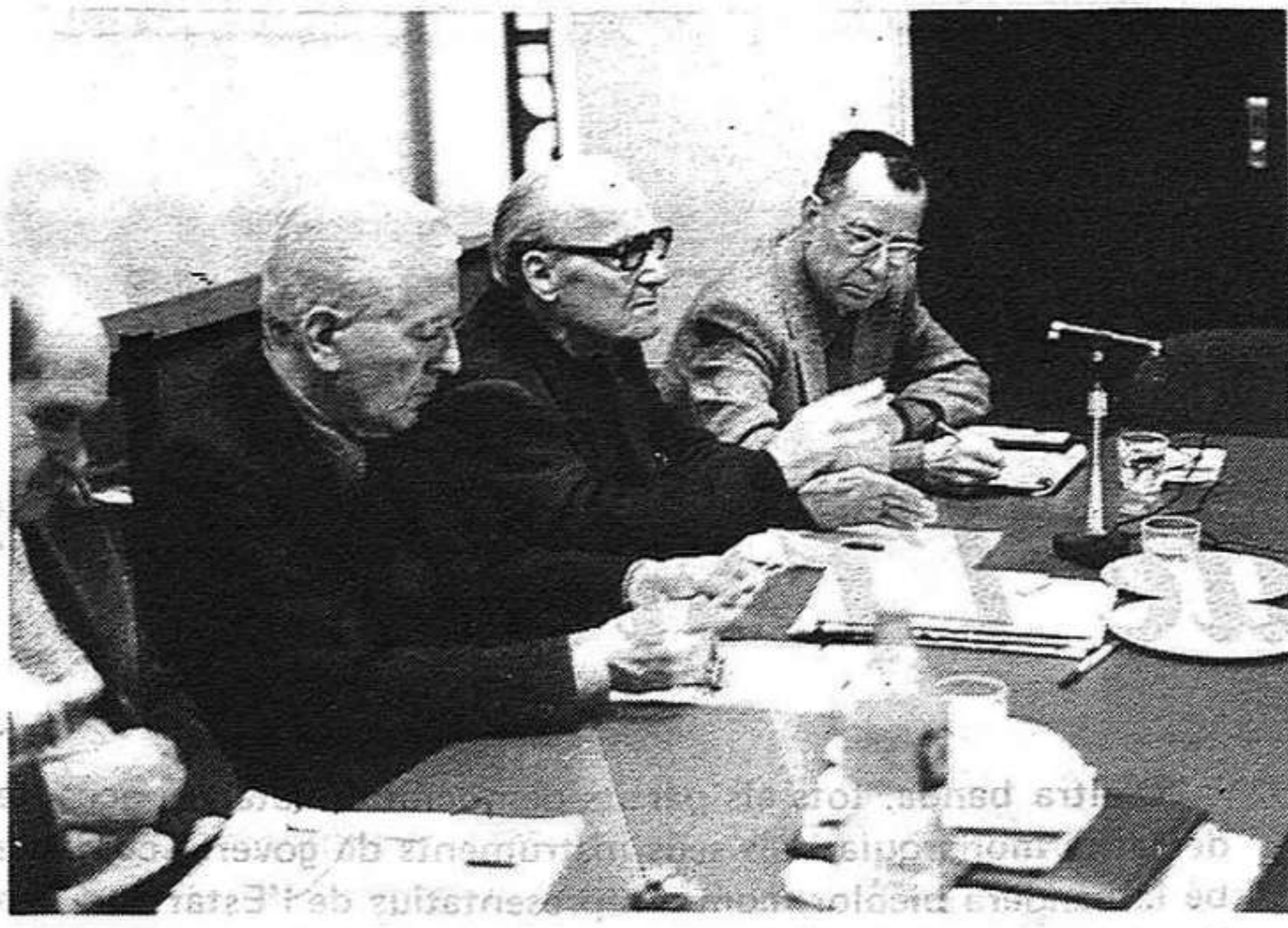
ve de la pàgina anterior

“Aquesta perspectiva dona una prioritat absoluta a l'esforç per fer dels actes del 27 d'abril i del 8 de maig jalons de la nostra campanya electoral i de la batalla per aconseguir, en les eleccions, un triomf clar de les forces democràtiques.”