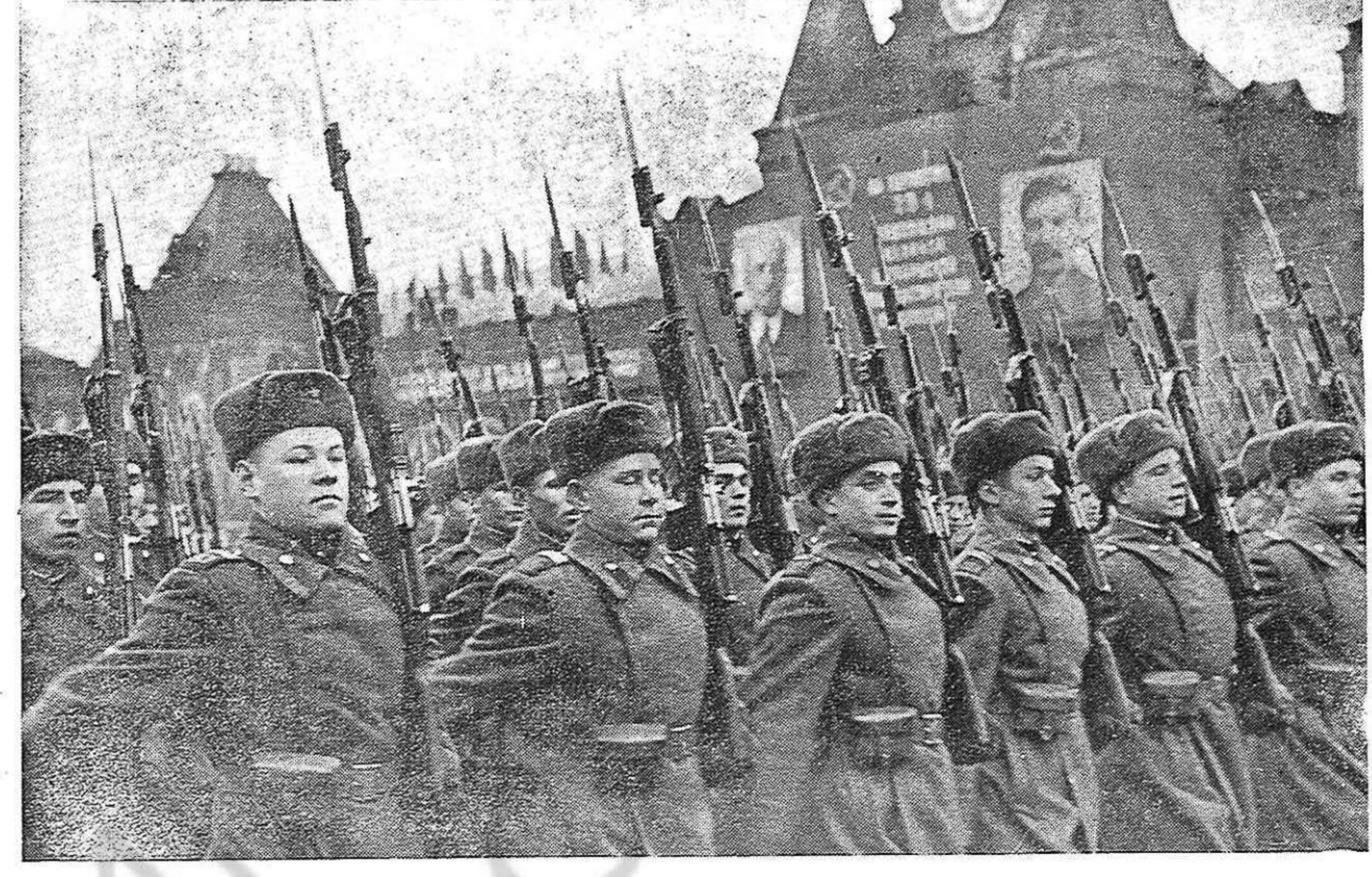
MOSCÚ. — Guarda-fronteres, sentinelles vigilants del territori soviètic, desfilen per la Plaça Roja.

« La nostra guerra per la llibertat de la Pàtria es fondeva amb la lluita dels pobles d'Europa i d'Amèrica per l'libertat i independència, per les llibertats democràtiques. Serà un front únic dels pobles que lluiten per la llibertat... » J. STALIN, en el seu discurs del 3 de juliol del 1941. « Un nuevo atrazo de la guerra continuará el maritimo de la España trabajadora, y a la larga de los años, se remediarán los dolores de ahora, harán crecer otra vez rios de sangre. » Nosaltres no som partidaris dels manys d'interès amb el despartament dels companys de l'interior i de lluitar contra Franco a través dels mitjans de comunicació.