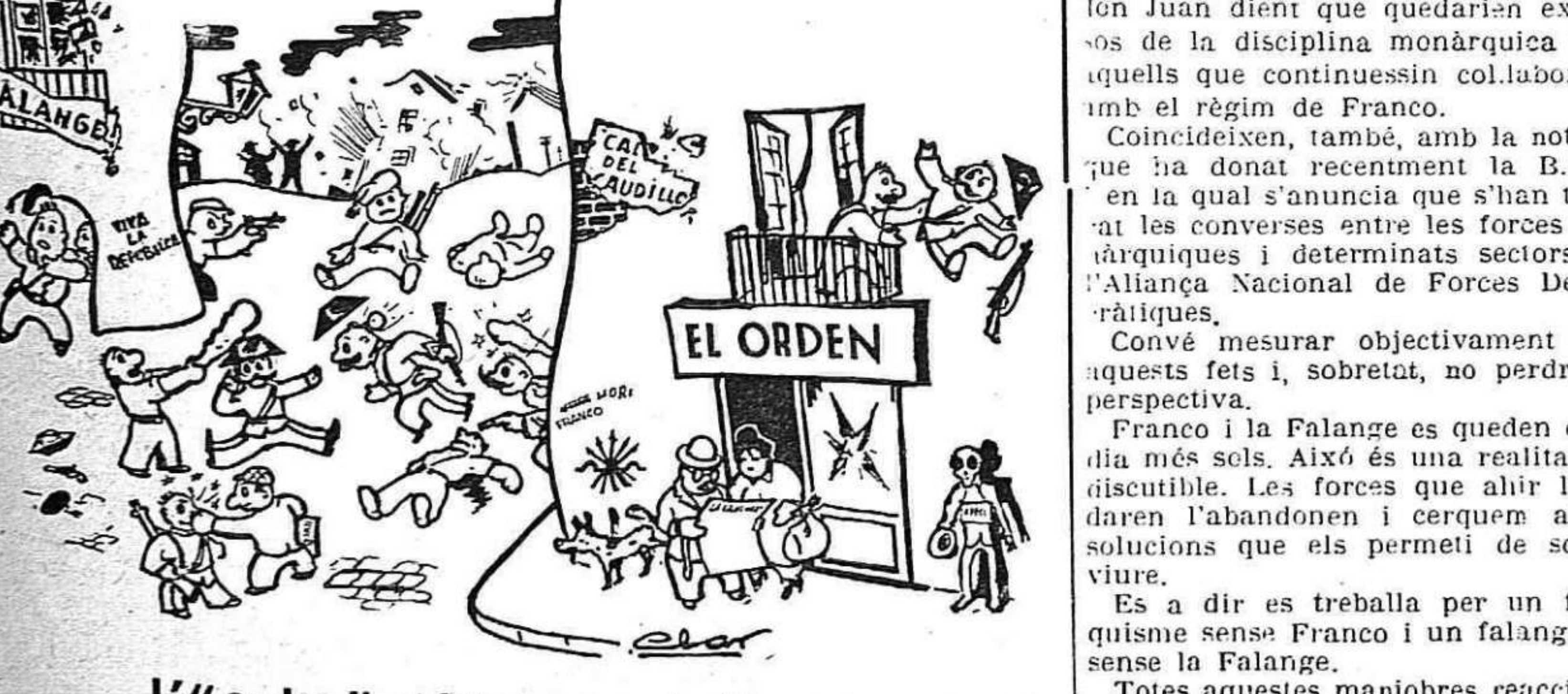
"L'ordre" a l'Espanya de Franco