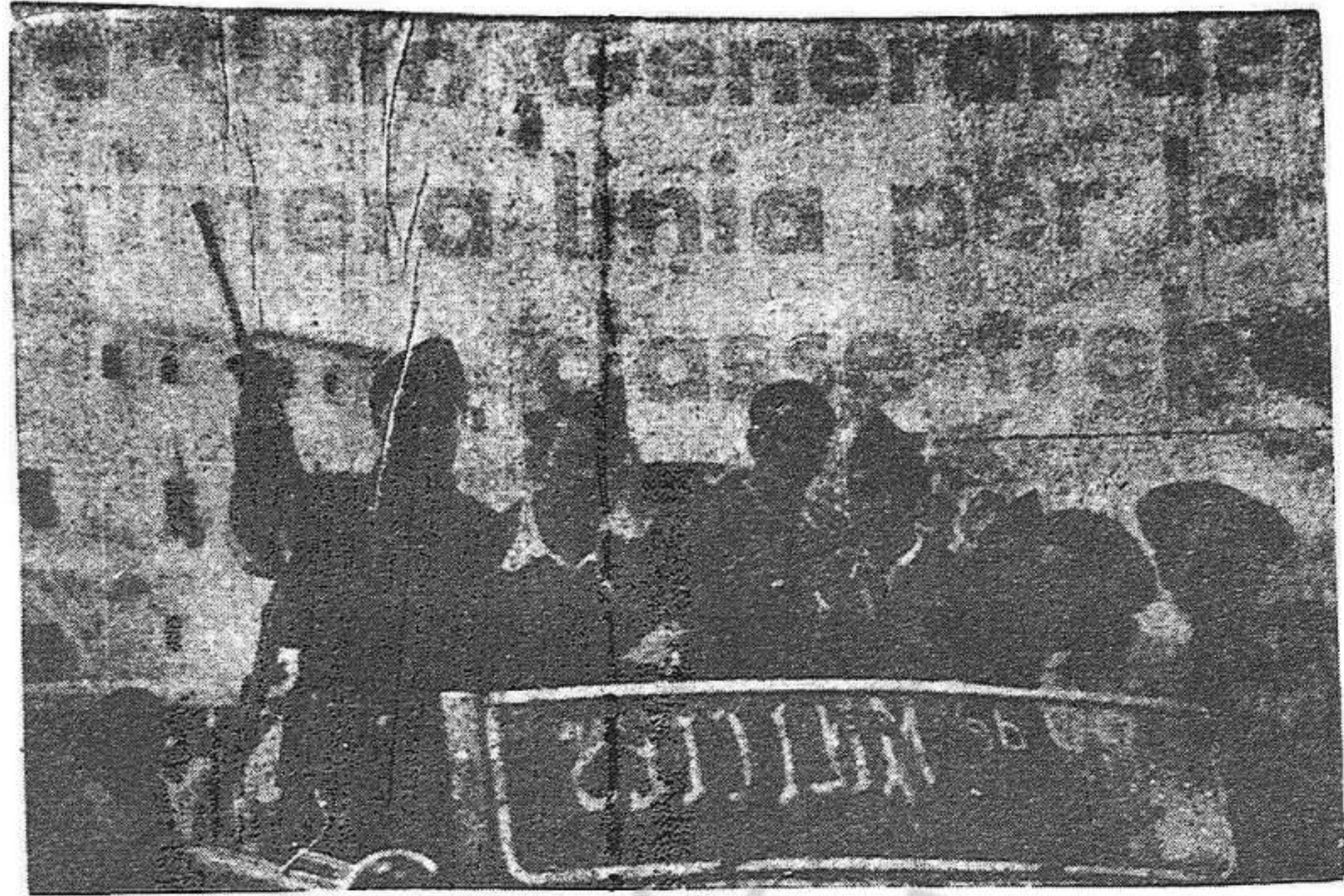
El comandant Pérez Farràs, l'heroi, ja, del 6 d'octubre, comanda una de les columnes que han d'alliberar Aragó de la grapa dels facinerosos del feixisme

Una de les consignes més importants dels marxistes catalans ha d'ésser aquesta: Unitat definitiva i inalterable entre nosaltres! Manteniment del Front Popular!