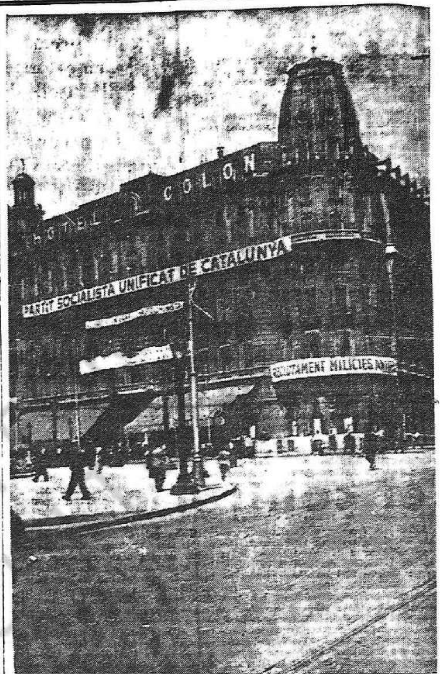
A l'«Hotel Colom», reducte que fou dels feixistes, a la plaça de Catalunya, s'instal·la el quarter general dels heroics milicians del Partit Socialista Unificat, tan aviat com en foren desallotjats els facciosos per la força impetuosa d'un poble en armes