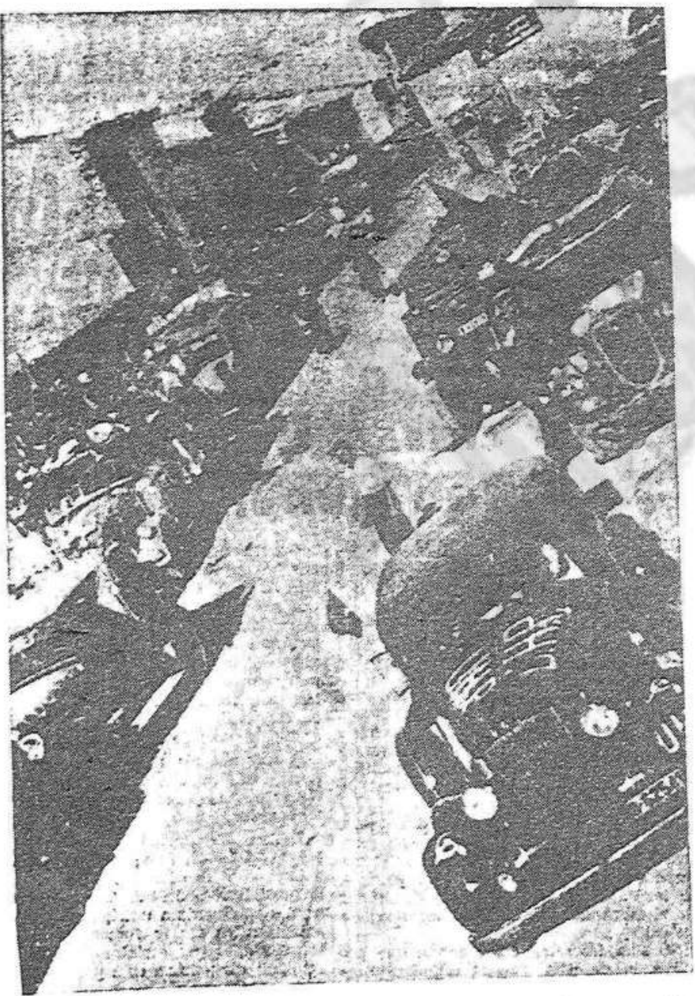
La columna es posa novament en marxa un cop els soldats del Front Popular han pres Bujaritz. La marxa sobre Saragossa segueix implacable fins que aconseguirà abatre els darrers reductes de la barbàrie feixista

Malraux porta una cordial salutació del Front Popular francès per a la classe obrera peninsular i per al Govern de la República