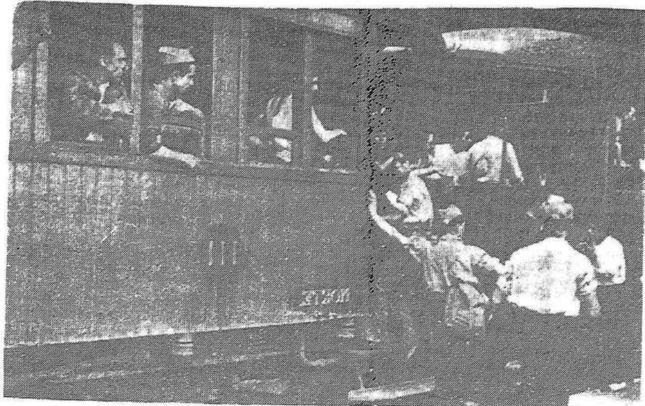
Milicians i més milicians cap a les terres d'Aragó. La riuada acabarà, i aviat, amb les hordes del feixisme