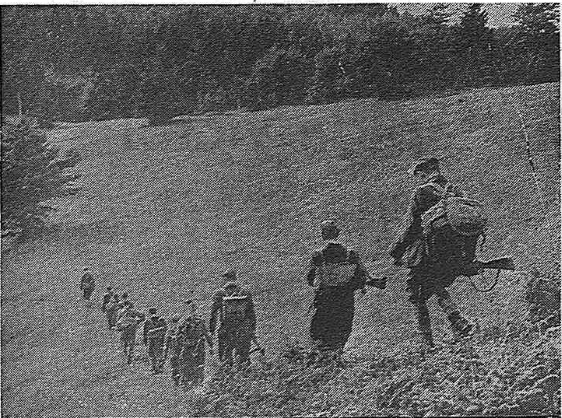
Unidad guerrillera del Ejército de Liberación del Mariscal Tito dirigiéndose a realizar una misión en uno de los sectores de Croacia.