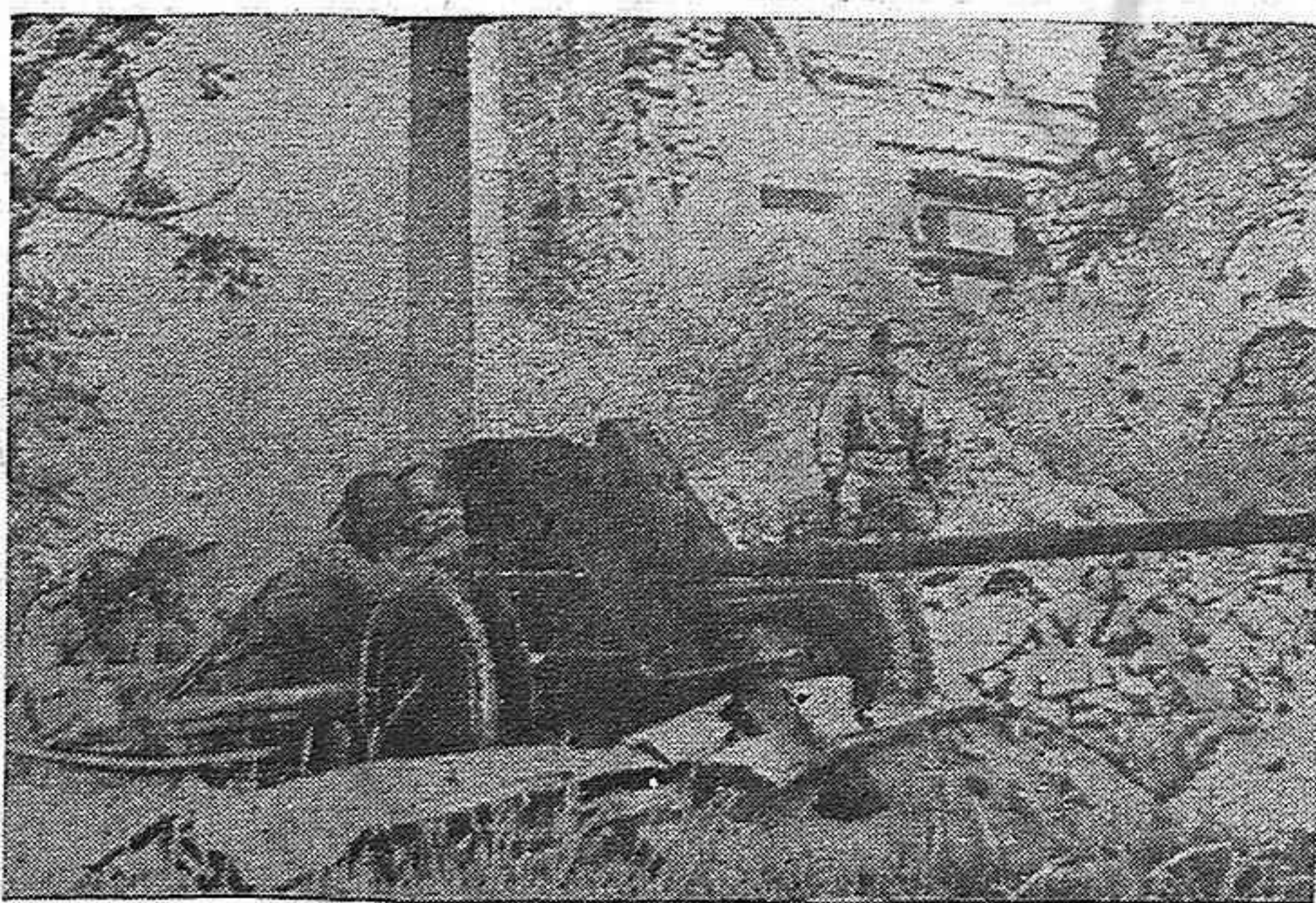
Espléndida pieza antitanque soviética, en acción en el frente de Hungría

Con las posiciones que ocupan actualmente los ejércitos de las Naciones Unidas se podrá lanzar en breve plazo la magna ofensiva desde el oriente y el occidente que aniquile por completo a la fiera nazi.