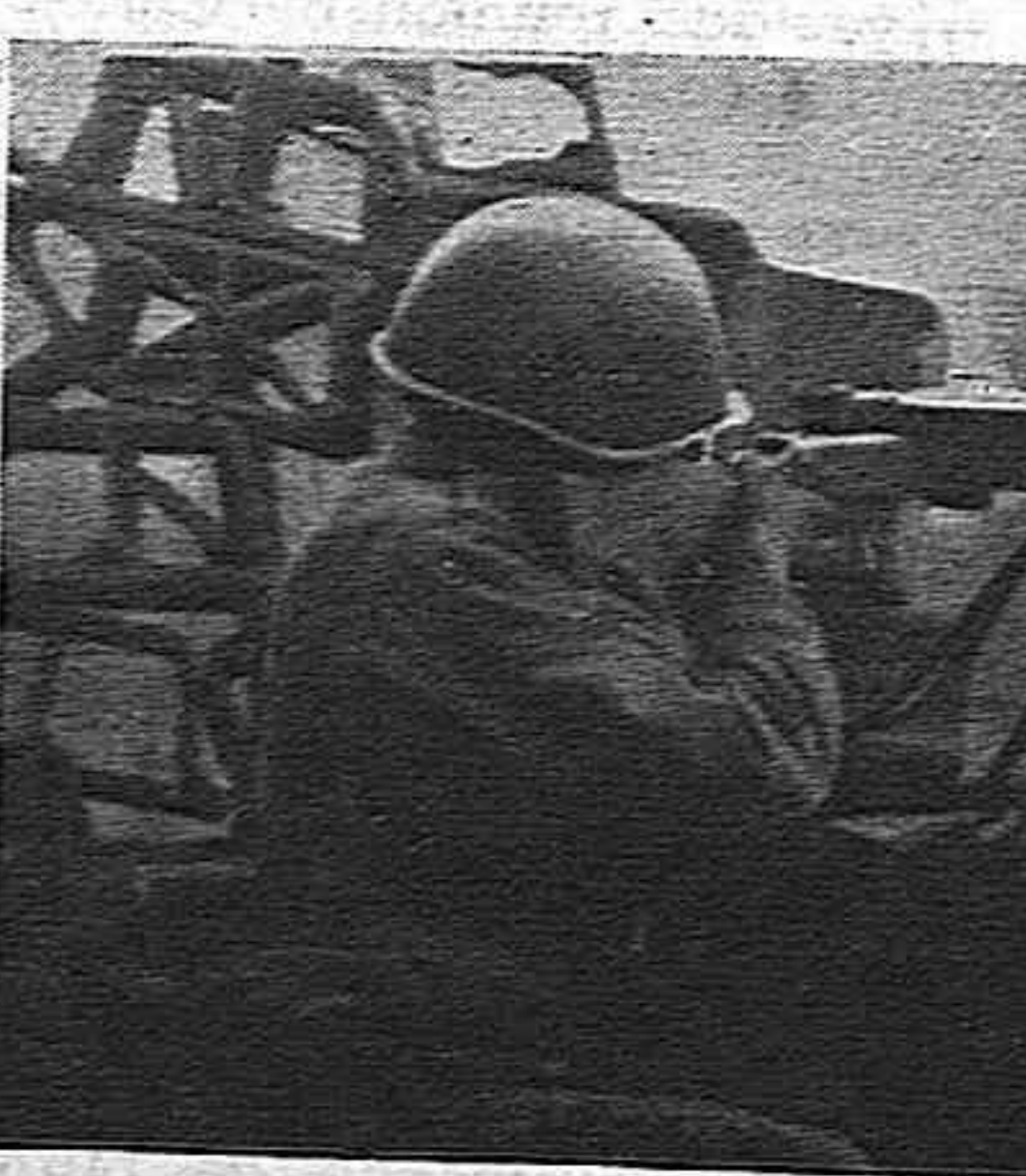
Des ametralladoristas del Ejército Polaco que combate junto al Ejército Rojo. Frente a sí tienen la ciudad de Varsovia.