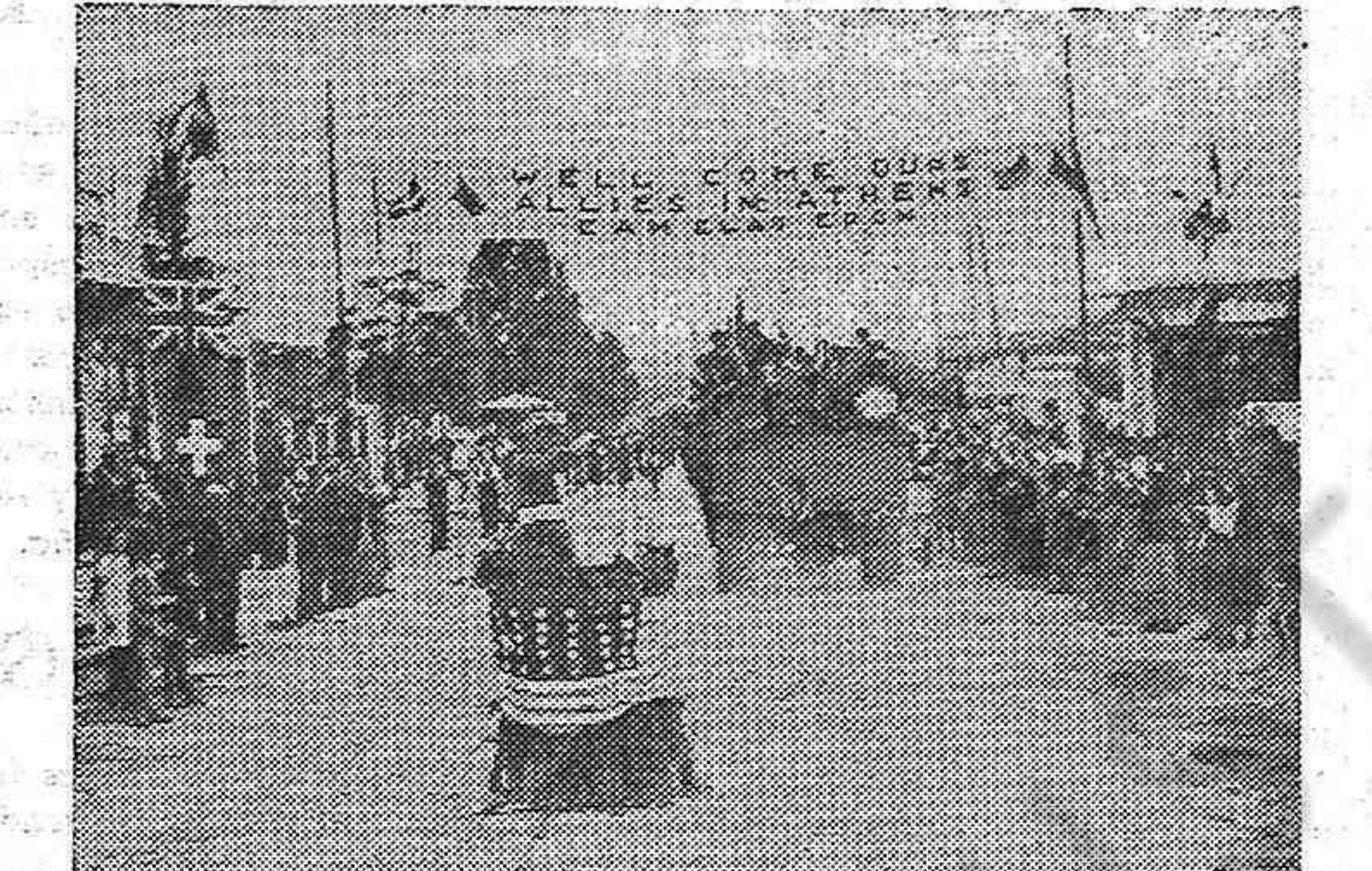
Cuando el ejército británico entra en Atenas, un gran cartel del ELAS (Ejército de Liberación de los patriotas griegos integrado por unos 150.000 combatientes) le saluda y da la bienvenida.

En la asamblea, con gran fuerza quedó demostrado una vez más el gran cariño y confianza que todo el Partido tiene en su Dirección hombres incorruptibles y firmes que ante los más duros embates de la diáspora y la infamia se mantienen unidos férreamente en torno a sus más altos dirigentes, esa mujer símbolo magnífico de heroísmo y capacidad revolucionaria, admiración de España y del mundo, la camarada Dolores Ibarruri.