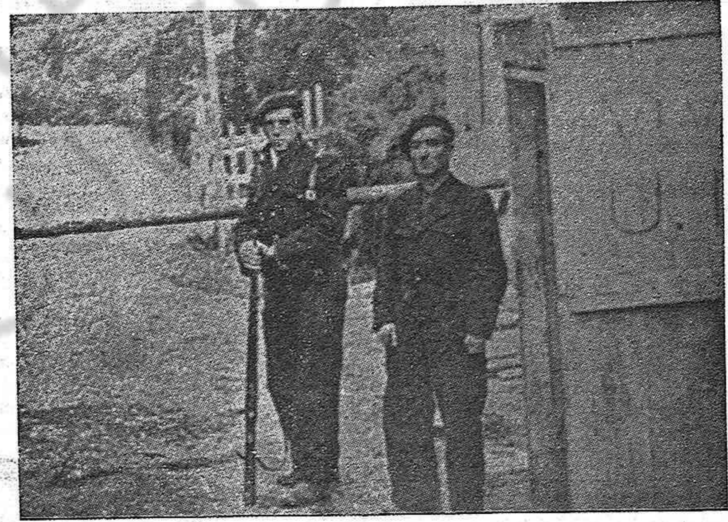
Hé aquí a dos de los heroicos combatientes españoles que lucharon en Francia fraternalmente unidos al pueblo francés en las grandes jornadas recientes. En la foto aparecen haciendo guardia en una carretera inmediata a la frontera franco-española. Obsérvese en la gorra su grito de combate español: "Viva la U. N. (Viva la Unión Nacional)."