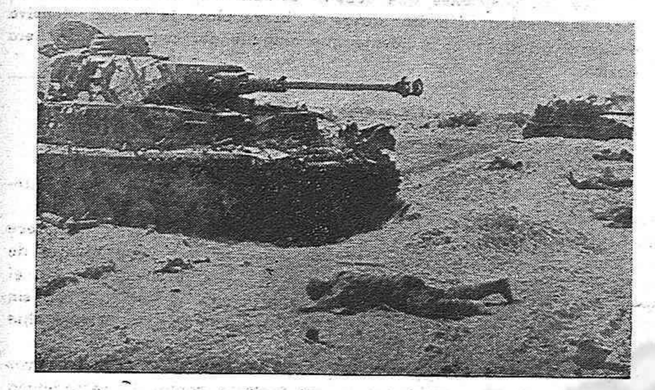
Tanques y soldados nazis destrozados por la artillería soviética en el frente de la Polonia septentrional.