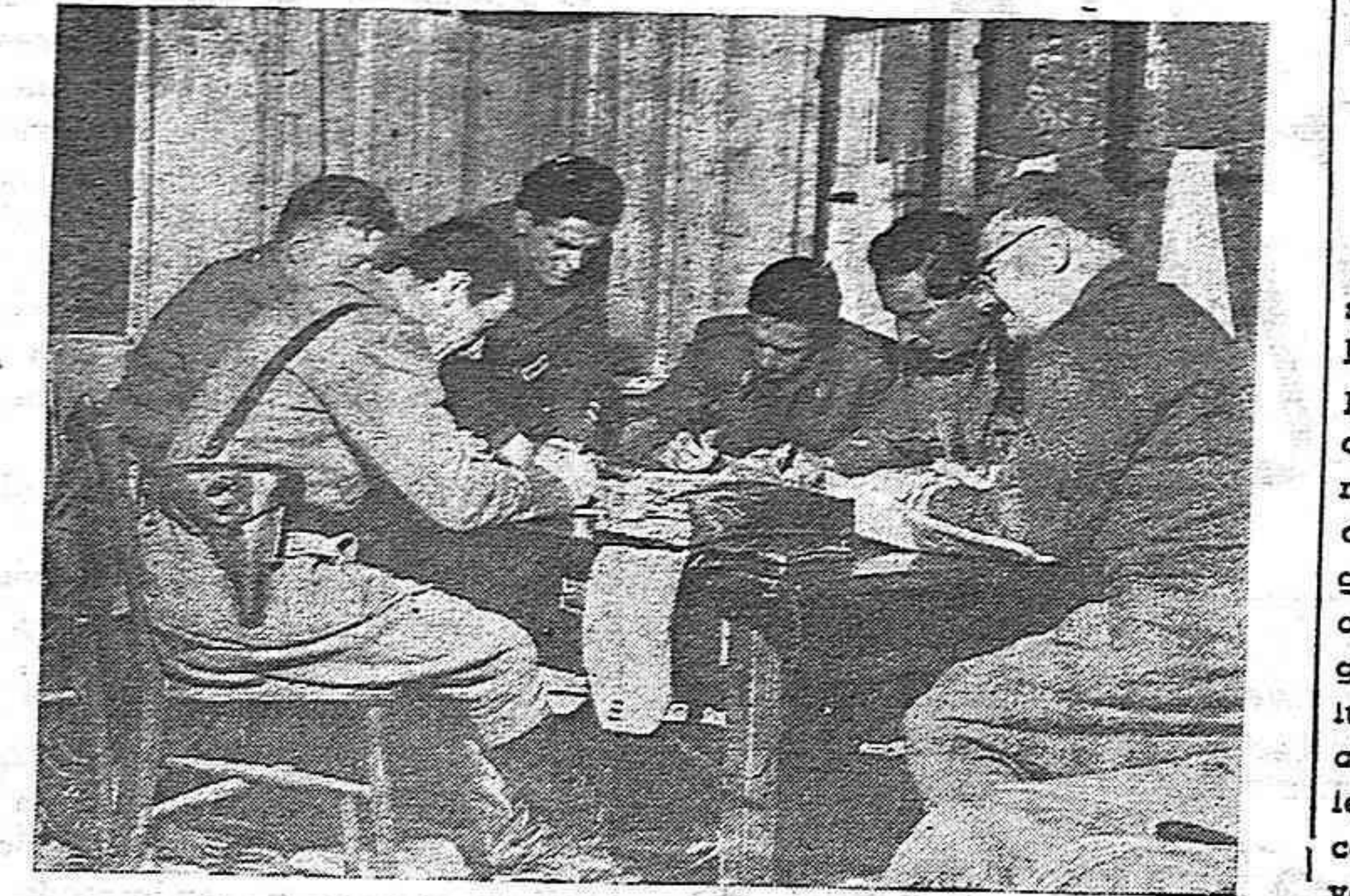
Estado Mayor de los Guerrilleros de Eslovenia que forman parte del gran Ejército de Liberación yugoeslavo.

ción española al pleno ejercicio de su soberanía bajo la bandera de un régimen republicano es sin duda de ningún género la más noble, la más elevada, la más republicana y patriótica de las obligaciones que los españoles tienen que cumplir y están cumpliendo en los instantes actuales.