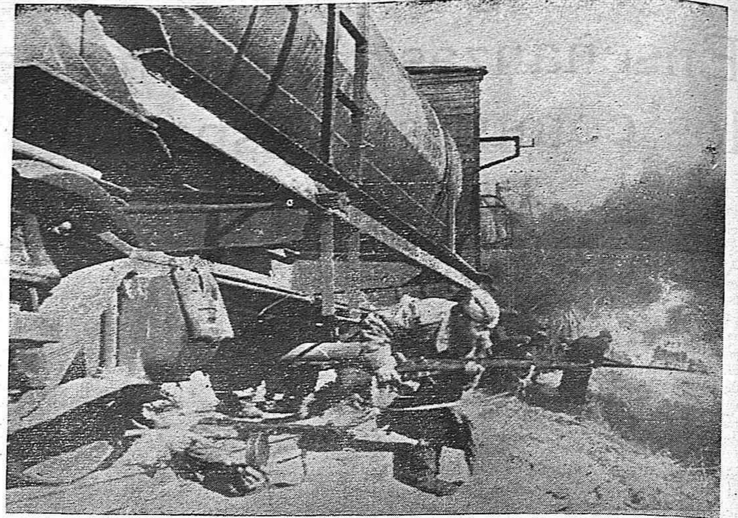
Soldados del Ejército Rojo irrumpen en una de las pocas estaciones ferroviarias que quedan en poder de los nazis en territorio de Letonia.

El pueblo español, luchando sin descanso, se ha ganado la simpatía y admiración de todos los pueblos.