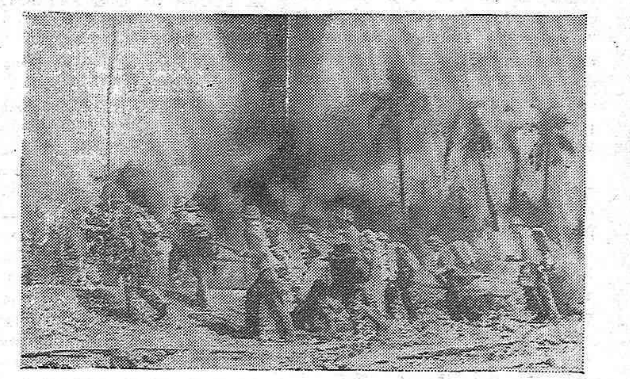
Las tropas norteamericanas al mando de Mac Arthur prosiguen su ofensiva en la isla de Leyte.

Una primera realización de esta unidad de las corrientes democráticas populares y progresistas, la hemos tenido hoy en la nueva "CONFEDERACION GENERAL ITALIANA DEL TRABAJO", constituida como organismo sindical unitario por un acuerdo entre el Partido Socialista, el Partido Comunista y los dirigentes del Partido Católico. El haber alcanzado esta unidad sindical es un gran progreso en el camino de la democratización y del adelanto político de Italia. Los comunistas nos comprometemos a defender esta conquista, a realizarla. Nos comprometemos a hacer de la UNIDAD SINDICAL la realidad de la vida política italiana por lo que se refiere al campo del trabajo, al de las luchas so-