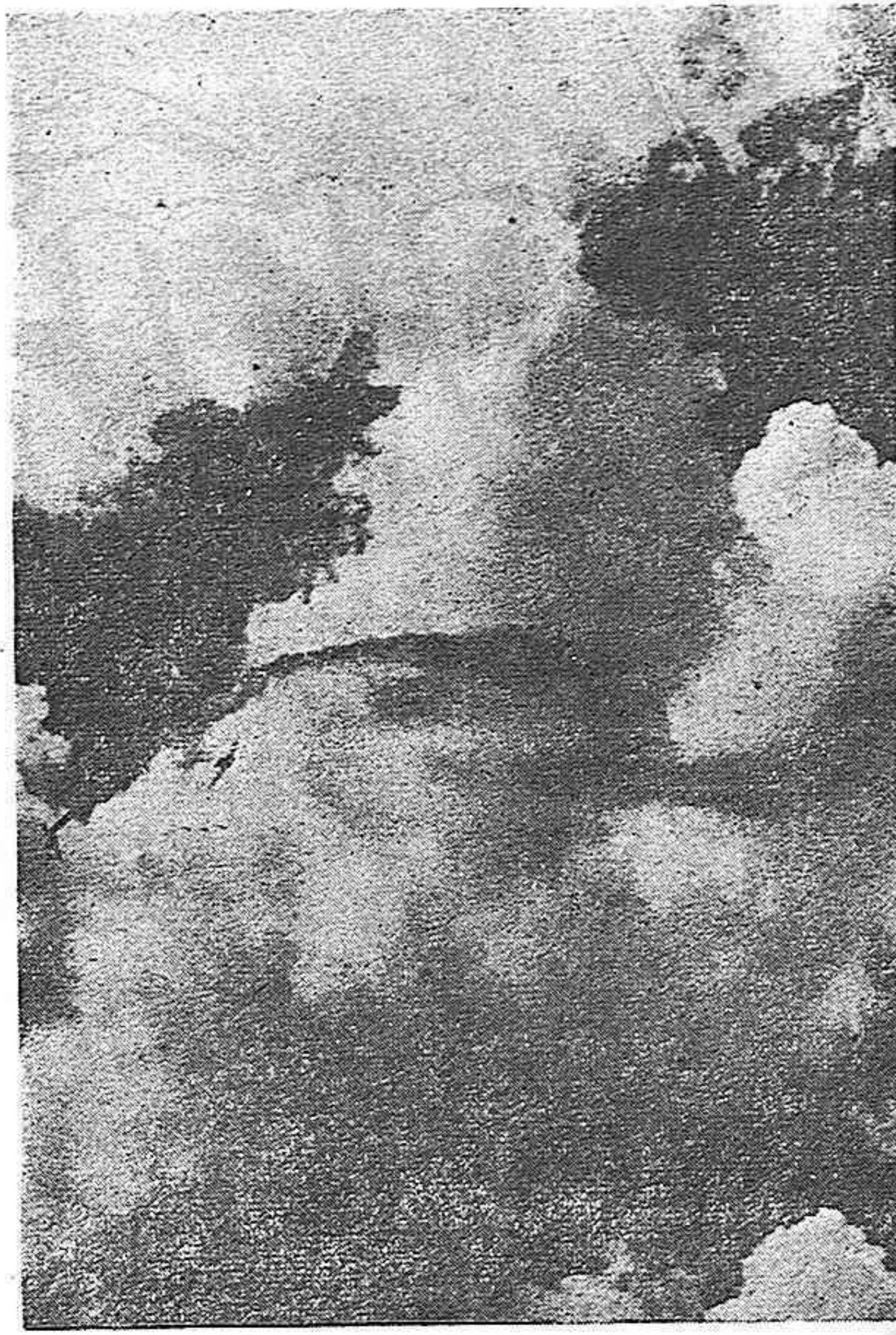
Duelo aéreo en el cielo de Europa

ba de recalar el mercante "Marite" con unas cuatro mil toneladas de nitratos chilenos embarcados en Montevideo, producto como es sabido esencial para la fabricación de explosivos y que el franquismo respalda en su totalidad hacia Alemania. Por otra parte, un gran número de petroleros franquistas han partido cargados de Venezuela hacia España. En suma, el lamentable acuerdo convenido por Estados Unidos e Inglaterra con Franco esta sirviendo para estimular a éste en su papel de agente comprador de Hitler, en América, como lo demuestra el gran torrente de mercancías que en estos momentos cruzan el Atlántico y que en insignificante cantidad serán consumidas en España, sirviendo en su mayor para alimentar al ejército alemán y prolongar la resistencia nazi.