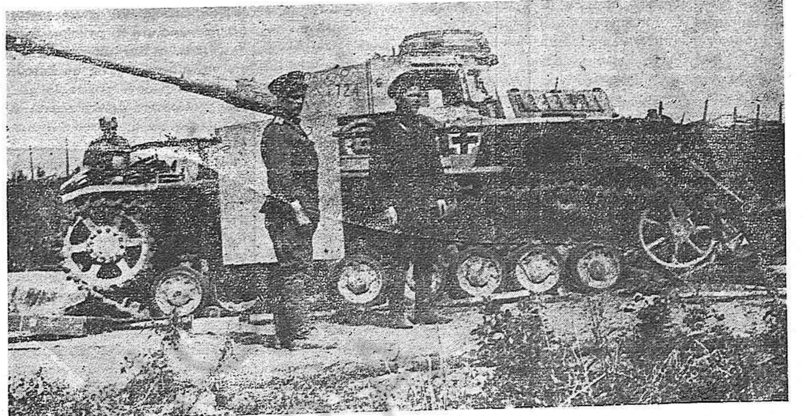
Tanque nazi capturado en el frente oriental.

Símbolo de lucha hace cinco años; luz de esperanza en los años de terror; símbolo de lucha otra vez, pero ahora más fuerte, más profundo, más decidido, para dar al pueblo español libertad e independencia.