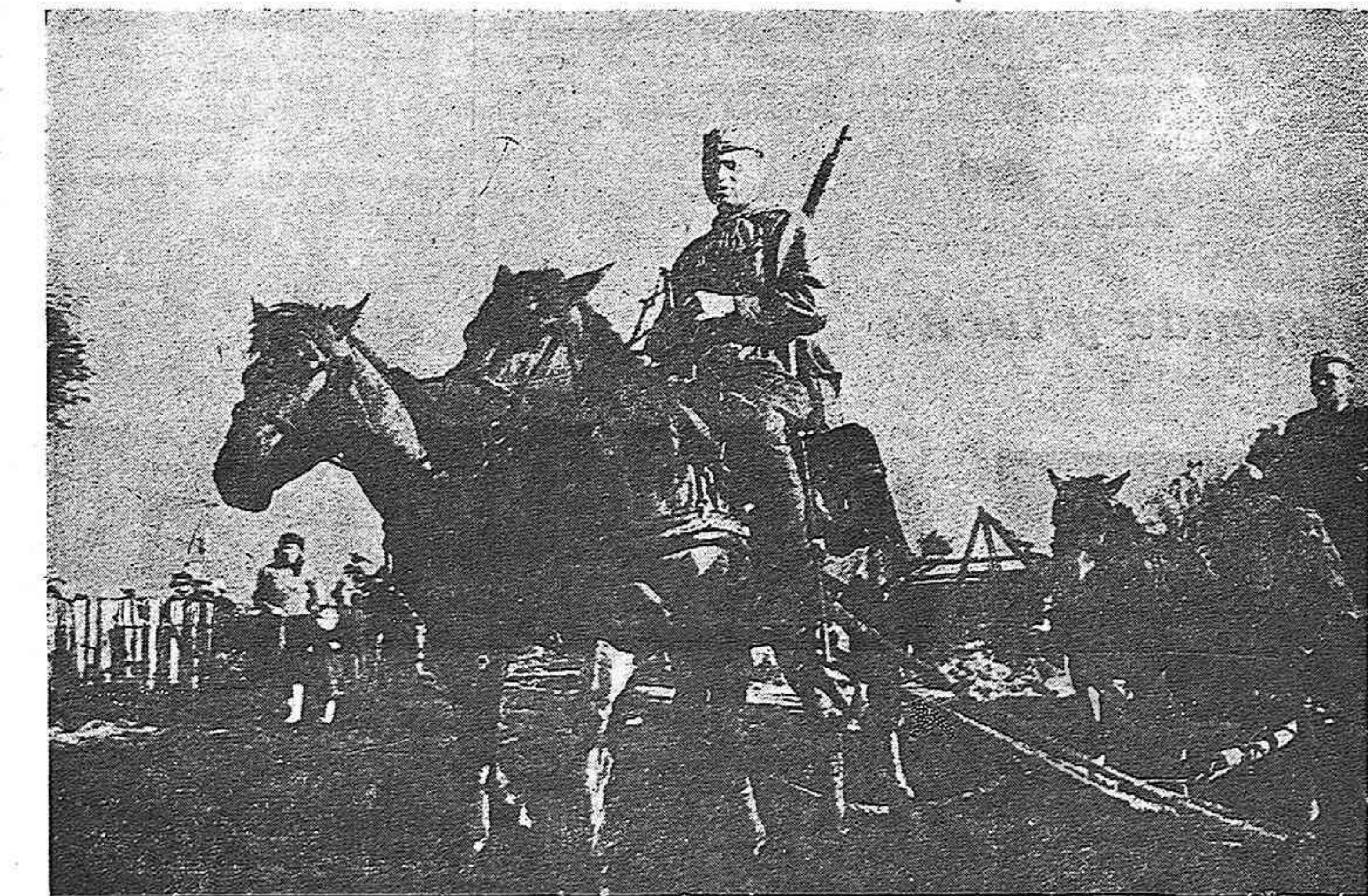
Arrastre de material en el frente soviético.

No habiendo asistido a la Asamblea varias organizaciones, que indudablemente apoyan las resoluciones tomadas, se están recabando las adhesiones.