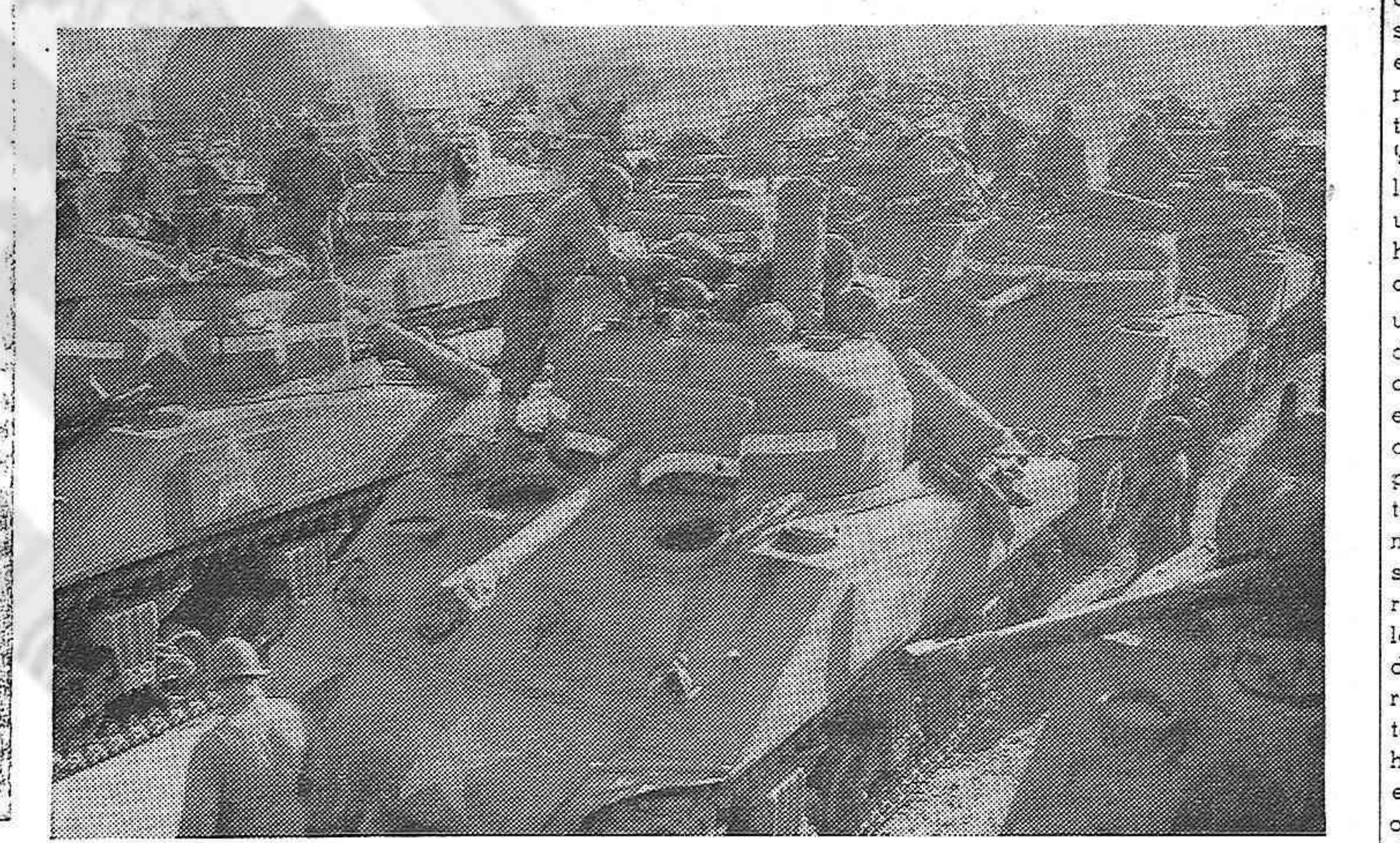
Tanques para la invasión.

—Todo esto que le digo a Ud. demuestra una verdad que todo patriota español siente y es que España se halla activamente participando en la lucha de las Naciones Unidas no solo de una manera plañtónica y con una deshonra sentimental por la causa de las democracias sino con una participación activa, constante, unificada. Un ejército que cada día más potente lucha ya en el interior de España: el Ejército guerrillero, que completa las acciones de combate que el pueblo realiza en los talleres, en las fábricas, en las minas, en las oficinas y en las innumerables colas.