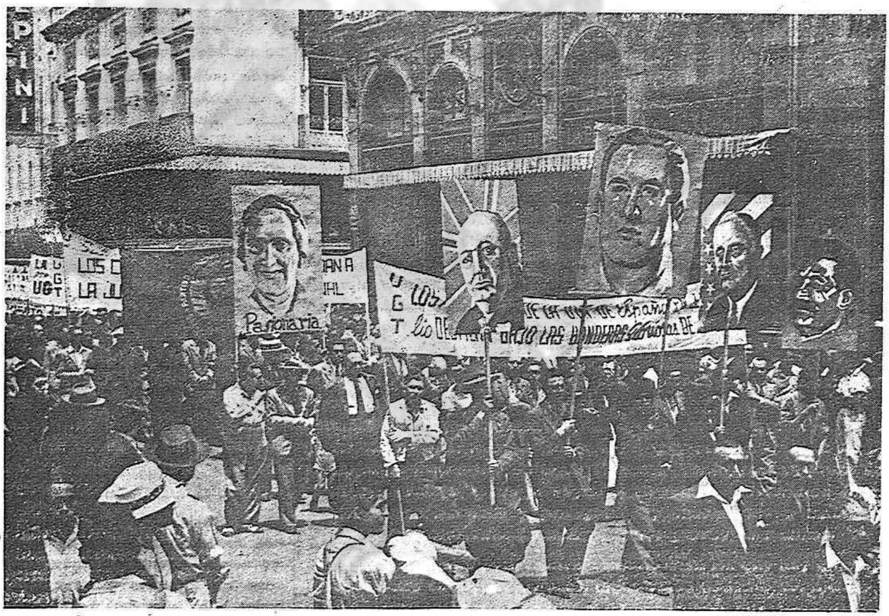
Un aspecto de la columna española