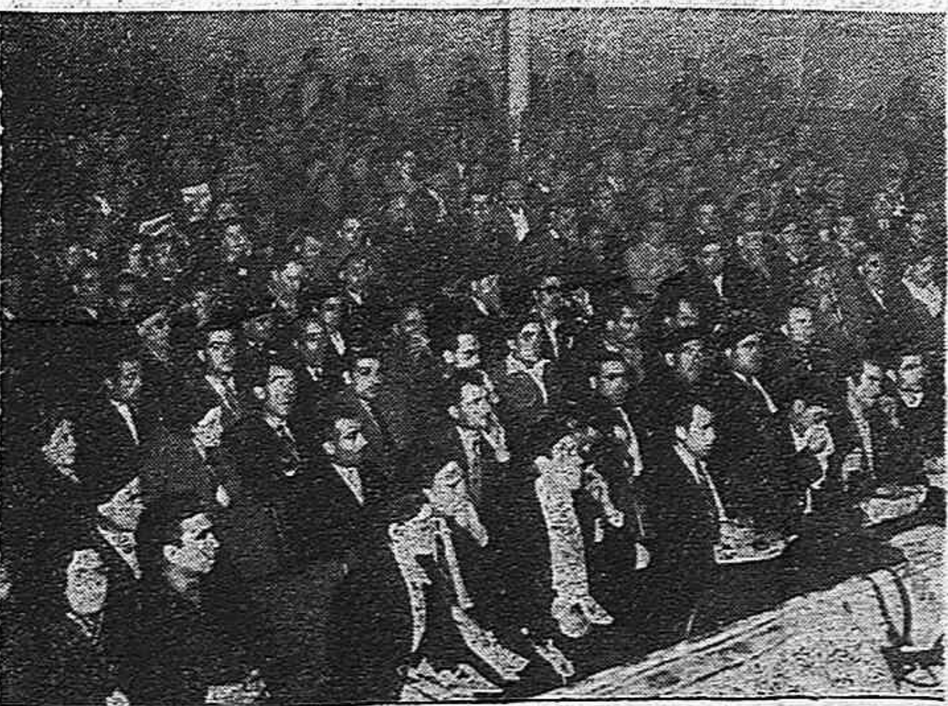
Otro detalle del Teatro