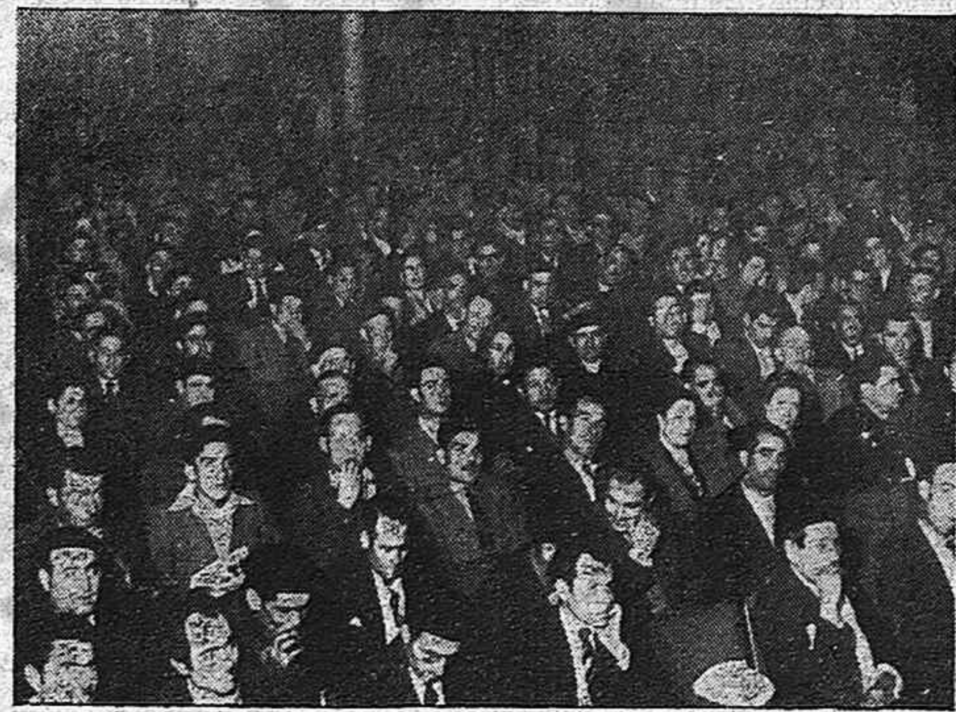
Otra vista del patio de butacas.

El futuro demostrará la eficacia del Congreso Libertario. Y no podemos anticipar más que el Movimiento y la CNT no aceptan componentes de ninguna especie, no traicionan jamás los intereses del pueblo español y sabrán justificar su intransigencia impulsando la lucha directa, movilizando todas sus fuerzas y enarbolando la bandera de la rebelión dentro de la fortaleza franquista.