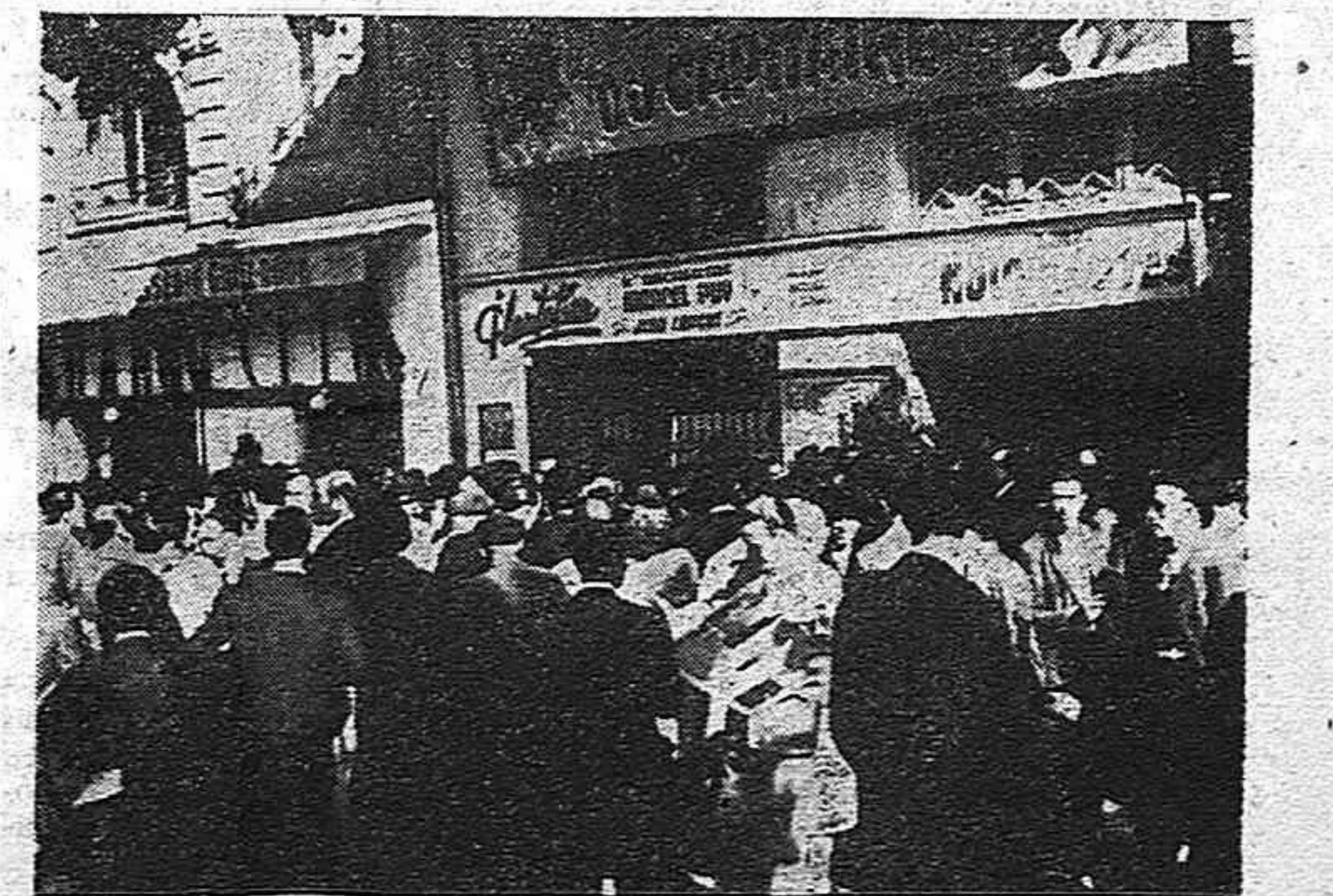
La aglomeración a la puerta del Teatro.

El fiscal ha pedido la pena de muerte contra cinco de los encartados: un hombre y cuatro mujeres. Se teme que el Tribunal franquista dicte sentencia de acuerdo con la petición fiscal como es norma en esta clase de enjuiciamientos arbitrarios que caracterizan al régimen franquista.