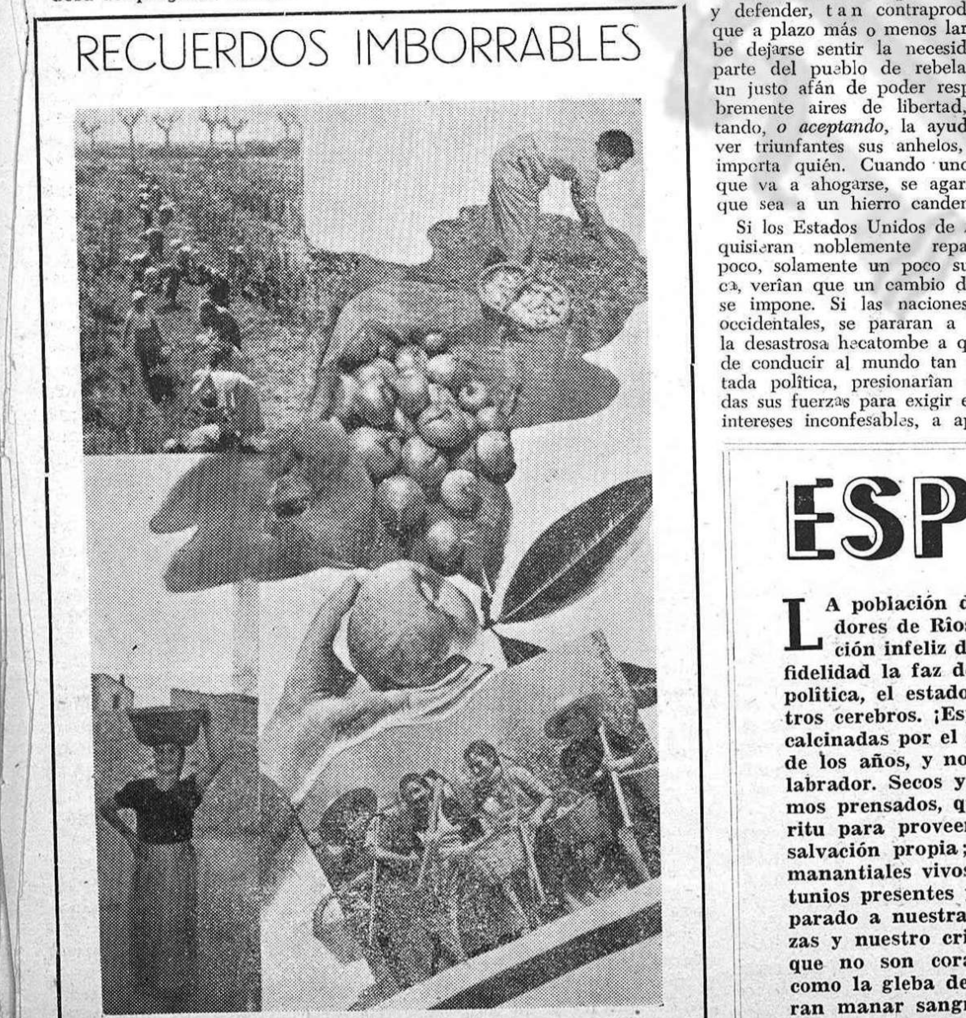
Ayer, las mujeres de la España campesina sonreían llevando el alimento a sus hogares. Hoy... lloran amargamente, porque el régimen de Franco ha convertido las tierras españolas en un verdadero erial.

RECUERDOS IMBORRABLES Ayer, las mujeres de la España campesina sonreían llevando el alimento a sus hogares. Hoy... lloran amargamente, porque el régimen de Franco ha convertido las tierras españolas en un verdadero erial.