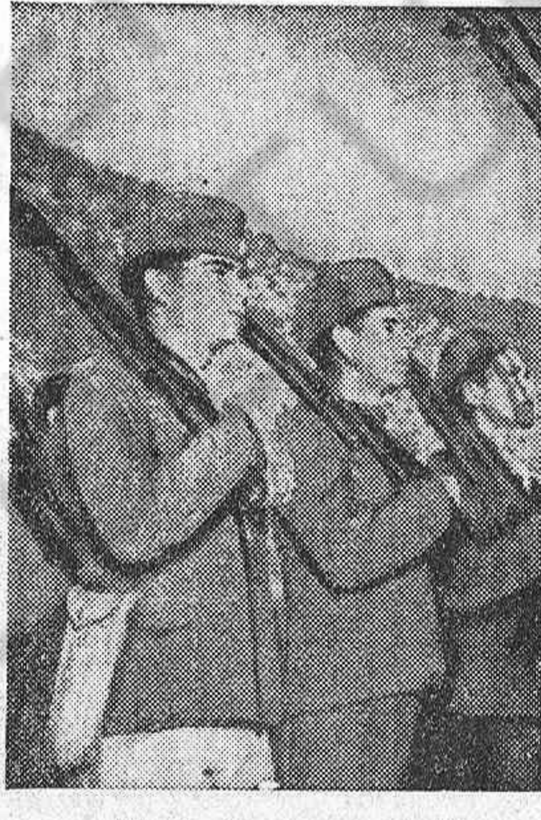
Un destacamento del heroico Ejército democrático griego.

En el corazón de Europa, miles de jóvenes obreros, campesinos y estudiantes, representando a millones y millones de jóvenes de todo el mundo, se reúnen para decir a los fomentadores de guerra y sus lacayos: No, nosotros no haremos la guerra que los señores del dólar y sus satélites quieren.