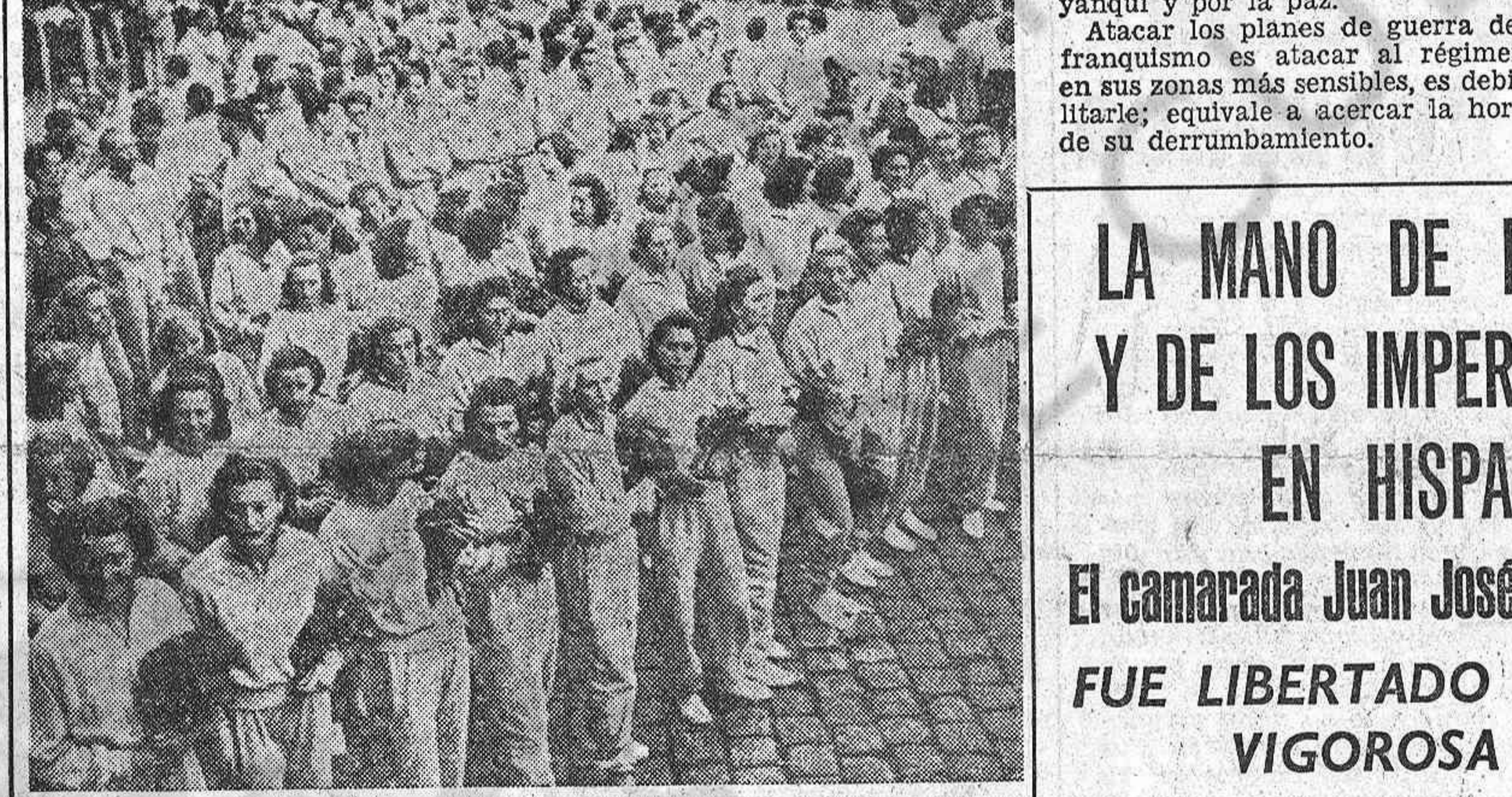
Arriba: Grupo femenino de las juventudes húngaras en el Festival de Budapest.