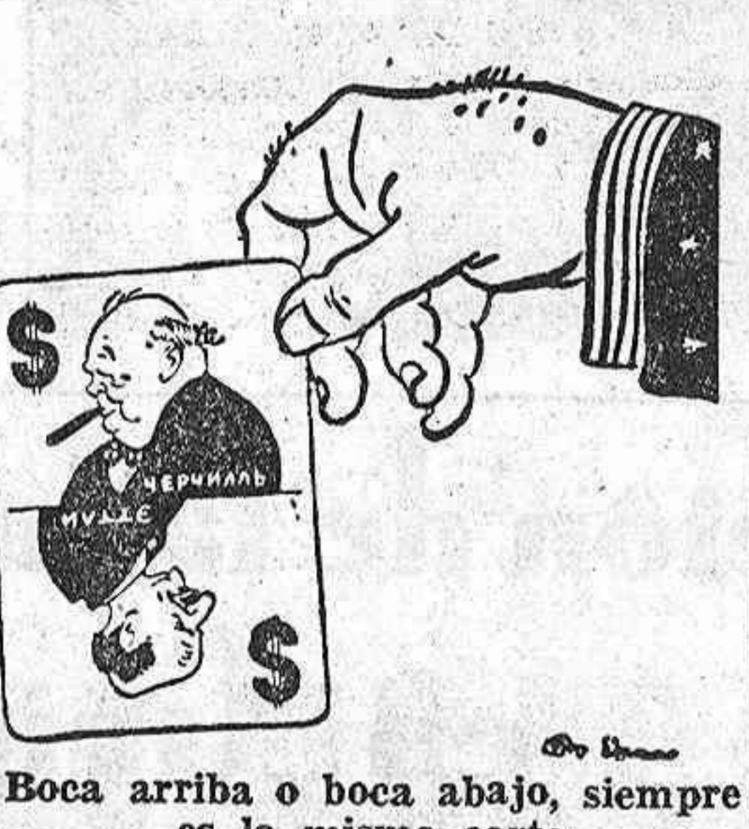
Boca arriba o boca abajo, siempre es la misma carta