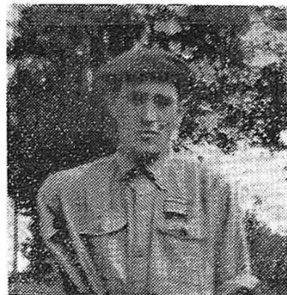
Ha intervenido en ochenta y dos acciones guerrilleras en Francia.

¡ Qué de peripecias ! ¡ Haría falta un libro muy grande !