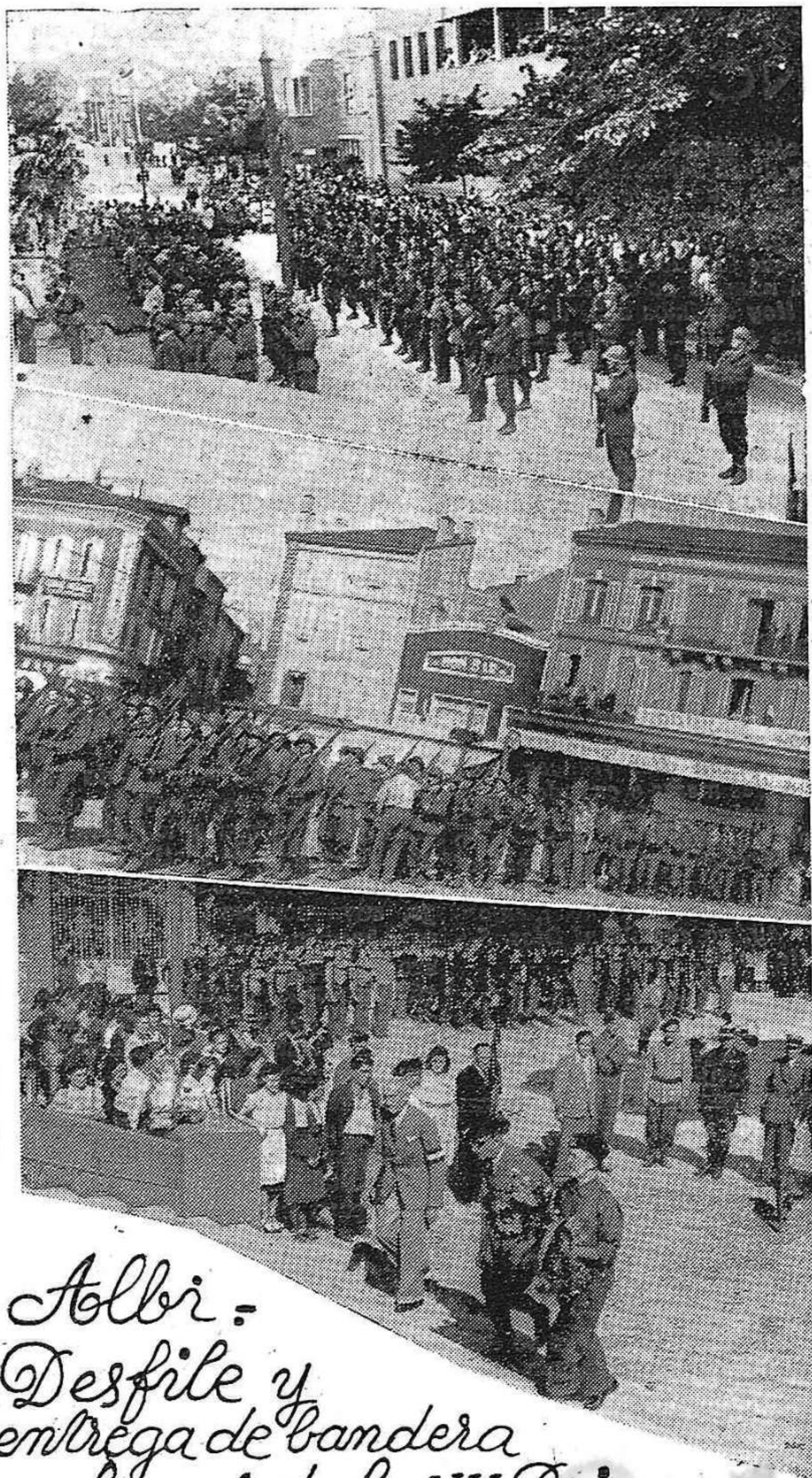
Albi - Desfile y entrega de bandera en honor de la VII Brigada

España necesita que todos los jóvenes participen en la lucha