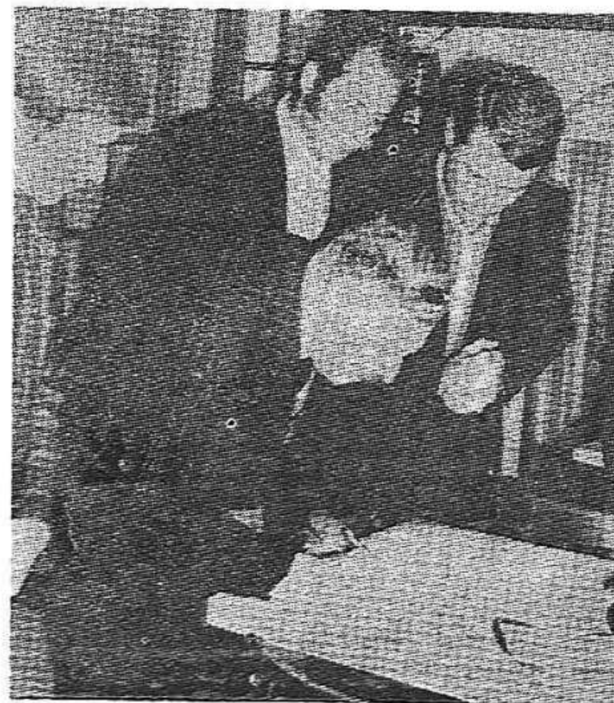
El alcalde firmando el libro de oro