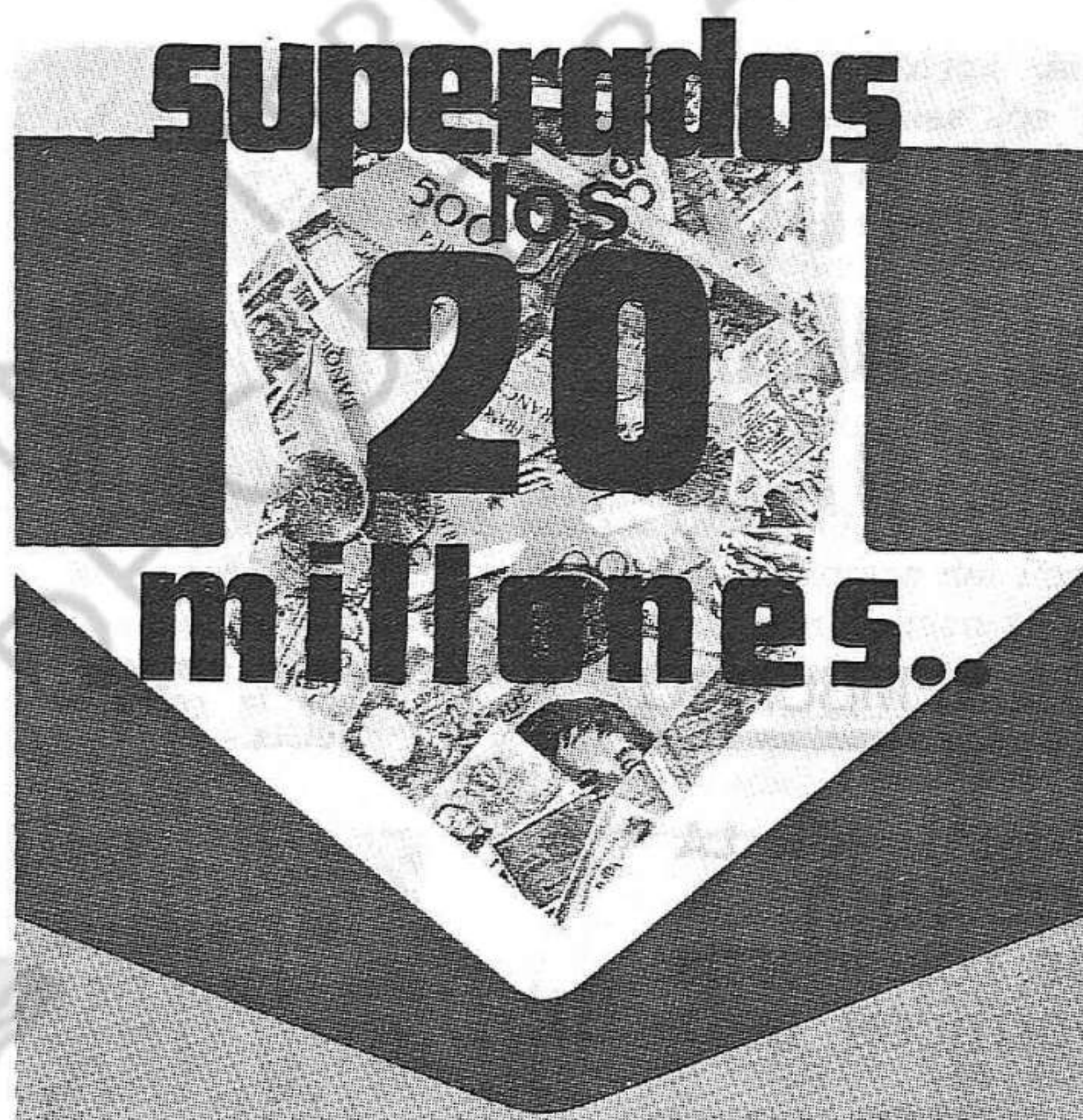
CUADRO DE CAMPAÑA (1) EN LA EMIGRACION (Europa, Australia y Canadá)