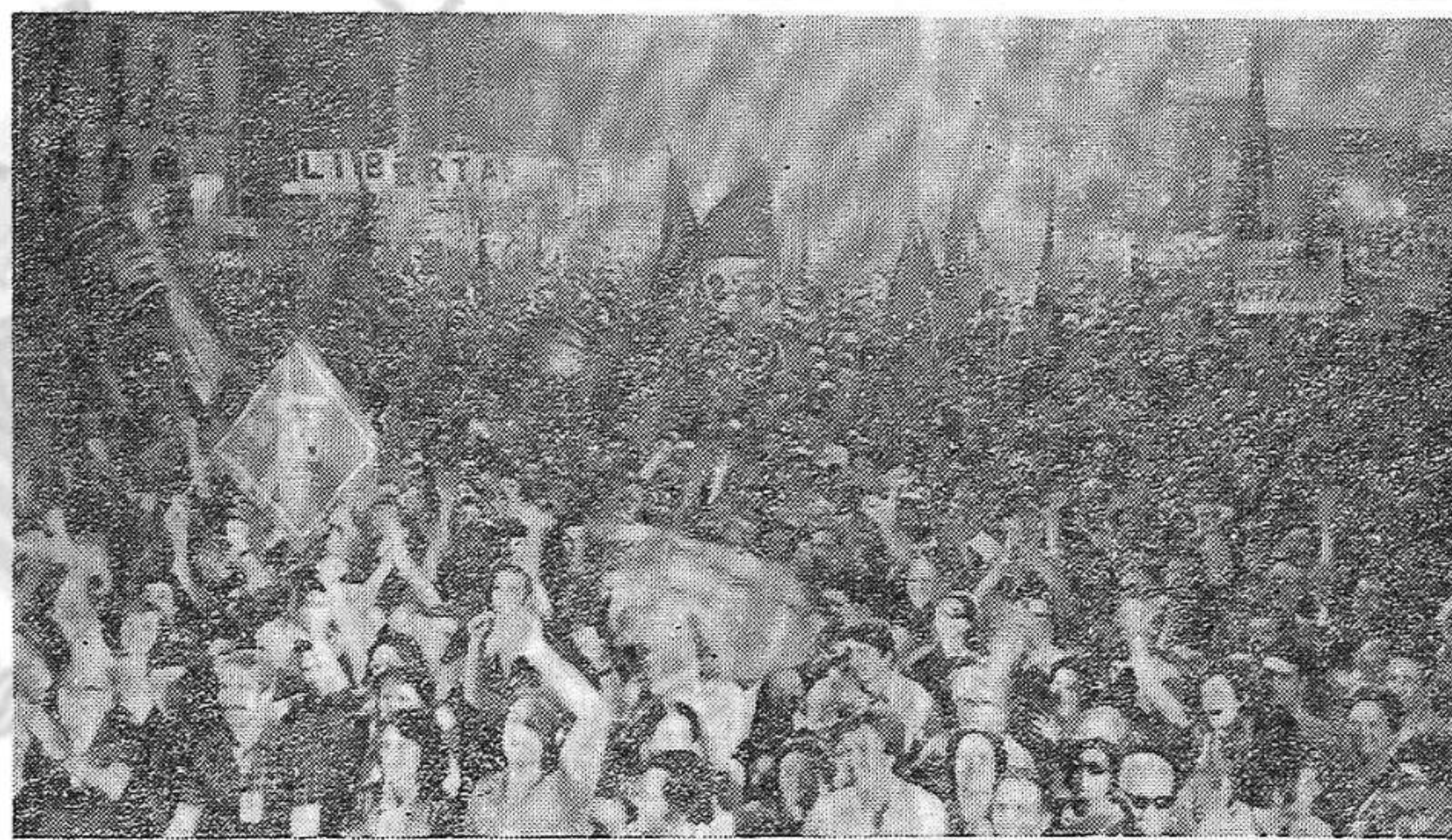
La multitud en Piazza Republica de Livorno

mocrática que significa el avance hacia el socialismo, y la realización del socialismo mismo, por las masas, por el pueblo, por sus fuerzas político-sociales representativas, sin que ni unas ni otras se arroguen protagonismos mesiánicos. Si la historia la hacen los pueblos, al pueblo de cada país le corresponde hacer la del socialismo.