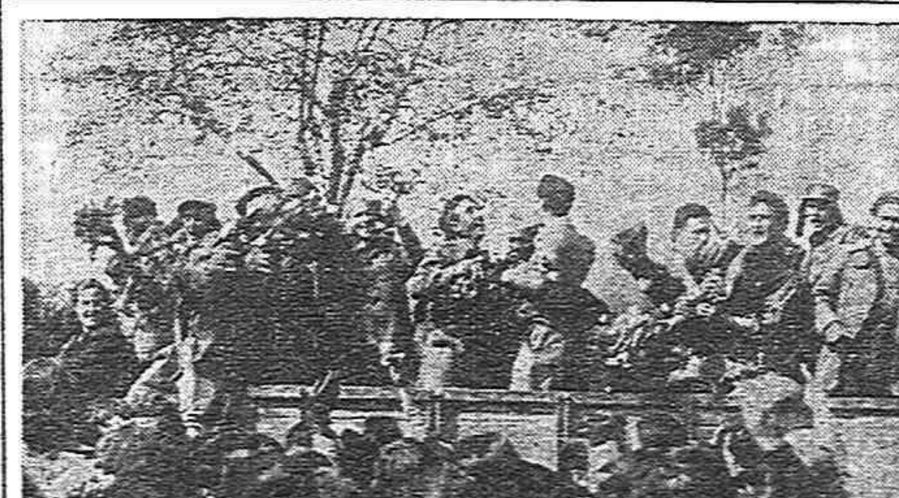
El pueblo de Madrid rodea con su cariño a los combatientes que regresan con permiso. He aquí una alegre escena de los días de la heroica lucha.

L'Administrateur-Général: Fernando Fernández LAVIN. Imprenta: MONTMARTRE-PRESSE. 21, rue Montmartre, Paris-10.