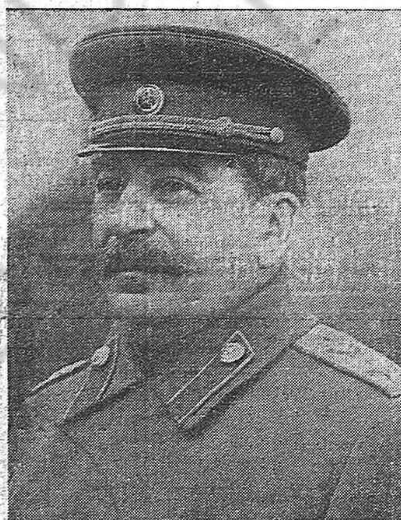
Stalin, que con Lenin dirigió la Revolución de Octubre y con él creó el Estado soviético, constructor del socialismo en la sexta parte de la tierra, fue además el estratega genial que al frente del inmenso poder de la U.R.S.S. salvó al mundo de la esclavitud hitleriana. Hoy los ojos de la clase obrera y los pueblos, que ven en él un maestro clarividente y a su mejor amigo, se vuelven hacia Stalin, el primer defensor de la paz.