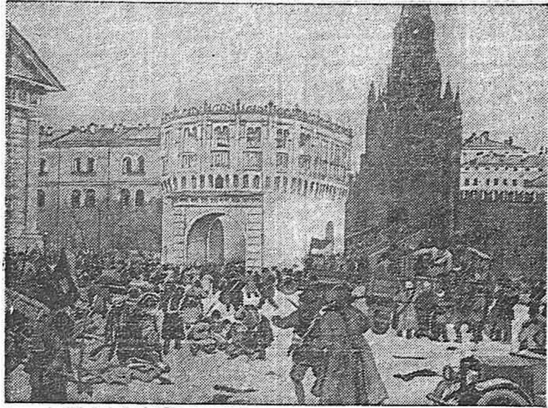
La toma del Kremlin por las tropas del Comité Militar Revolucionario (octubre de 1917), según un cuadro del pintor K. Ionov.

más justa, que el proletariado puede gobernar con éxito un país sin burguesía y contra la burguesía. Demostró que los pensamientos de los espíritus más selectos de la Humanidad no eran un sueño; que es posible edificar una sociedad más justa sin la explotación del hombre por el hombre.