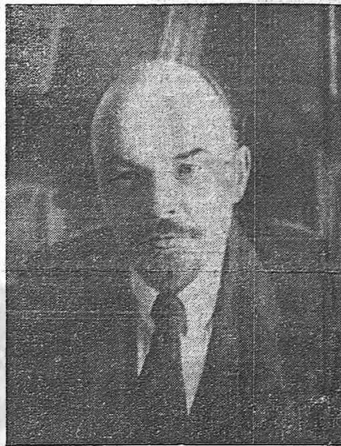
Lenin, artífice genial de la Revolución Socialista de Octubre, fundador del Estado soviético. Su memoria imperecedera es enseñanza, estímulo y guía en la lucha contra el imperialismo, en la marcha de la clase obrera y los pueblos hacia la libertad, hacia el socialismo, hacia una vida mejor. El tiempo asigna la figura de Lenin a sus manos y edificar una sociedad

Todo ello se produce por primera vez en la Historia. Ha sido la obra del gran Partido de Lenin y Stalin.