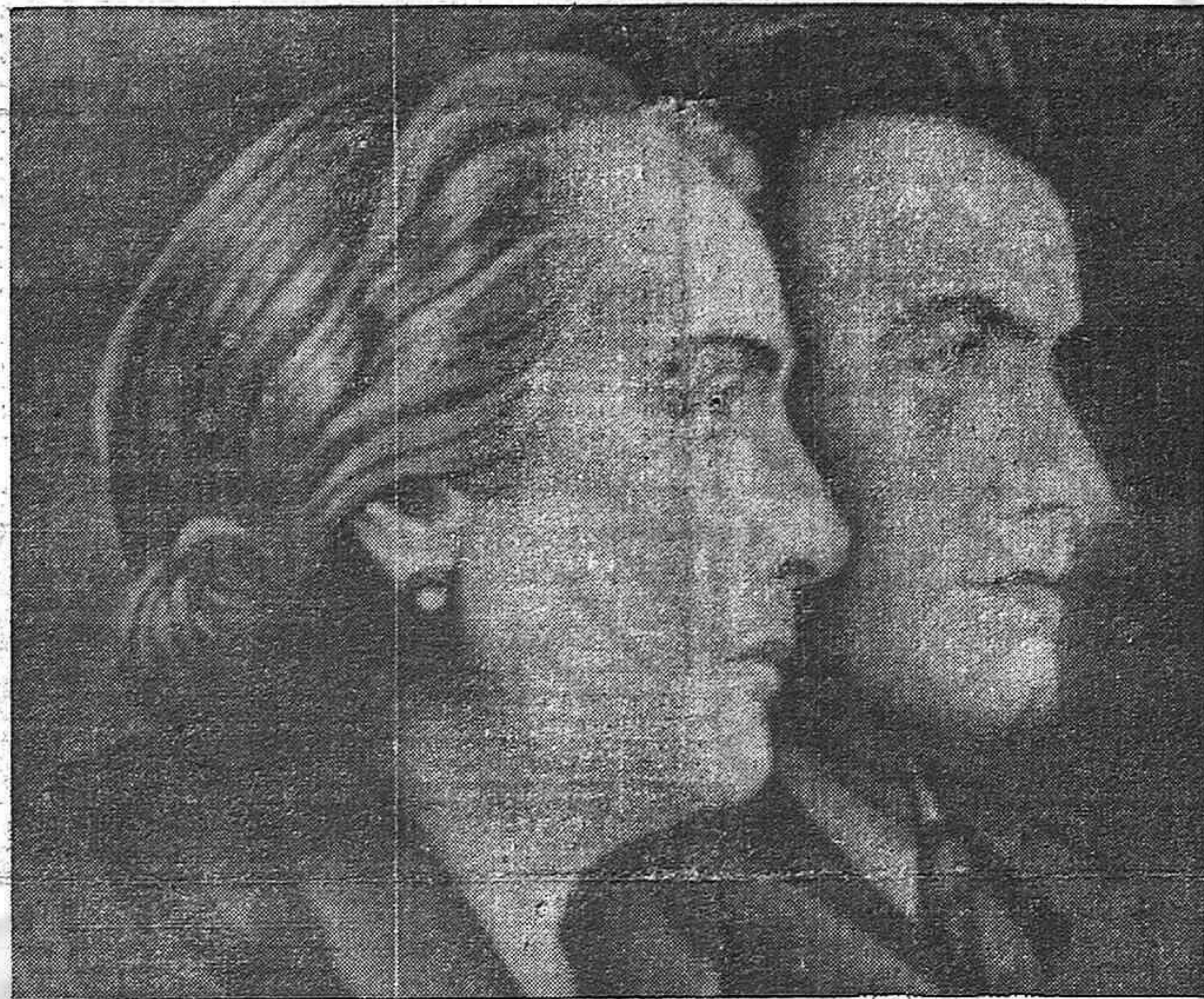
José Díaz y Dolores Ibaruri, que a la cabeza del Partido Comunista de España fueron voz, impulso y guía de la gesta del pueblo español en los días heroicos de noviembre, en nuestra guerra de liberación.

El pueblo vió entonces su fuerza, se conoció a sí mismo como lo que es: como un gigante. Aprendió a luchar. Los que hoy pegan carteles clandestinos y organizan huelgas, los guerrilleros de Levante, de Galicia, de Castilla y Andalucía aprendieron a combatir en Madrid, en Guadalajara, en el Ebro. Conmemorarán esta fecha peleando por una República como aquella, con todas sus fuerzas, con toda su alma, cambiadas las palabras, que no el norte de su divisa de entonces, pues gritarán peleando: «¡Pasaremos!»