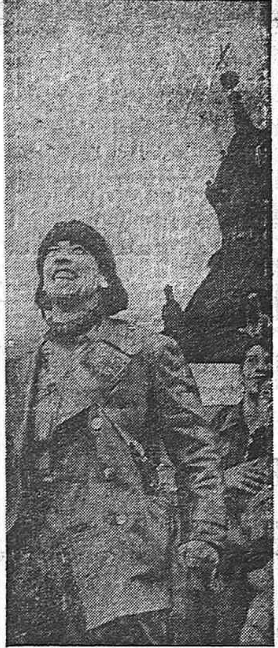
«¡Son nuestros!» Este era un grito frecuente en las calles de Madrid durante los días de noviembre ante la presencia de los achates, expresión de la solidaridad soviética.

«Olvídate esto, olvida todo lo que ha ocurrido desde 1936, es vivir en el reino de la quimera. Si en el campo republicano hubiera alguien tan insensato para hacer tabla rasa de este tremendo sacrificio de nuestro pueblo, haza las piedras se levantarían para recordárselo». Se equivocan pues quienes suponen que nuestro pueblo no ha sacado conclusiones de todo lo ocurrido durante la República. Nuestro pueblo ha sacado conclusiones, no olvida lo pasado y ahí está recordándose con su lucha a los que quisieran volver las cosas atrás y escamotear a nuestro pueblo la libertad y la democracia por que ha luchado y luchado.