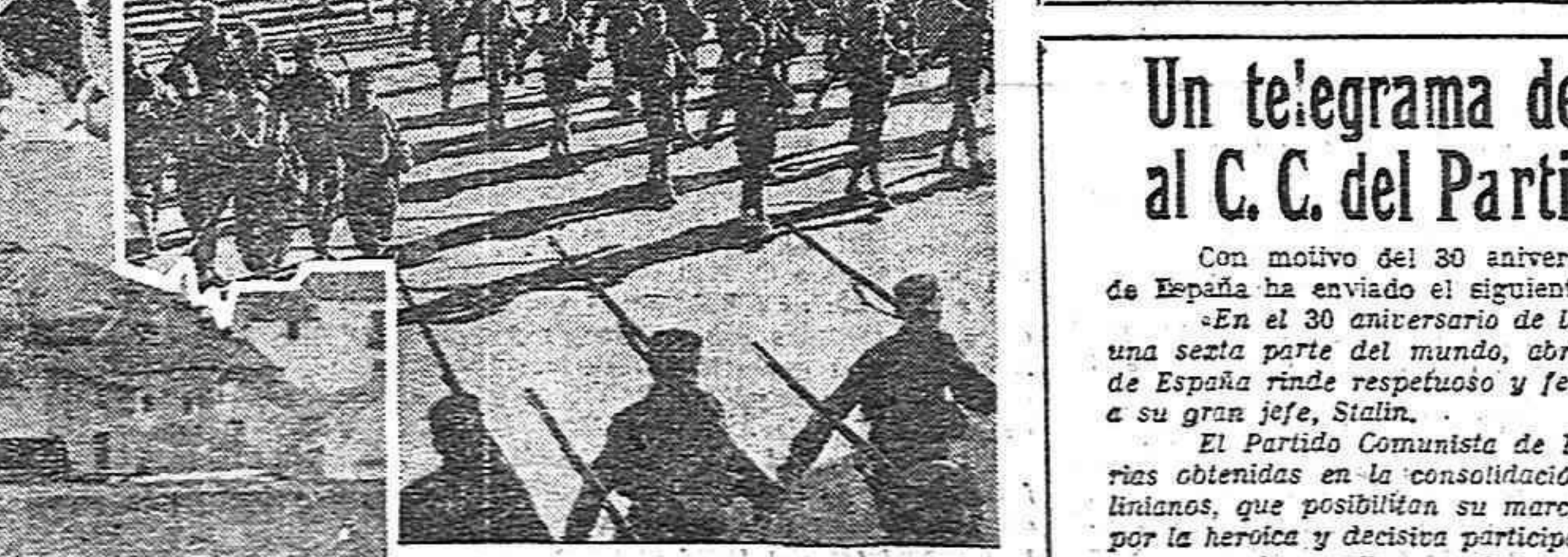
Varias escenas de los días de noviembre de 1936 en Madrid. Parapetos en la estación del Norte, barricadas al pie de las estatuas. Los héroes de Madrid desfilan por las calles acosadas por el enemigo, mientras las mujeres del pueblo de Madrid trabajan junto a la primera línea.

JUSTICIA Creación de los Tribunales populares integrados por magistrados y delegados de las organizaciones obreras y políticas fieles a la República.