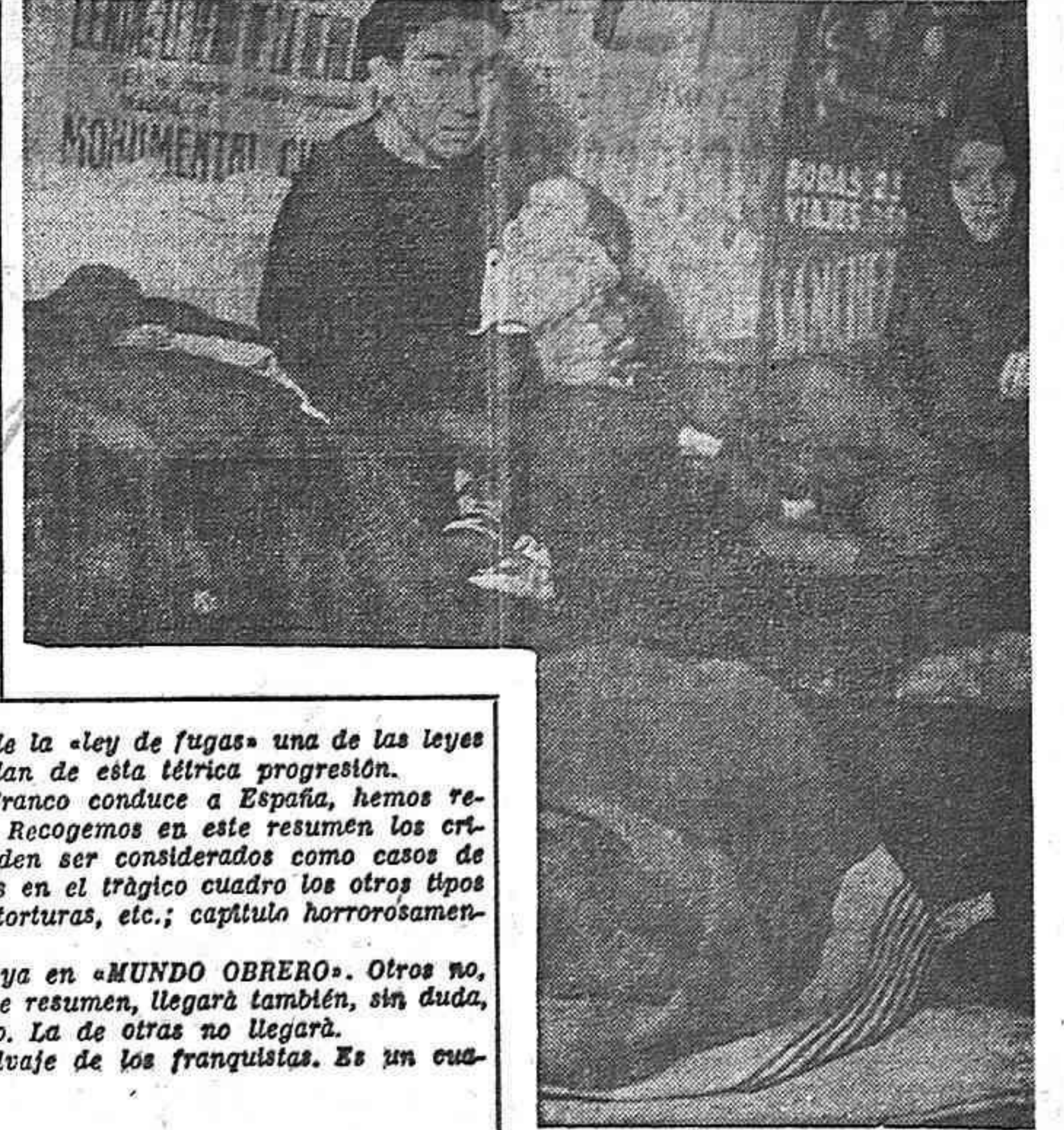
Madrid bajo la metralla nazi. Una noche de noviembre en el Metro de la capital. Y en los muros de la resistencia, el nombre de Lenin.

A un ritmo ascendente que causa horror, el franquismo está haciendo de la «ley de fugas» una de las leyes fundamentales de su régimen. Semana tras semana llegan noticias que hablan de esta trágica progresión.