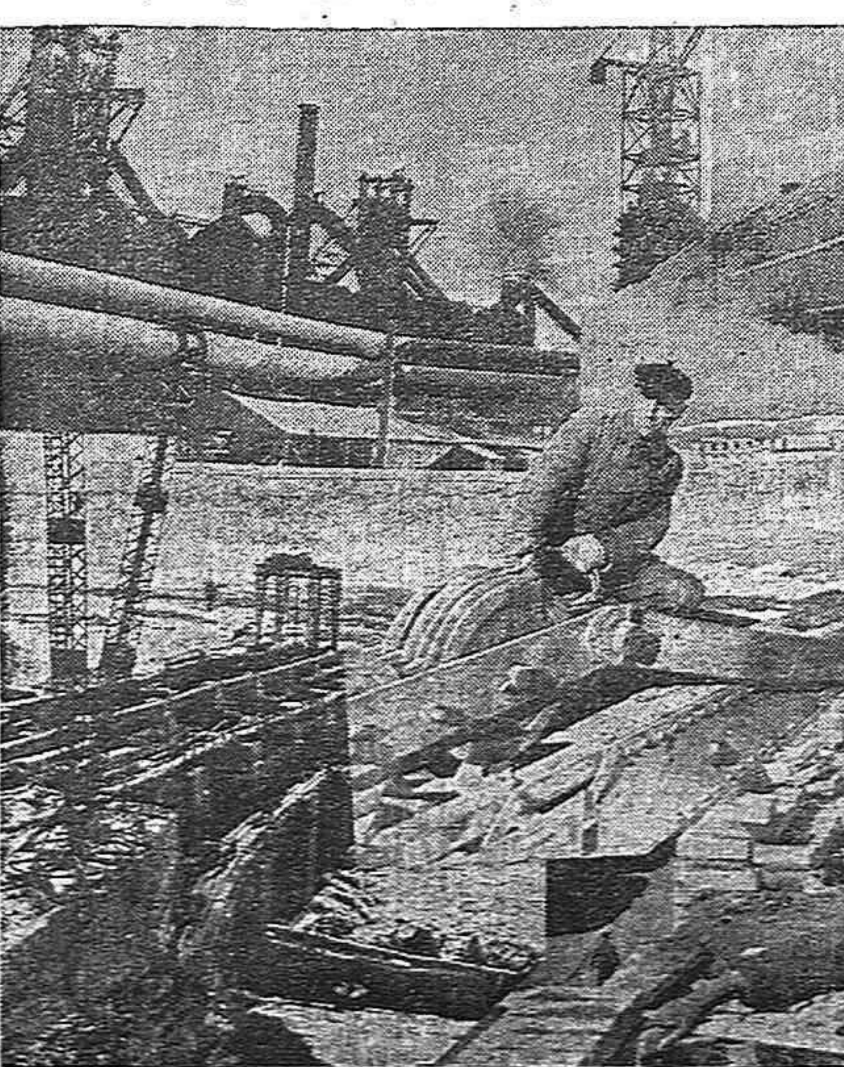
Diferentes aspectos del esfuerzo soviético en la reconstrucción.

«que el régimen social soviético se ha revelado como más viable y estable que el régimen social no soviético; que el régimen social soviético es una forma de organización social mejor que cualquier régimen social no soviético.»