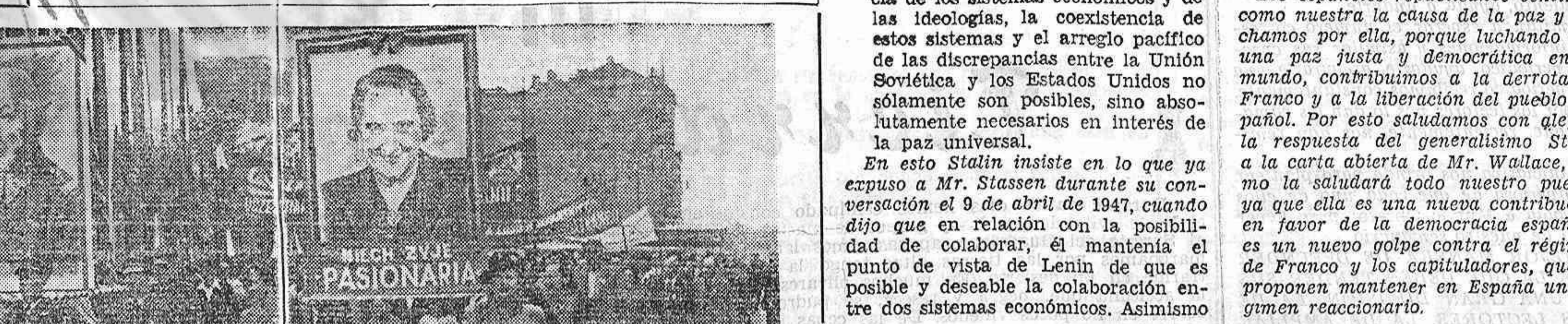
PRIMERO DE MAYO EN VARSOVIA. — Los manifestantes unieron en su homenaje la memoria del general Walter y la figura de Pasionaria.

En la pag. 4. LAS PROPOSICIONES DE MR. WALLACE Y EL COMUNICADO DE LA AGENCIA TASS DEL 19 DE MAYO