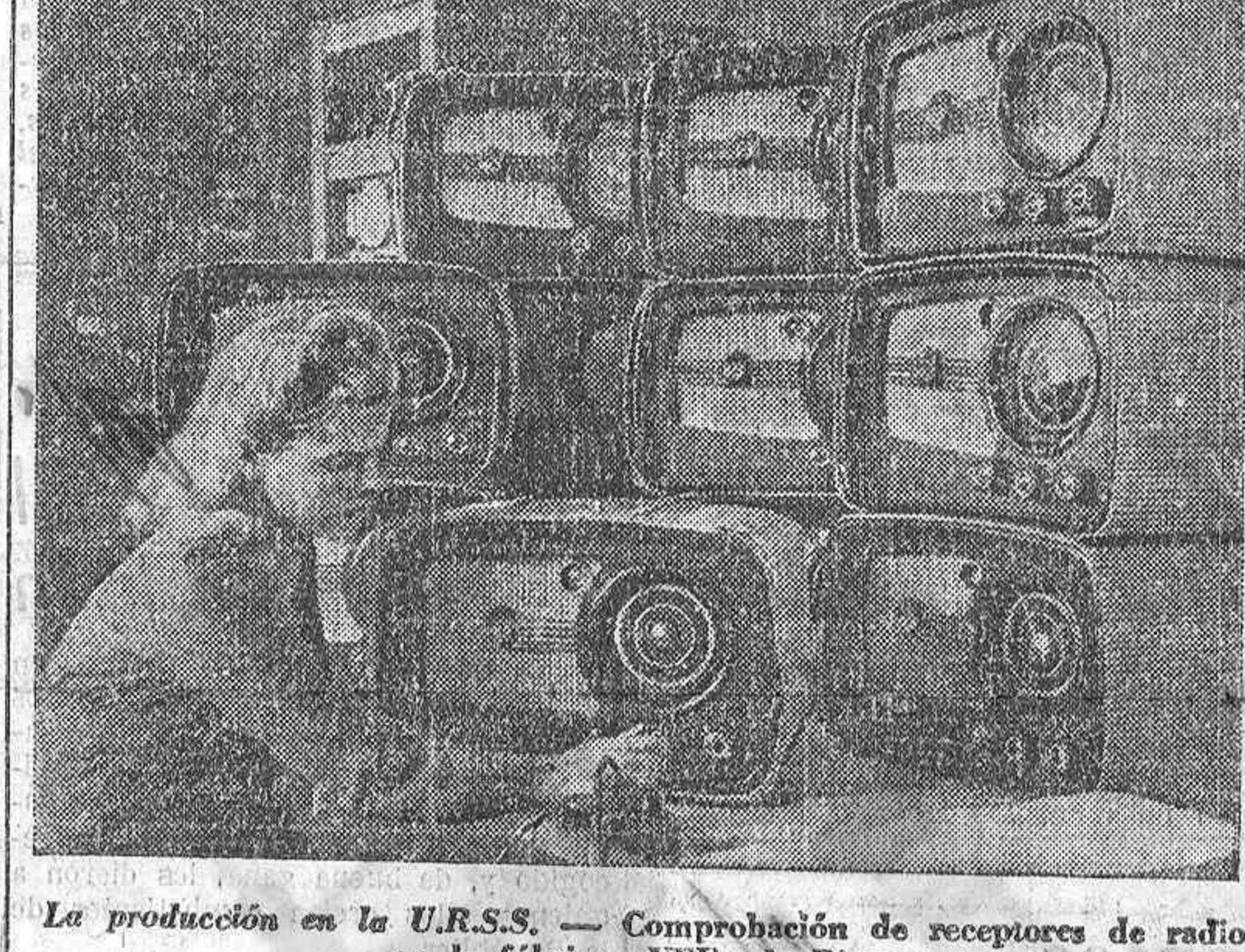
La producción en la UR.S.S. — Comprobación de receptores de radio en la fábrica «VEF» de Riga.

Gran difusión de los sellos de «Ayuda a España»