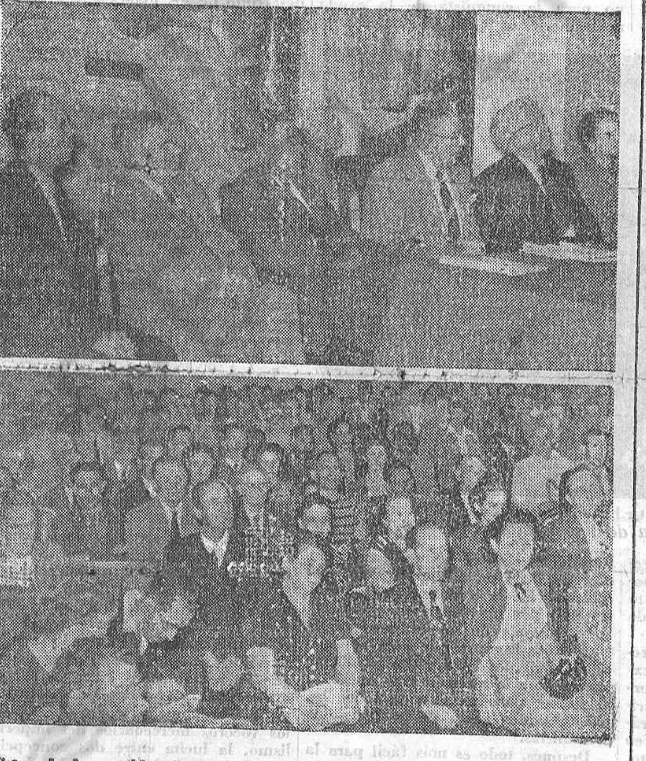
Vistas de la presidencia y de la sala durante el acto que tuvo lugar en la Casa de la Cultura de La Habana en homenaje a Zorúa y Nuño.