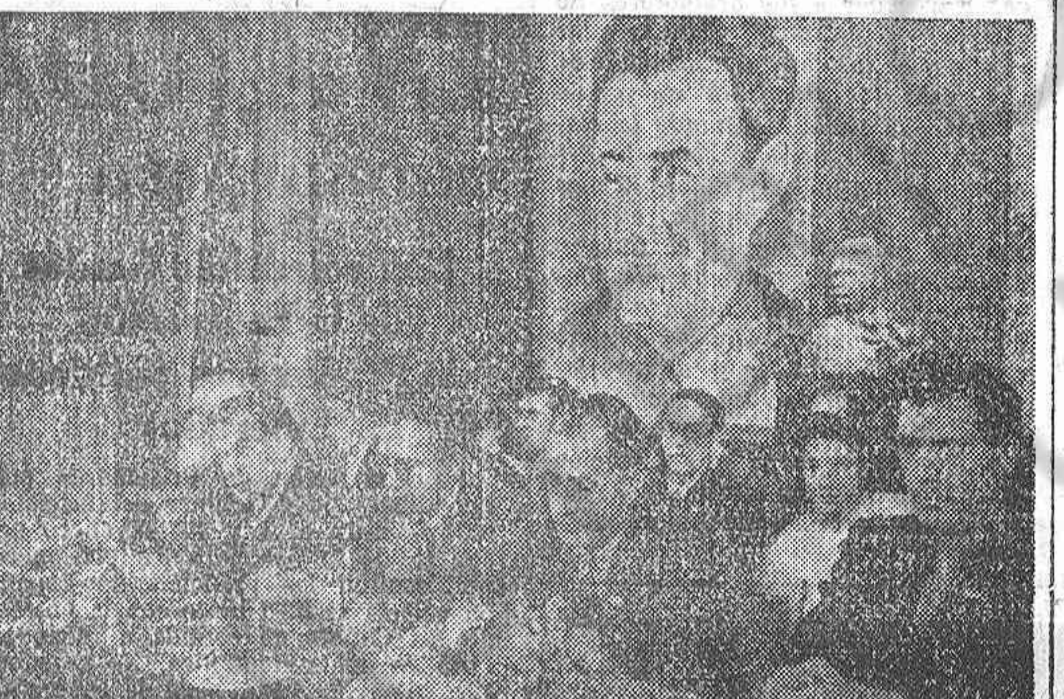
Presidencia del acto en el que los españoles residentes en Moscú celebraron en el XXX aniversario de la Revolución de Octubre.