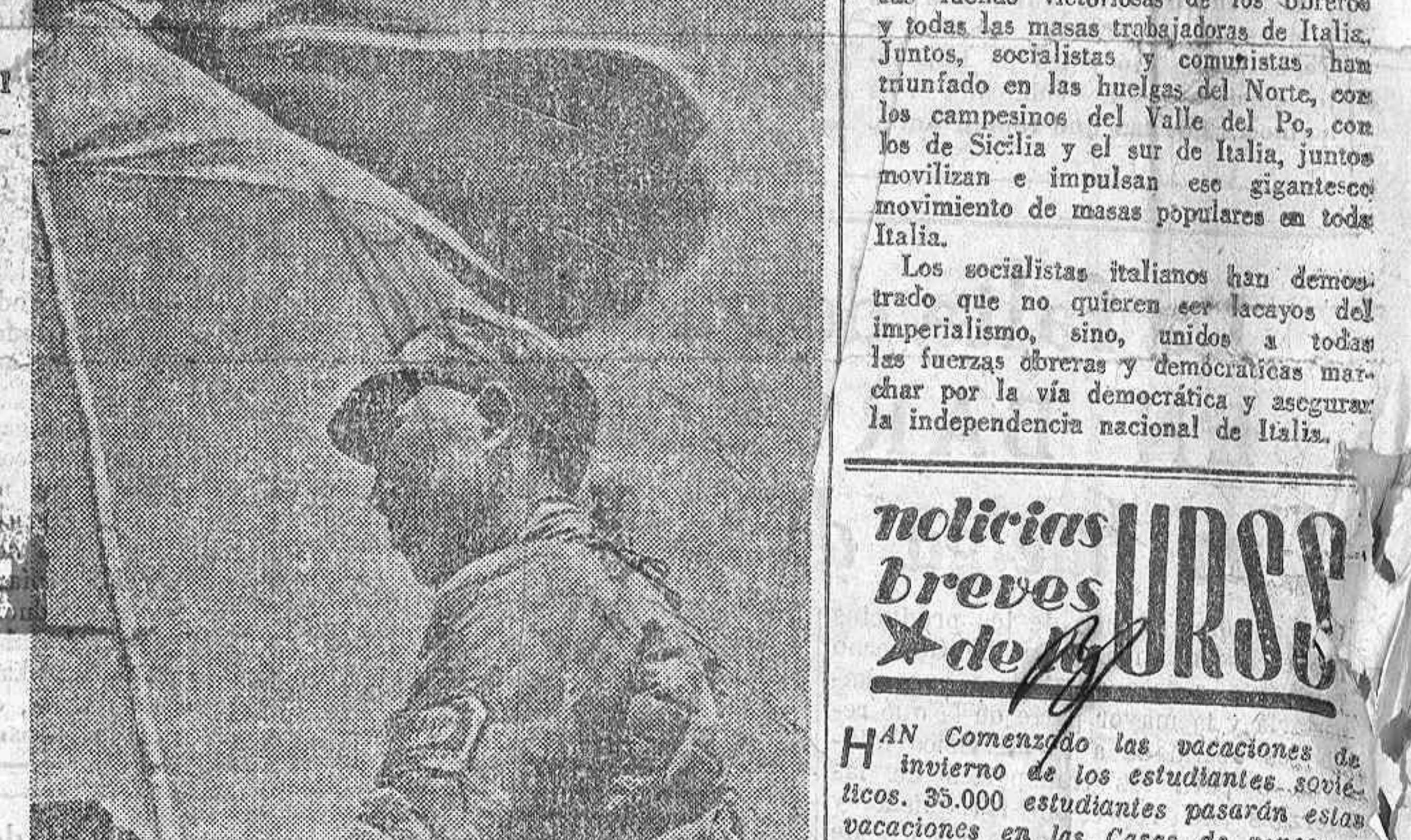
Combate del Ejército democrático chino.

Este hecho, es todavía más grandioso porque ha tenido lugar en el Este, en esta parte del mundo donde habitaban más de mil millones de personas. Dicho de otro modo, la mitad de la humanidad sufrió bajo el yugo del imperialismo.