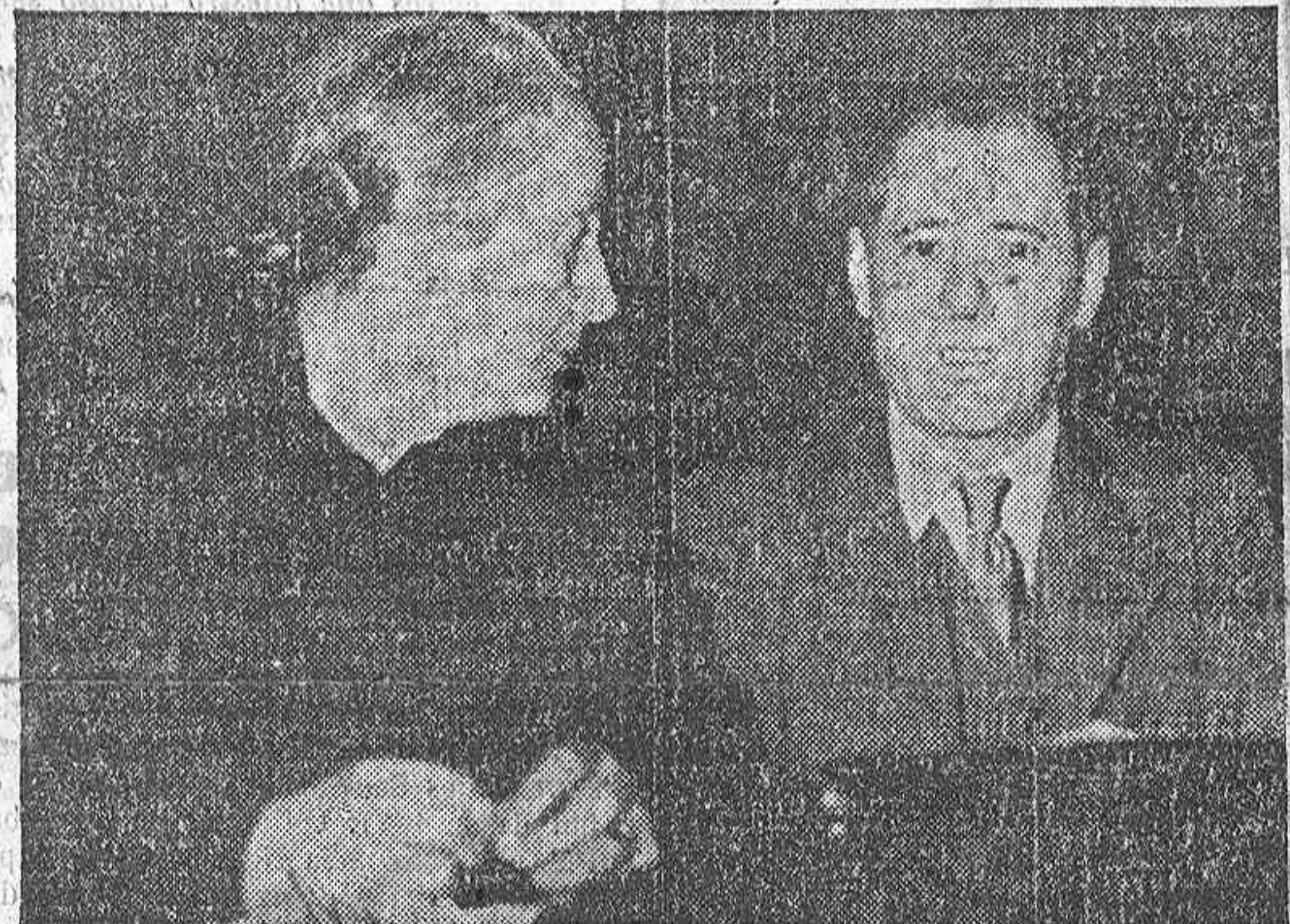
Dolores Ibaruri y Vicente Urbe en la asamblea de París.