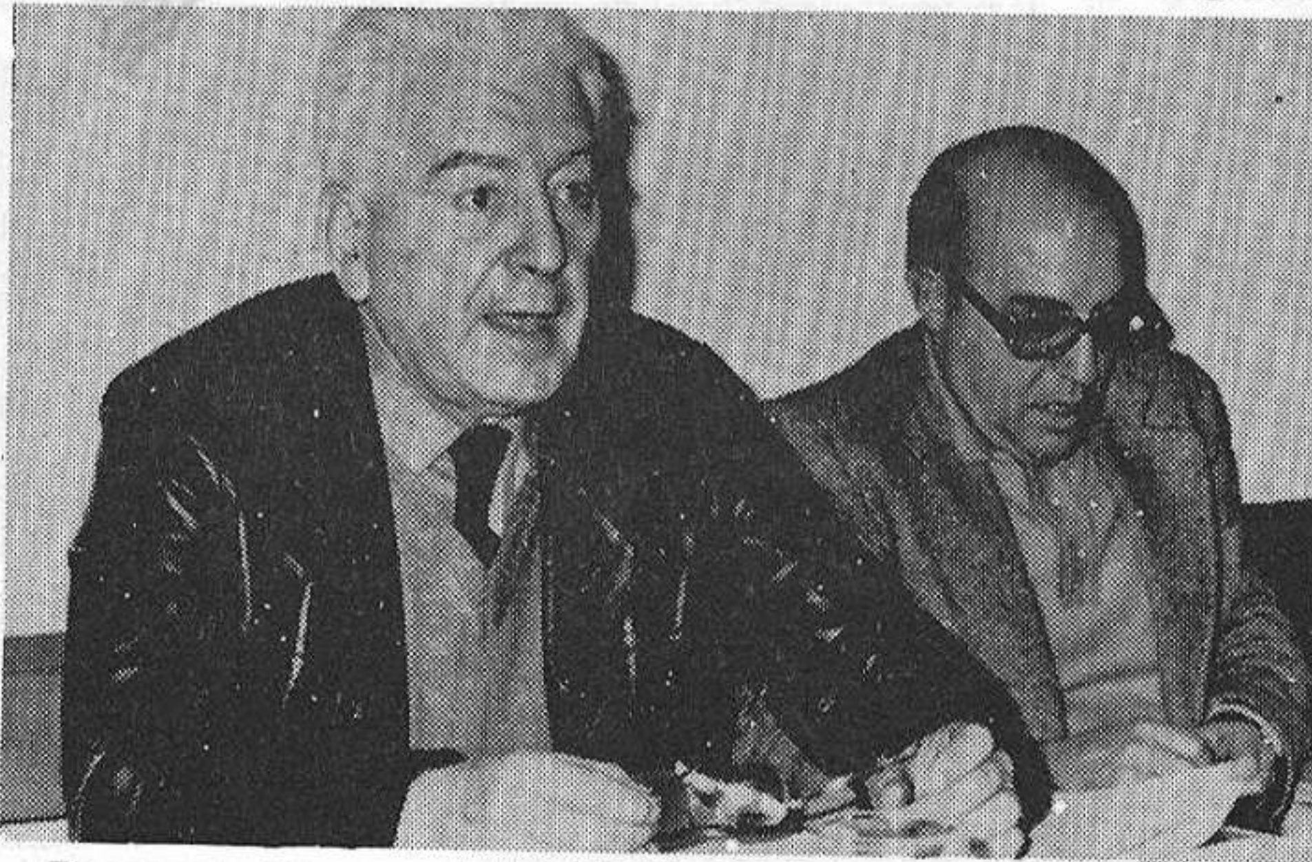
El secretario general del PSUC, Gregorio López Raimundo, y Manuel Azcárate, quien saludó a los comunistas catalanes en nombre del P.C. de España.

En cuanto a la legalización de partidos y sindicatos, la declaración denuncia cualquier discriminación como "la negación