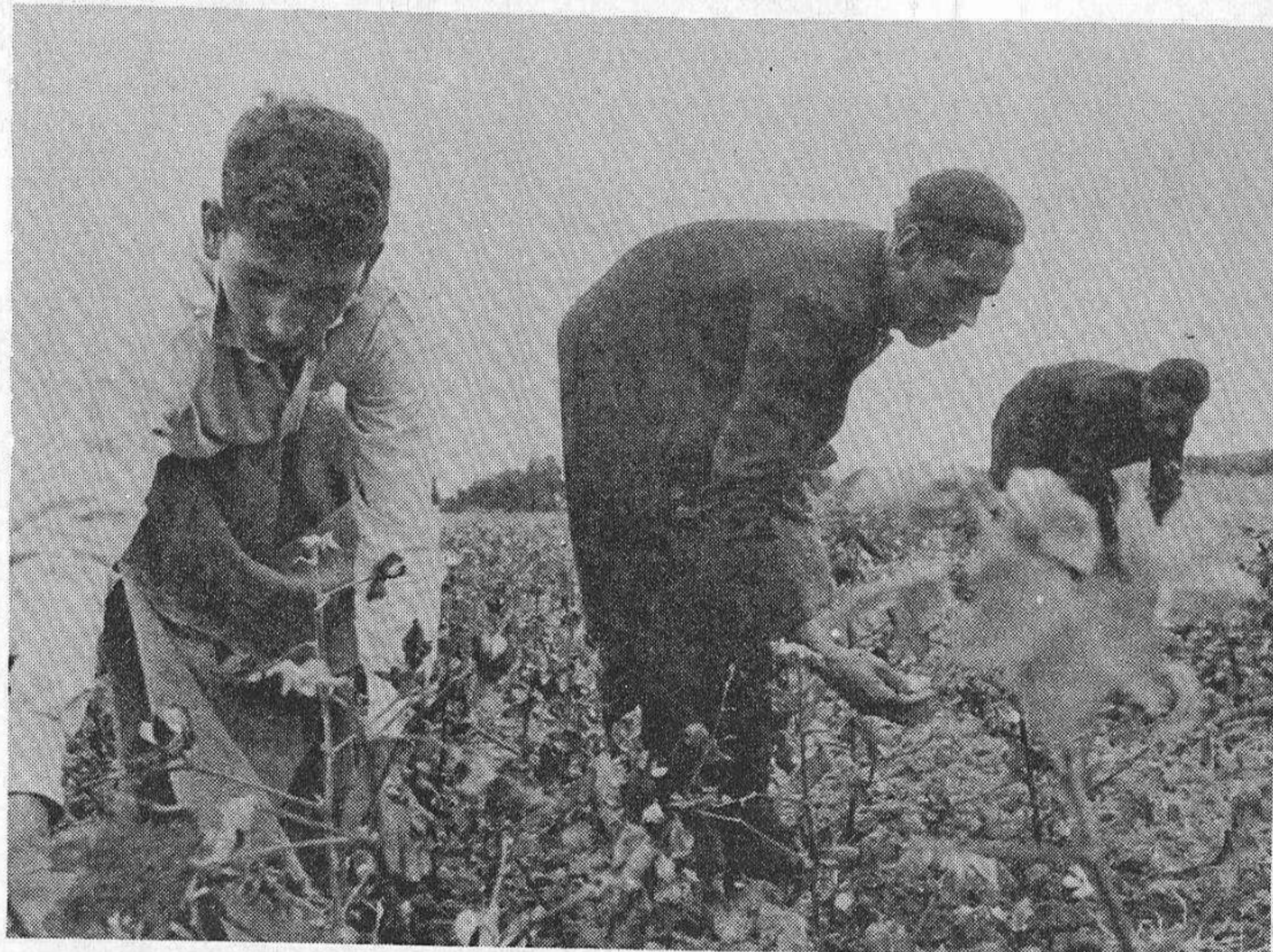
Es necesaria una amplia difusión de las ideas del Partido sobre los problemas del campo.

zos con sus lugares de origen, igual que universitarios y estudiantes, pueden prestar una gran ayuda en este trabajo.