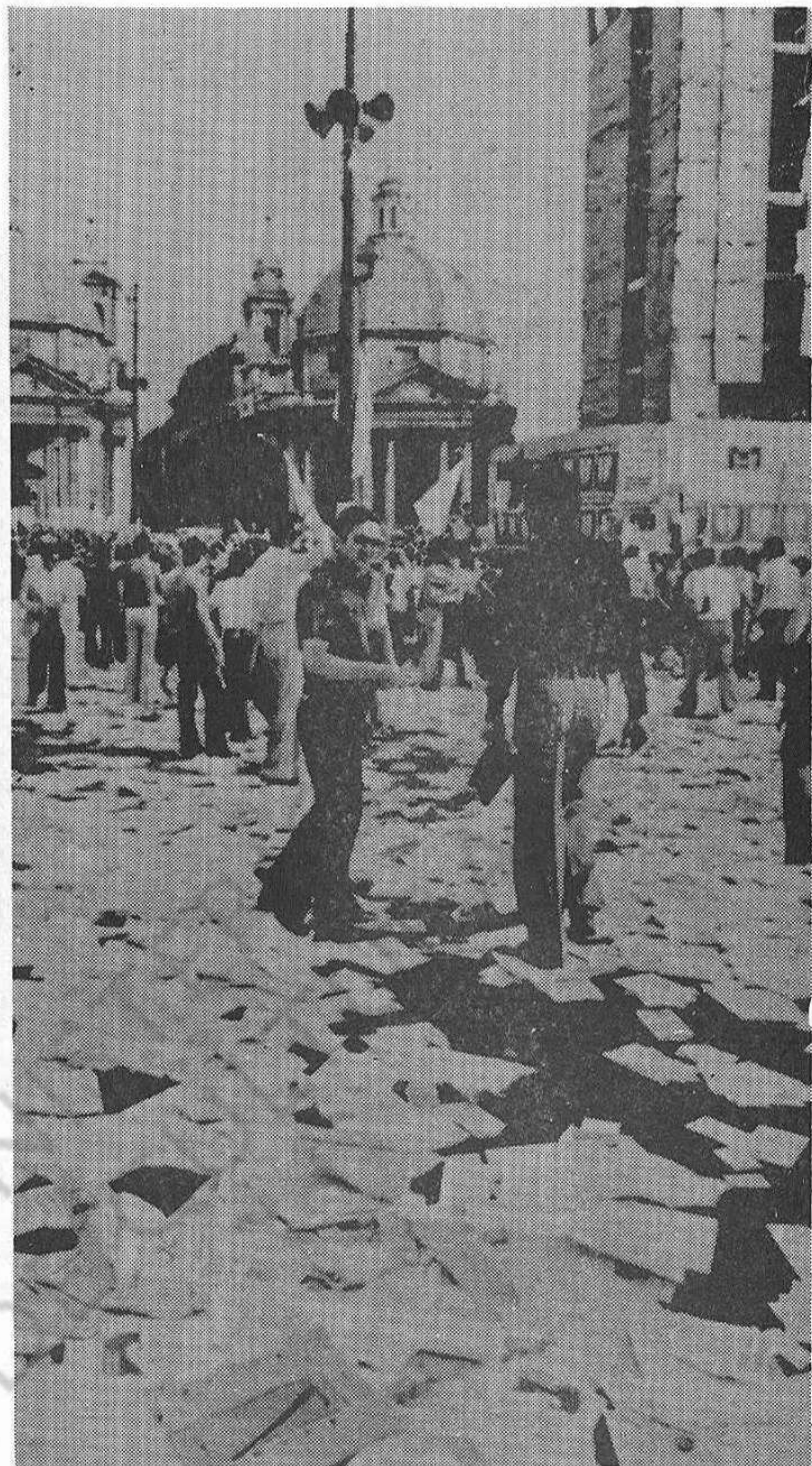
En Italia se votó por el cambio que la D.C. bloquea.

Cada tres meses sube en Italia el "cesto" (índice del coste de la vida). Las soluciones propuestas por el Gobierno (permitir la subida sólo para los salarios inferiores, o bien espaciarla cada seis meses) son rechazadas por los sindicatos, que exigen, para modificar las reivindicaciones económicas, la