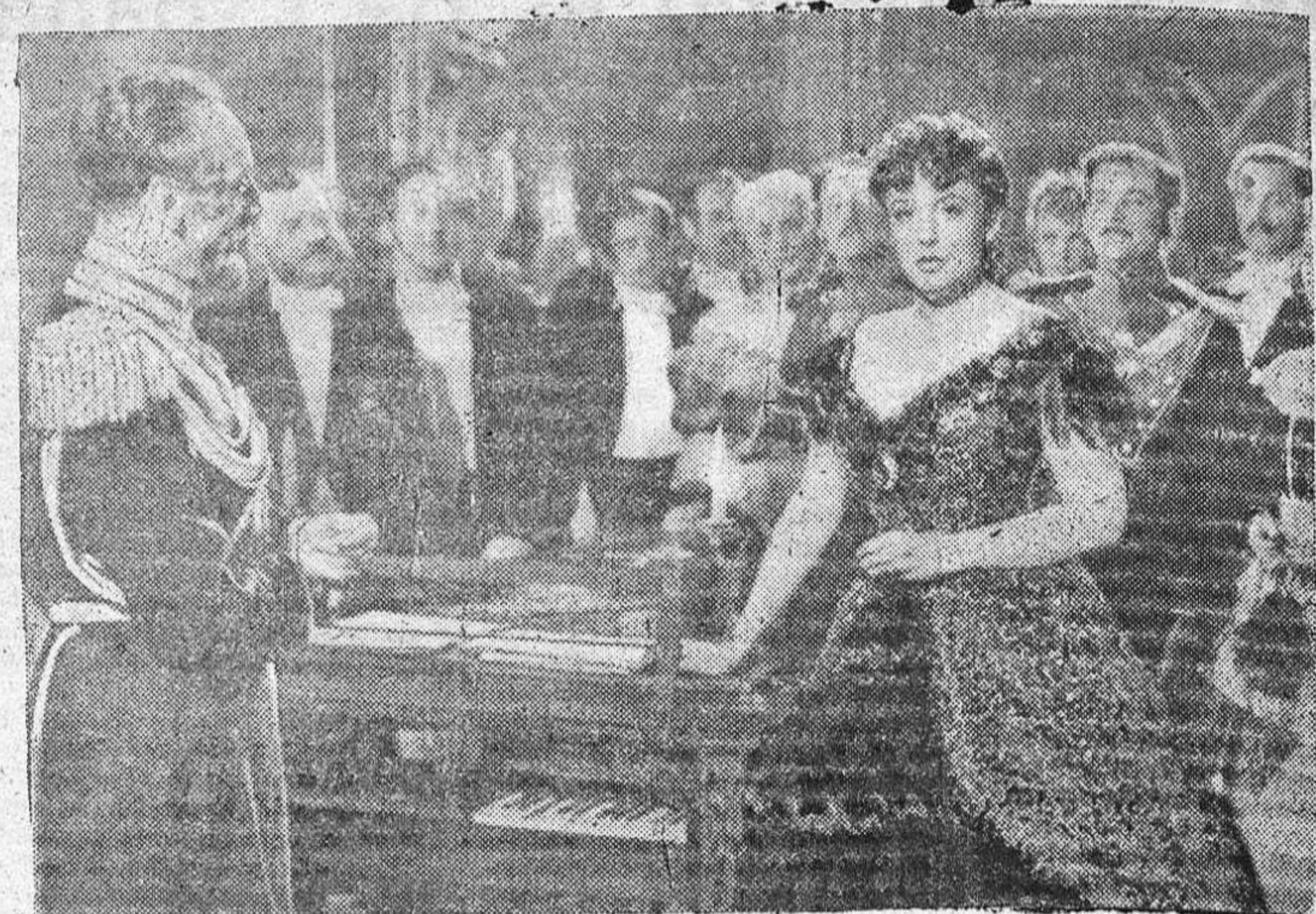
La gran artista sueca Zarah Leander en una nueva producción de la Ufa

Partes del cine norteamericano se ha vuelto descaradamente rojo. Charles Chaplin... que el insigne navegante era de origen judío.