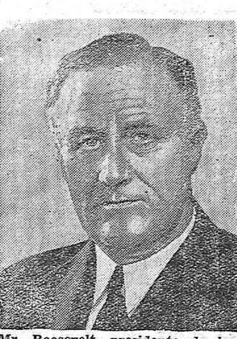
Mr. Roosevelt, presidente de los Estados Unidos, quien ha dicho que, si la Conferencia de las Nueve Potencias fracasara en su empresa, él continuaría personalmente, hasta conseguir la pacificación de la Lucha en el Extremo Oriente

La firma del pacto anti-soviético París.—La honda impresión causada por la adhesión de Italia al pacto germano-nipón contra el bolchevismo sigue preocupando a los círculos políticos franceses que han dado muestras inequívocas de nerviosismo. La próxima adhesión de otros países, entre ellos Portu-