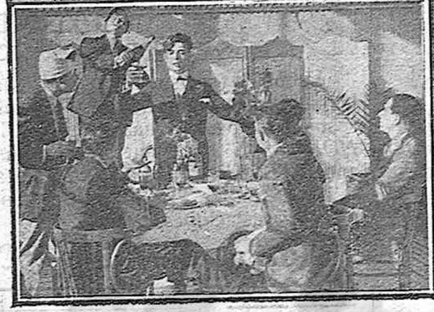
Una interesante escena de la película «Muñecas»

La pobre mecanógrafa seguía en la cárcel, a donde fué conducida el día memorable de la cobarde acción de Moscarós. Ella recabó para sí toda la responsabilidad del daño causado, y con la nobleza que tenía por norma, disculpó a todos. Nadie más que ella tomó parte en la agresión.