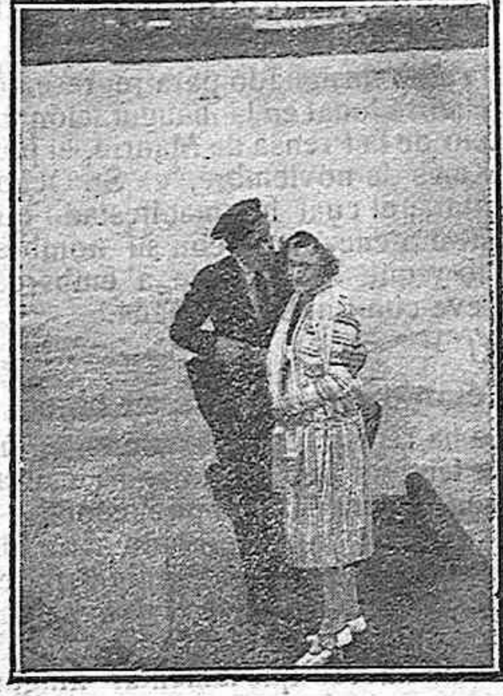
Alberto y la mecanógrafa en una tierna escena de «Muñecas»

La llegada de Alberto impidió que aquel día Moscarós confesase los secretos canalleros que ocultaba respecto a la desgraciada Amparo.