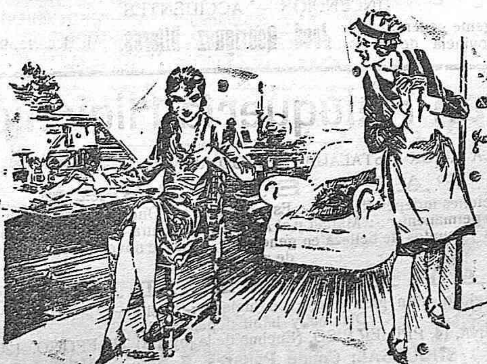
La señora.—He oído algo que se ha roto en la cocina hace un momento. La criada (con emoción).—Sí, señora... han sido... mis relaciones con el lechero.