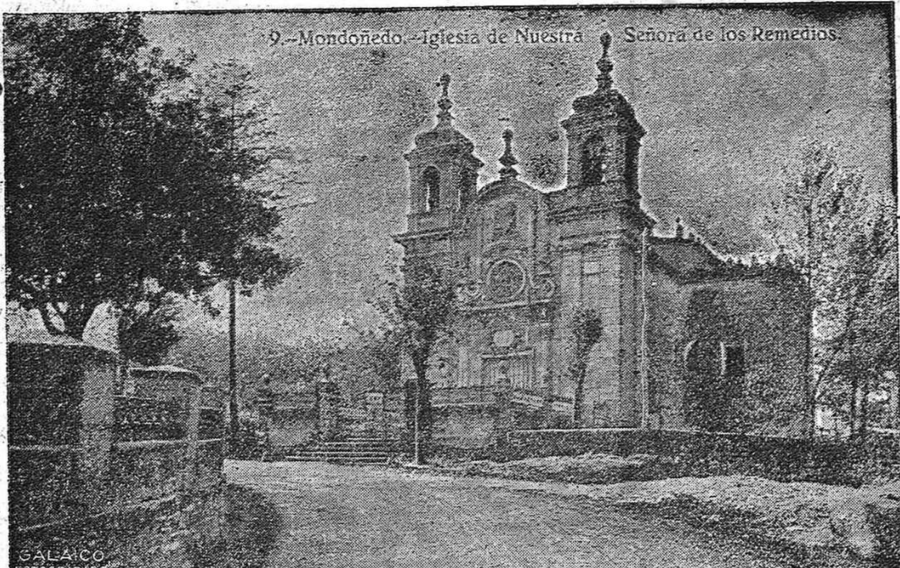
9.-Mondoñedo.-Iglesia de Nuestra Señora de los Remedios.