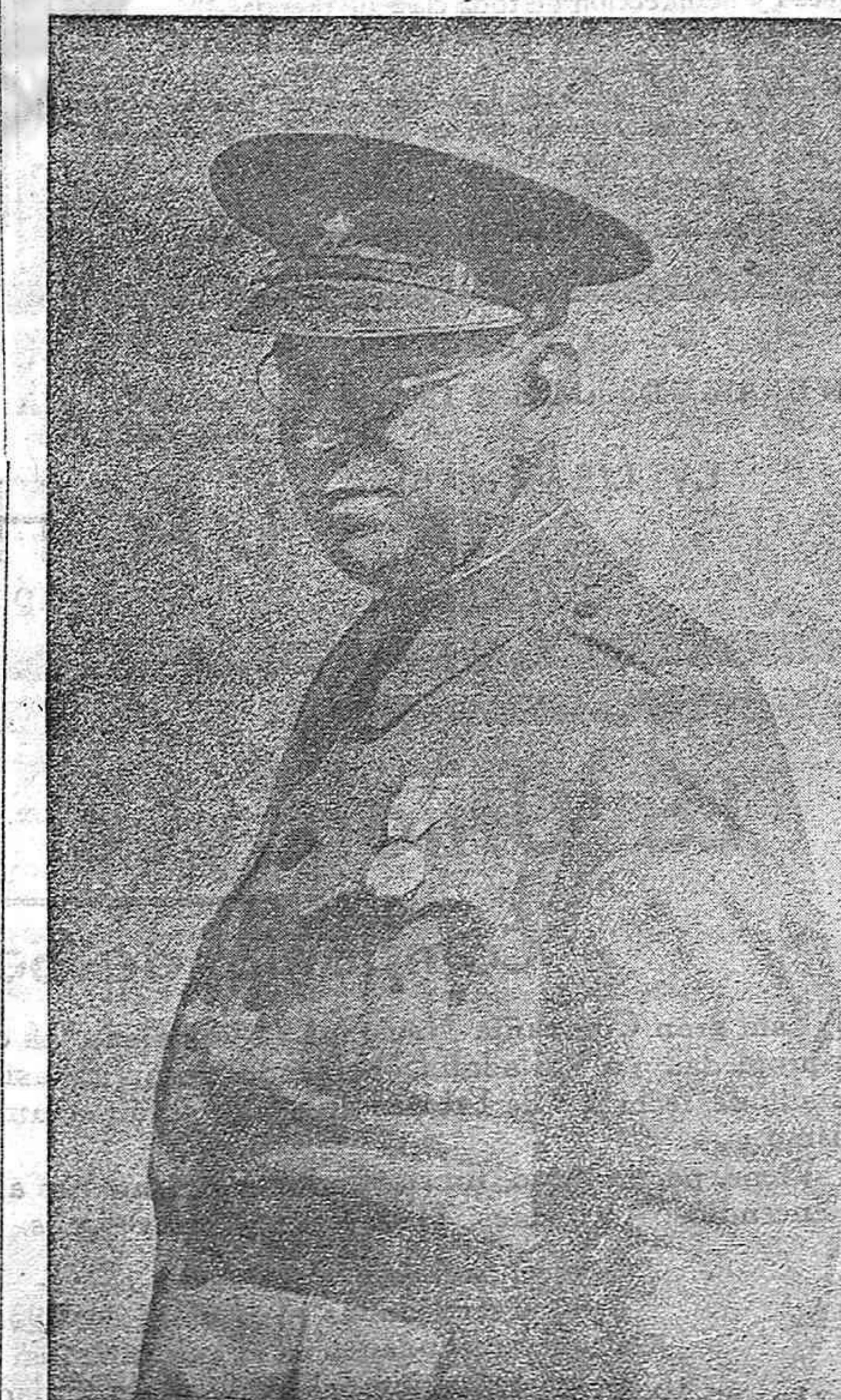
Don Emilio Mola, general en jefe del Ejército del Norte, cuya brillante actuación está dando a España muchos días de gloria

El Estado Mayor de la Armada ha publicado una nota en la que se refiere al hundimiento del acorazado "España". Las radios rojas dan cuenta de los combates y bombardeos aéreos sobre nuestros buques de guerra del Cantábrico y presentan como una victoria el hundimiento del "España". No ha habido en absoluto combate naval. El ataque aéreo ninguno sino un accidente fortuito: El "España" chocó con una mina a la deriva, de los numerosos que habían colado nuestros minadores en aguas de la zona. El accidente ocurrió cuando el "España" perseguía a un buque inglés mercante no obstante los avisos que se le dieron para burlar el bloqueo de Santander. El enemigo trata de elevar la decada y triste moral de su escuadra con la invención de un hecho que no ha existido nunca y con las calumnias que dirige al comandante y a la oficialidad del destructor Velasco que llevó a cabo el salvamento completo de toda la oficialidad del "España". Se desalojó el barco con un orden y una disciplina ejemplares sin que en ningún momento hicieran acto de presencia en el lugar del accidente ni avión alguno del adversario. El silencio que por discreción se guarda siempre en las operaciones militares no permite sin embargo, que en el Mediterráneo y en el Atlántico, se repitan constantemente las hazañas de nuestra gloriosa Marina de guerra. La marina nacional que comenzó con el acto sumo de someter dos grandes cruceros cañoneros sublevados y que