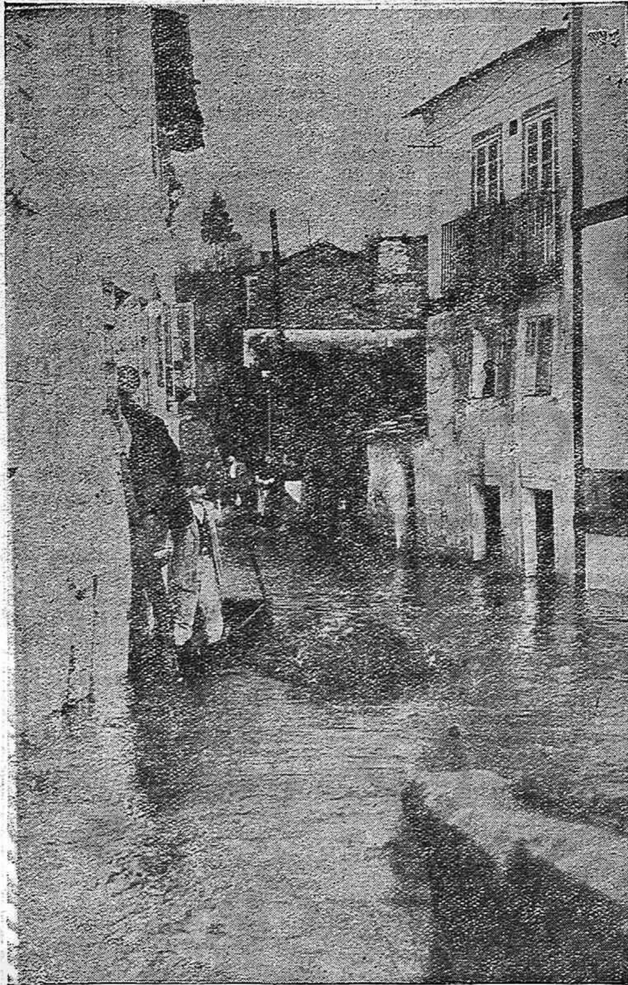
En esa situación quedan las primeras casas de la calzada del Puente cuando se le hinchan las narices al Miño

La fábrica de luz eléctrica del Ayuntamiento y el edificio de máquinas de la traída de aguas se hallan en grave situación, no pudiendo, por lo tanto, funcionar dichos servicios.—En algunos puntos ha sido cortada por las aguas la vía férrea.—Carreteras interceptadas.—Noticias de los pueblos de la provincia