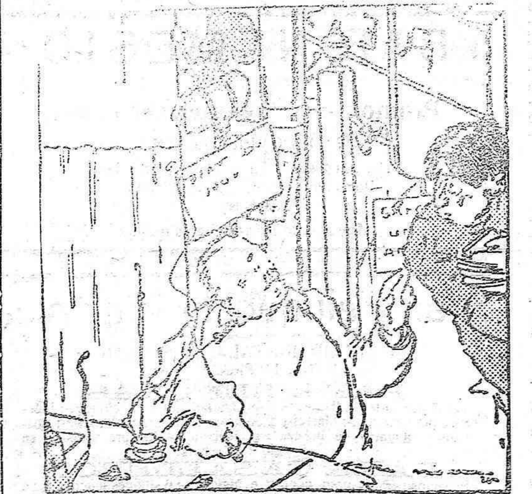
—¿Ha visto usted que desde que me he casado viene menos gente a comer a mi casa? —Claro; a quien se le ocurre, tener un restaurant y casarse con un dentista.