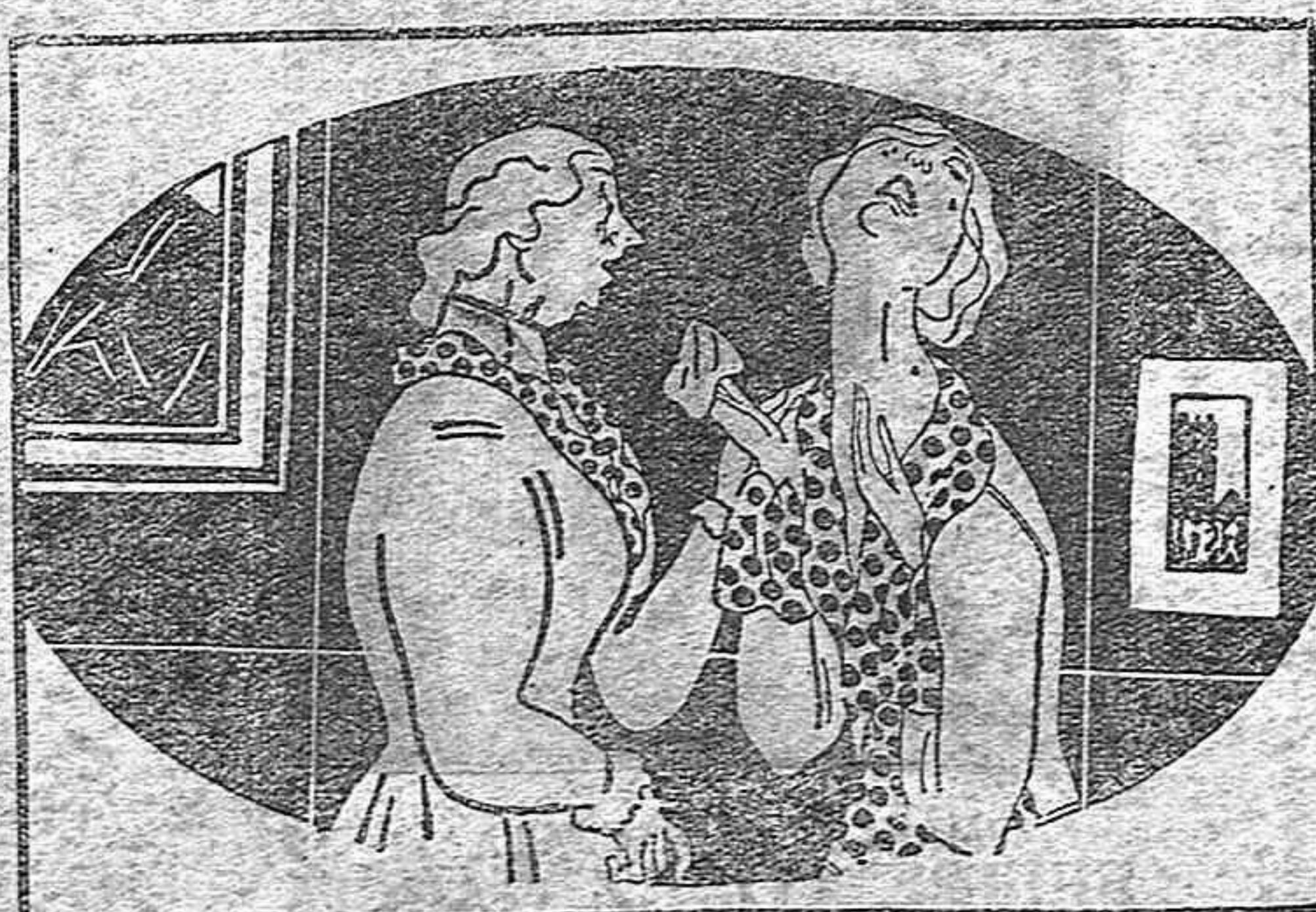
La hija.—Pediré el divorcio. Jorge es el hombre más perverso del mundo. La madre.—¿Por qué? ¿Qué te hizo? La hija.—Ha enseñado al loro a sustituirlo en nuestras disensiones.

Puesto lo sucedido en conocimiento de la Guardia civil del puesto de esta capital, se practicaron las convenientes pesquisas, que dieron por resultado la detención de un tal Ramiro, vecino de la expresada parroquia, el cual fué conducido a Lugo, ingresando en la cárcel a disposición del juez de instrucción del partido.