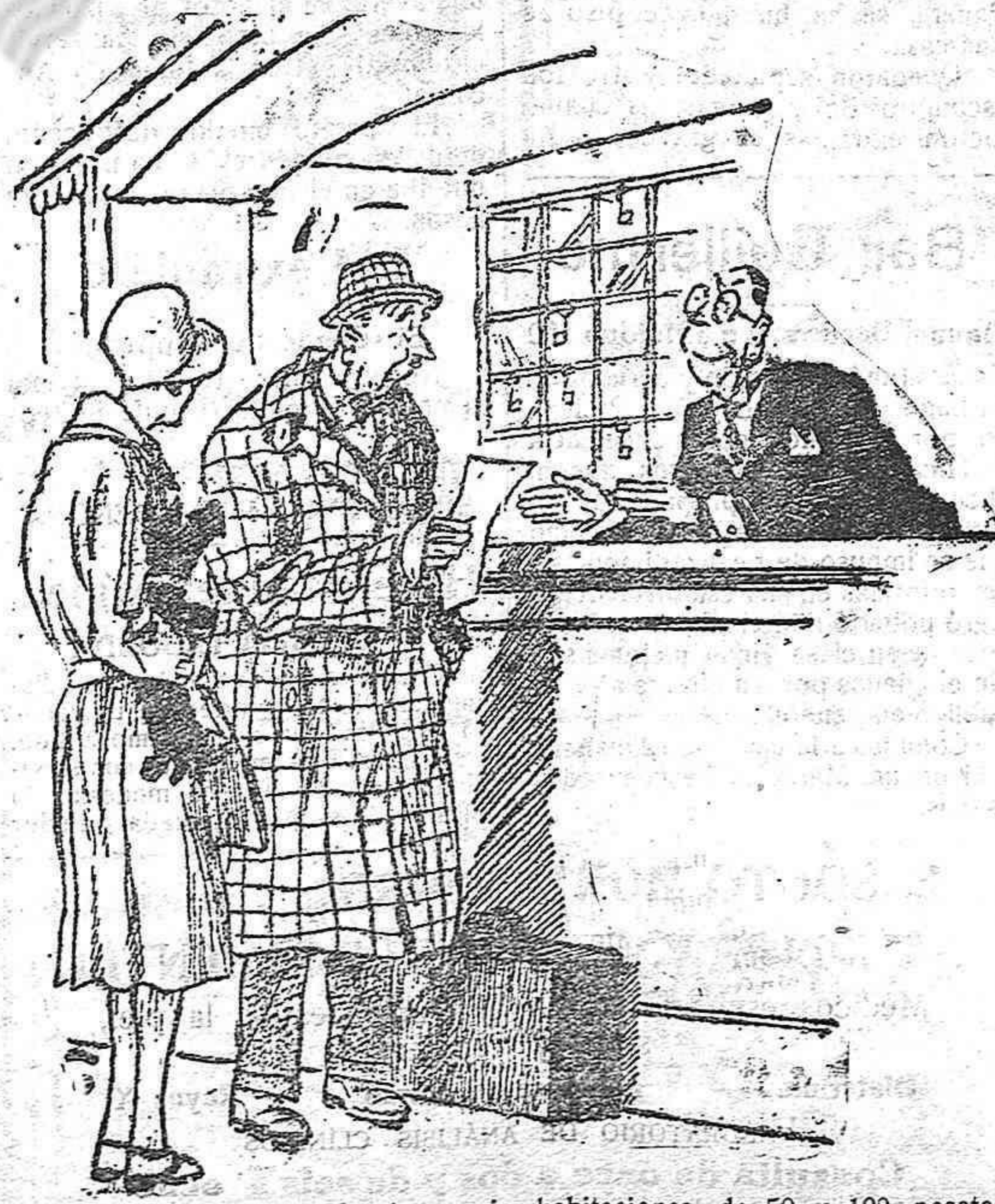
Al salir del hotel.—Usted anuncia: habitaciones de 50 y 100 pesetas. ¿Cómo en la cuenta la pone a 150? —Justamente, señor! 50 y 100... ¿Quiere usted hacer el favor de sumar?

Por orden de la Dirección general de Comunicaciones se convoca a concurso para dotar a la Estafeta de Monforte de Lemos de local adecuado, con habitación para el subterno de la misma, por tiempo de cinco años, que podrán prorrogarse por la falta de uno en uno y sin que el precio máximo de alquiler exceda de 3.000 pesetas anuales.