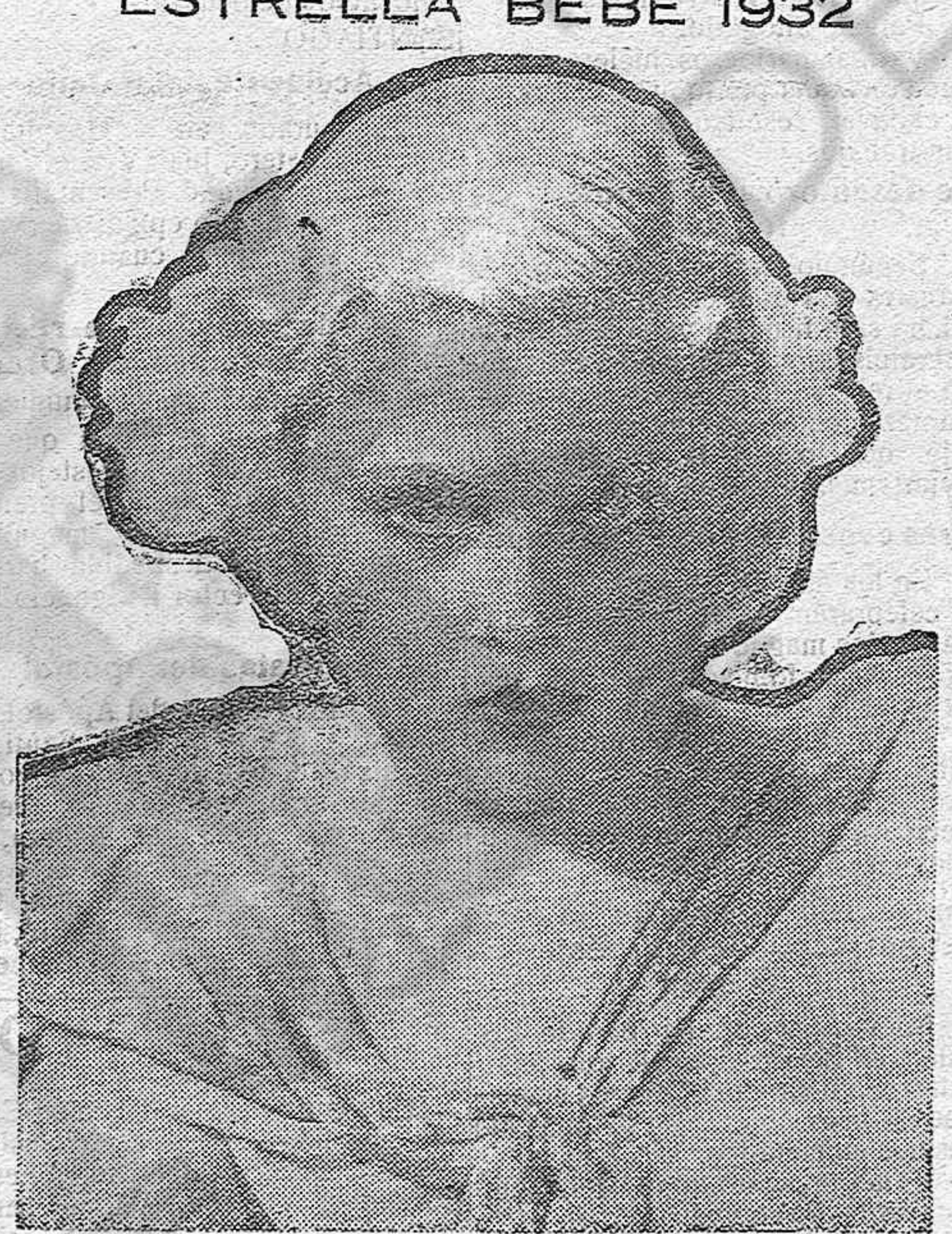
MARY CARLISLE, la del rubio pelo encendido, ha sido elegida «Estrella Bebé 1932» por la Asociación de periodistas cinematográficos de Hollywood, en premio a sus actuaciones ante la Cámara durante el pasado año.

Zapatos preciosos por muy poco dinero. Enviamos muestras a domicilio. Llame al teléfono 264 X CALZADOS CIUDADELA Doctor Castro 7 Lugo.